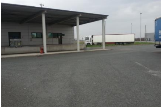
Slika 3. Fitosanitarna inspekcija na GP Bajakovo