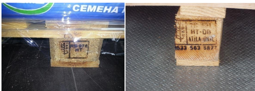
Slika 16. Palete označene službenom oznakom

Drveni materijal za pakiranje mora biti izrađen od okorenog drva. Na drvu koje se koristi za izradu drvenog materijala za pakiranje koje je tretirano i označeno smiju ostati komadići kore. Komadići kore moraju biti vizualno odvojeni i jasno se razlikovati.