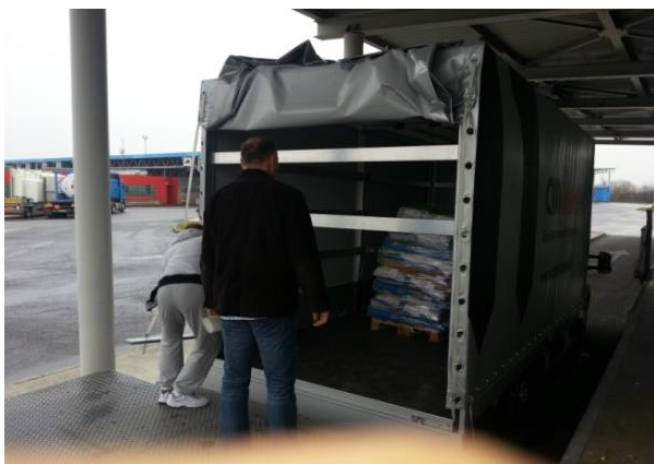
Slika 12. Utvrđivanje istovjetnosti pošiljke

4. 4. 2. Poljoprivredni sadni materijal - obuhvaća reproduksijski sadni materijal, sadnice, presadnice povrća i ukrasno bilje, osim šumskoga sadnog materijala. Sadni materijal koji se proizvodi i stavlja na tržište može biti sljedećih kategorija: