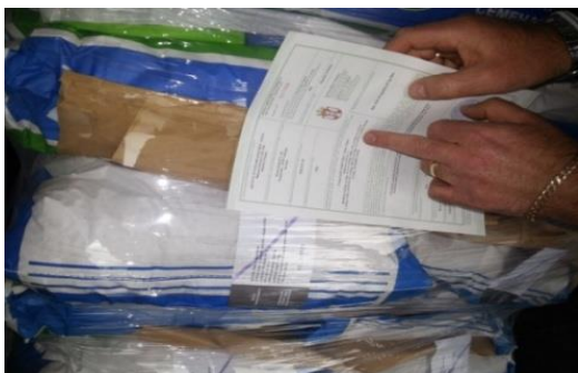
Slika 8. Usporedba pošiljke s pratećim ispravama

Provjerom isprava utvrđuje se je li uvoznik upisan u Upisnik proizvođača, prerađivača, uvoznika i distributera određenoga bilja, biljnih proizvoda i drugih nadziranih predmeta (prilog 7.). Provjerava se prati li pošiljku ispravan fitosanitarni certifikat i druga jednakovaljana isprava te je li pošiljka označena oznakom u skladu s fitosanitarnim normama donesenim na temelju međunarodnih konvencija. Provjera identiteta pošiljke provjerava se usporedbom sadržaja pošiljke s podacima upisanim u pratećim ispravama i oznakama na pakiranju (slika 8).