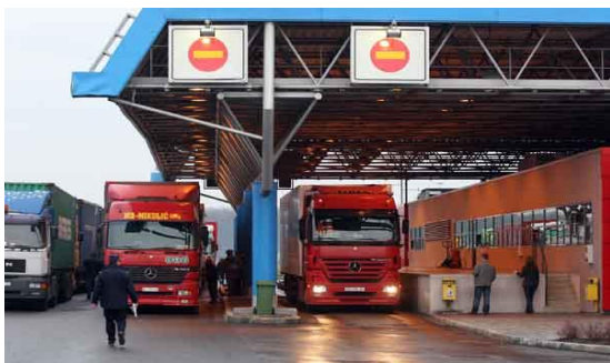
Slika 2. Carinska i policijska kontrola