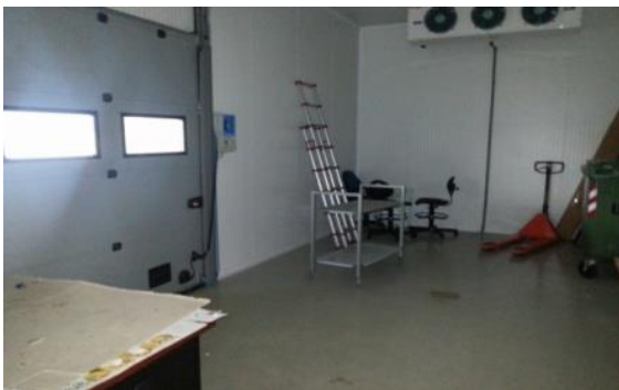
Slika 6. Rashladna komora za deponiranje uzoraka bilja