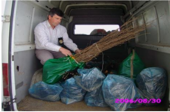
Slika 13. Uvoz sadnog materijala