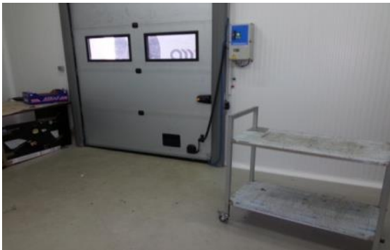
Slika 5. Prostorija za pregled i skladištenje bilja