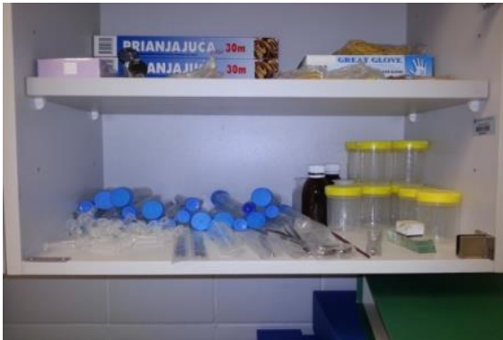
Slika 4. Laboratorijska oprema