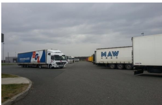
Slika 7. Carinski terminal za teretna vozila

Bilje, biljni proizvodi i drugi nadzirani predmeti koji se unose iz trećih zemalja moraju se od trenutka ulaska na carinsko područje Republike Hrvatske nalaziti pod carinskim nadzorom i podliježu fitosanitarnom pregledu. Fitosanitarni inspektor vrši vizualni pregled pošiljke, provjerava isprave, identitet i zdravstveno stanje bilja, biljnih proizvoda i drugih nadziranih predmeta s namjerom da se utvrdi jesu li prisutni štetni organizmi (prilog 6.). Carinski postupak ne može započeti prije nego što se obavi fitosanitarni pregled. Biljke ostaju pod carinskim nadzorom (slika 7.) sve dok fitosanitarni inspektor na propisani način ne potvrdi da je fitosanitarni pregled obavljen.