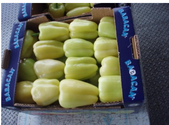
Slika 15. Izdvojeni uzorak za pregled