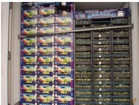
Slika 14. Kontrola konzumne robe

jeziku zemlje podrijetla ili na nekom drugom jeziku razumljivom potrošačima zemlje odredišta. Inspekcijski nadzor i kontrolu usklađenosti voća i povrća s tržišnim standardima pri uvozu iz trećih zemalja na graničnom prijelazu obavljaju fitosanitarni inspektori prije postupka carinjenja. (slika 14.). Uvoznik je obavezan najmanje jedan radni dan prije prispjeća pošiljke voća i povrća nadležnom fitosanitarnom inspektoru najaviti pošiljku. Kada dodje na granični prijelaz dužan je odmah obavijestiti nadležnoga fitosanitarnog inspektora. Fitosanitarni inspektor izdvojiti će uzorak pošiljke i provjeriti da li je voće i povrće koje se uvozi usklađeno s tržišnim standardima (slika 15.). Ako fitosanitarni inspektor utvrdi da voće i povrće zadovoljava tržišne standarde tada će dopustiti njegov uvoz i izdati potvrdu o usklađenosti s tržišnim standardima.