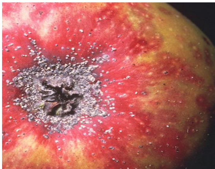
Slika 10. Kalifornijska štitasta uš ( Quadrastidiotus perniciosus )