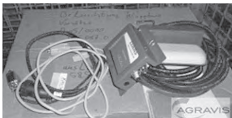
Slika 1. OBU Claas

Komunikacijski modul (Slika 2.) služi kao posrednik između telemetrijske opreme ugrađene u poljoprivredni agregat i komunikacijske mreže. Podaci se u centralni informacijski sustav odašilju i primaju putem GSM mreže kroz podatkovni protokol koji omogućuje razmjenu podataka unutar GSM mreže.