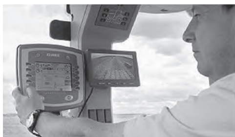
Slika 2. Komunikacijski modul

GPS navigacijski prijemnik (Slika 3.) očitava poziciju agregata putem sustava globalnog pozicioniranja. Navigacijski prijemnik koji se koristi u telematskim sustavima je zaseban elektronski modul koji se ugrađuje na kabinu poljoprivrednog agregata.