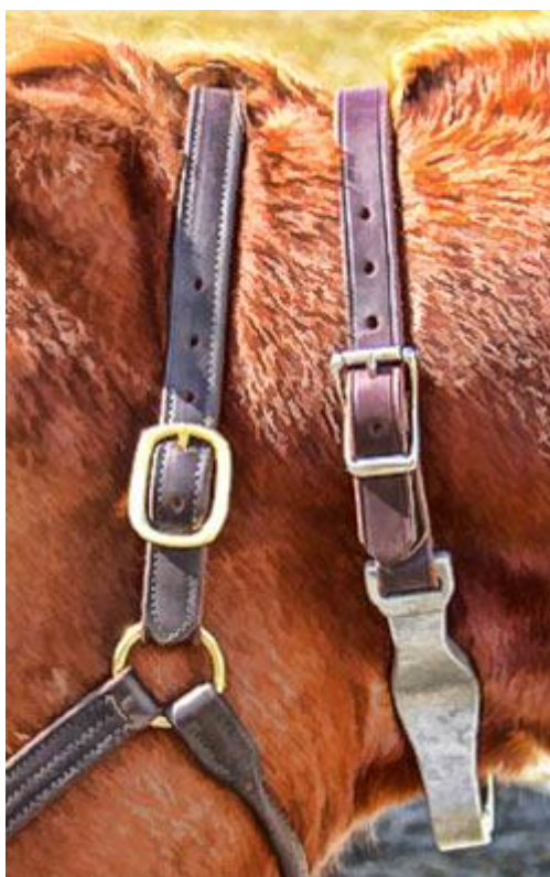
Slika 6. Ogrlica koja sprječava gutanje zraka