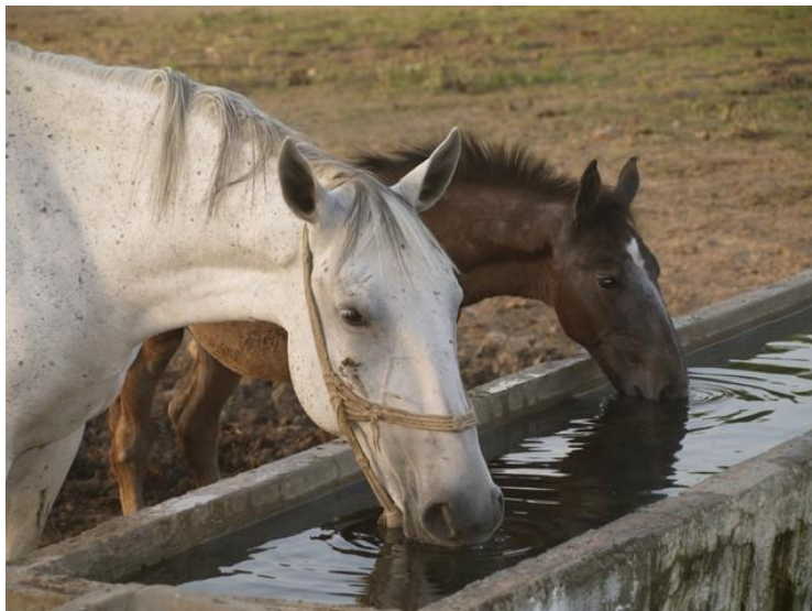
Slika 4. Konji piju vodu po volji iz korita na pašnjaku

Također se problem javlja što će niže rangirana grla kasnije doći na hranidbeni stol. To se rješava postavljanjem većih korita za hranu i vodu s više hrane i vode od norme za taj broj životinja. Korištenje koncentrirane krme konjima daje više energije. Istovremeno zauzima manje prostora u probavnom traktu konja, što kod njih izaziva osjećaj gladi. Zato je, uz točno određenu količinu koncentrata, potrebno staviti sijena po volji. Rowe je (1994) utvrdio da veća količina koncentrata povećava količinu želučane kiseline i time dolazi do probavnih smetnji. Rješavanje problema žeđi je riješeno omogućavanjem pristupa konjima svježoj i pitkoj vodi cijeli dan (Slika 4.).