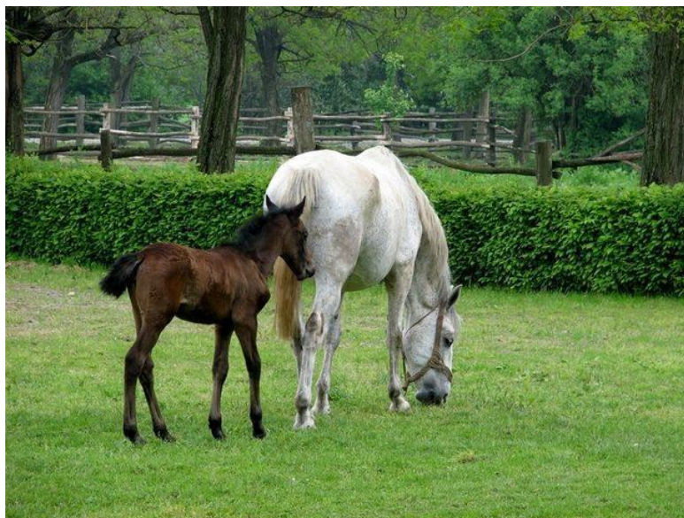
Slika 3. Ždrijebe slijedi kobilu na pašnjaku