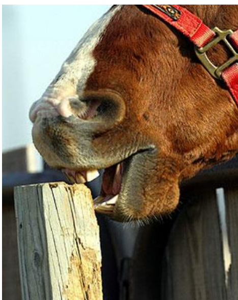
Slika 5. Konj grize drvenu ogradu