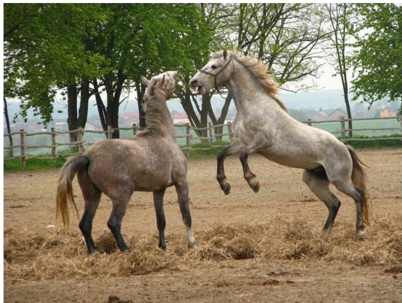
Slika 2. Mladi pastusi u borbi za dominaciju u krdu ( http://www.ergeladjakovo.hr/content/lipicanci )

Socijalna organizacija krda predmet je mnogih istraživanja. To je dobro za uzgajivače konja i konje, jer će se bolje razumjeti veze između konja međusobno i konja s ljudima. Proučavanje odnosa divljih konja i konja u slobodnom načinu uzgoja, moći ćemo lakše sami stvarati grupe domaćih konja u intenzivnom uzgoju znajući njihove potrebe za druženjem i prostorom. Rjeđe će dolaziti do ozljeda unutar grupa i olakšan će biti rad s konjima, a konjima sam boravak u krdu. Konji su evoluirali iz malih šumskih životinja u srednje velika biljojede otvorenih pašnjaka. Danas nema istinskih divljih konja, ali ima mnogo krda domaćih konja koji su na različite načine dospjeli u divljinu, u za konje prirodni okoliš i tamo žive kao divlji konji (Keiper, 1986). Divlji konji provedu 16-18 sati na dan pasući, konzumiraju preko 50 različitih vrsta biljaka. Žive u grupama koje čine 1 ili više pastuha, nekoliko kobila i njihov podmladak. Mladi pastusi - omaci napuštaju krda u dobi od 1 do 2 godine i čine grupu neženja. Mlade kobile - omice napuštaju krdo u dobi od 1 – 1,5 godine i odlaze u drugo krdo ili s mladim pastusima formiraju novo krdo. Brojnost krda je važna za obranu od predatora. Mala krda imaju nižu stopu ždrijebljenja i preživljavanja ždrjebadi (Welsh, 1975). Svaki konj unutar krda zna svoje mjesto u hijerarhiji krda. To je važno zbog smanjivanja sukoba unutar krda i održavanja grupe na okupu (Pickett, 2009).