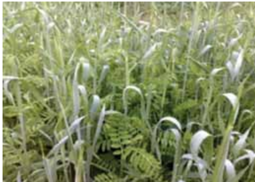
Slika 4. Smjesa raži i grahorice/