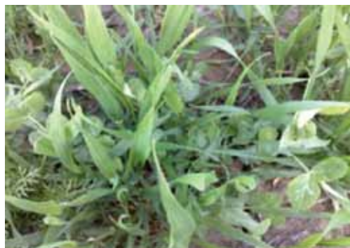
Slika 2. Smjesa stočnog graška i pšenice