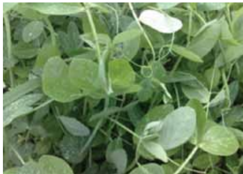
Slika 3. Stočni grašak