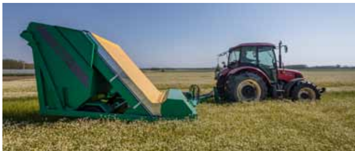
Slika 1. Kombajn za berbu kamilice

Samokretni kombajni rade na principu pročešljavanja – češljevi skidaju cvjetne glavice sa stabljiki. Kvaliteta berbe u ovom slučaju ovisi o brzini okretaja i podešenosti rotirajućih češljeva na ubiračkom uređaju. (Poljak, 2013) Samokretni kombajni zahtijevaju veće troškove po satu rada u odnosu na vučeni berač, ali je veća cijena koštanja kod njih opravdana većom količinom ubrane kamilice.