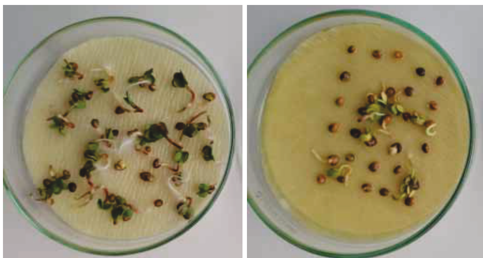
c) ekstrakt koncentracije 2,5 %