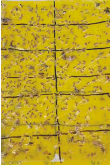
Slika 6. Ulov američkog cvrčka na žutoj ljepljivoj ploči

ukazuje na ozbiljnost ovog problema i obaveznu zaštitu kroz tri zakonski propisana tretiranja. Također je na žutim ljepljivim pločama iz matičnjaka podloga uočena dominacija američkog cvrčka u odnosu na ostale kukce, dok su u ostalim vinogradima populacije drugih kukaca bile veće od populacije američkog cvrčka.