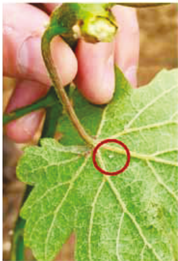
Slika 2. Ličinka 2. stadija na naličju lista vinove loze

Prezimljuje u stadiju jajeta u kori dvogodišnje rozgve ili starijem drvu, a vizualnim pregledom ih je jako teško uočiti. U istraživanju Bagnoli i Gargani (2011) utvrđeno je odlaganje jaja i na kori jednogodišnje rozgve, ali su vrijednosti bile izrazito niske u odnosu na starije dijelove biljke. Jaja su veličine 1 mm, lateralno spljoštena, prozirna. Pred kraj ovog stadija u jajima su vidljive crvene oči ličinki. Najčešće u svibnju pojavljuju se prve ličinke koje su jako sitne, prozirne s karakteristične dvije crne pjege na zatku. Ličinke prvih stadija je teško utvrditi bez povećala ili mikroskopa (L1 1,8 mm) i stoga je proizvođačima njihova prisutnost u vinogradu teško uočljiva i često prolazi nezapaženo. Nalaze se na naličju lista (Slika 2) i gotovo su nepomične osim ako su uznemirene, tada skaču, stoga pregled treba raditi jako oprezno.