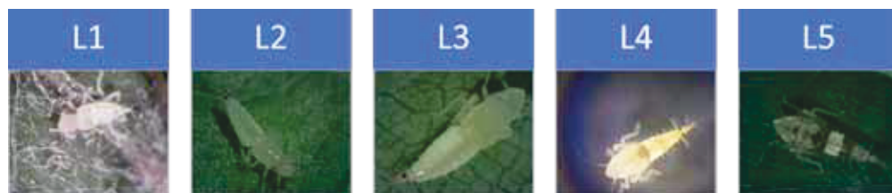
Slika 3. Stadiji razvoja ličinke američkog cvrčka (L1-L5)

Ličinka prolazi kroz pet razvojnih stadija intenzivno se hraneći (Slika 3). Ličinke prvog stadija su sitne, potpuno svijetle boje bez ikakvih obojenja osim crnih pjega na zatku i crvenih očiju, ličinke drugog stadija na zatku poprimaju bjelkastu boju lateralno čitavom dužinom zatka. Ličinkama trećeg stadija javljaju se dorzalno i tamne pjege na početku zatka (ovisno o starosti ličinke) te dlake na zatku poprimaju tamnu boju. Kod ličinki zadnjih stadija razvoja (L4 i L5) jasno su uočljive tamne pjege nepravilna oblika na tijelu, te se uočavaju začeci krila.