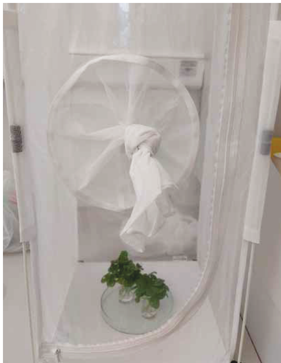
Slika 4. Uzgoj ličinki američkog cvrčka na crvenoj i bijeloj djetelini Figure 4 American grapevine leafhopper on red and white clover

Ako vektor ima širok krug biljaka domaćina to mu omogućava veći kapacitet zaraze. U Europi je domaćin američkom cvrčku uglavnom vinova loza Vitis vinifera L., međutim može ga se pronaći i na drugim vrstama iz ovog roda. Prema nekim istraživanjima štetnik je utvrđen i na vrbama i breskvama koje su uzgajane u blizini vinograda kao i na brijestu. Također se u literaturi navode i mnoge druge biljke s različitim staništa (livade, voćnjaci, šume) na kojima je pronađen cvrčak međutim nije dokazan status domaćina (Hill i Sinclair, 2000). Američki cvrčak je prema načinu ishrane oligofag i svoj životni ciklus završava na rodu Vitis (Chuche i Thiery, 2014). Osim navedenih biljnih vrsta u znanstvenoj literaturi se spominju i puzavi žabnjak ( Ranunculus repens L.), obična pavitina ( Clematis vitalba L.) i bijela djetelina ( Trifolium repens L.) kao biljke domaćini američkog cvrčka (Žežlina i sur., 2013). Prema našim istraživanjima (neobjavljeni podatci) ličinke američkog cvrčka se mogu razviti do odraslog stadija i na crvenoj i bijeloj djetelini iako je izražena visoka preferencija prema bijeloj djetelini (Slika 4 i 5). Ovaj podatak je od iznimne važnosti za proizvođače koji su u sustavu ekološke proizvodnje gdje se Pravilnikom o ekološkoj proizvodnji u uzgoju bilja i proizvodnji biljnih proizvoda (NN 91/2001) radi ublažavanja monokulture poljoprivrednike potiče na sjetvu travnih smjesa vrstama tipičnim za određeno područje i leguminoza među kojima je najčešća upravo djetelina.