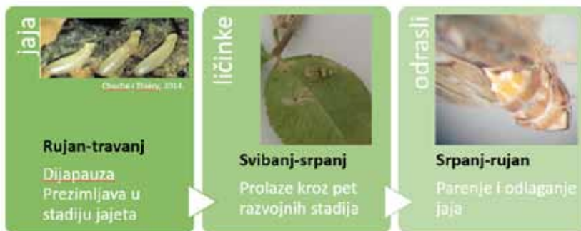
Slika 1. Životni ciklus američkog cvrčka

Američki cvrčak, Scaphoideus titanus Ball, 1932 (Hemiptera: Cicadellidae) je najznačajniji vektor fitoplazme, uzročnika zlatne žutice vinove loze u Europi, Flavescence dorée (Tramontini i sur., 2020). Iako je u Europi prisutan od početka 20. stoljeća i postoji niz zakonskih regulativa o obvezi njegovog suzbijanja, vektor se i dalje širi i prenosi bolest po europskim vinogradima. Američki cvrčak ima jednu generaciju godišnje u našim uvjetima (Slika 1).