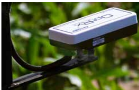
Slika 4. Bazna stanica Picture 4. Base station