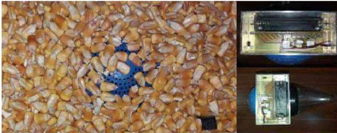
Slika 3. „Pametne“ lovke / Figure 2. The „smart“ pitfall trap

Cijeli sustav je opremljen optoelektroničkim sensorima smještenim na ulazu lovke, a omogućava detekciju, vremensko mjerenje i GPS koordinate ulaska kukaca (Slika 3.). Ova metoda omogućuje dobivanje podataka o ulasku kukaca, kao i parametre okolišne sredine koji se koreliraju s razvojem populacije kukaca i to s preciznošću od 98 do 99 %. Svi prikupljeni podaci se šalju bežičnim putem u centralnu bazu podataka u realnom vremenu te se na taj način dobiju točni i brzi podaci koji ubrzavaju donošenje odluka o provedbi metoda suzbijanja.