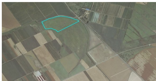
Slika 1 Pokušalište „Tenja“ Figure 1 Experimental field „Tenja“