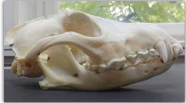
Slika 1. Zubalo čaglja.