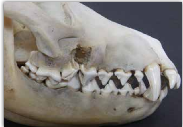
Slika 2. Dento-alveolarni apsces.