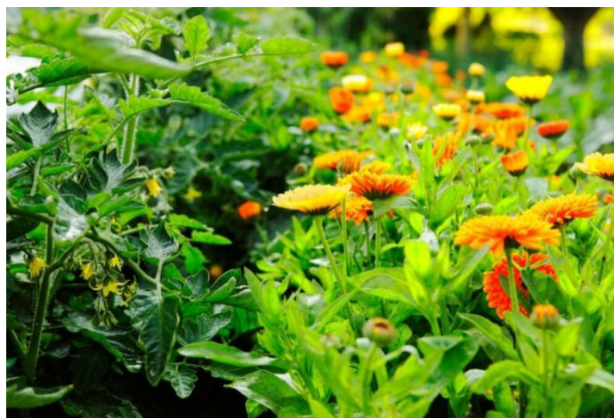
Slika 2. Neven ( Calendula officinalis L.)

Neven je jednogodišnja biljka. Pripada porodici glavočika ( Asteraceae ). Biljka se prepoznaje po cvatu koji je sastavljen od višebrojnih žutih do narančastih latica. Na stabljici se nalaze dlakavi listovi. Stabljika može narasti do 1 m visine, no to nije slučaj i u našim krajevima. Jedan je od najpoznatijih ljekovitih biljaka zbog čega je česta biljka koja se primjenjuje u kozmetici te ponekad i u medicinske svrhe. U kozmetici se koristi za pripremu krema koje pomažu u zacjeljivanju rana, modrica, proširenih vena pa čak i hemoroida. Čaj od nevena, redovito uziman, djeluje na čišćenje krvi. Ako se jedan tjedan prije početka menstruacije dnevno pije čaj od nevena, normalizira se tok menstruacije i znatno ublažuju smetnje (Willfort, 1978.). Neven dobro raste u dobro dreniranom tlu. Sadi se u rano proljeće. Biljka je kojoj odgovara obilna količina sunčeve svjetlosti. Zanimljiva činjenica je ta da se prema cvijetu nevena prepoznaje kakvo vrijeme nas očekuje. Odnosno, kada su glavice cvijeta širom otvorene i u punom cvatu očekuje nas lijepo vrijeme, a prilikom tmurnog i oblačnog vremena one su zatvorene. Prema tome dobile su naziv „vjesnici kiše“.