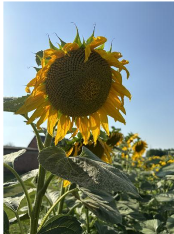
Slika 25. Cvijet suncokreta ( Helianthus annuus L., flos )

Isto tako, duboki korijen suncokreta je koristan za izdvajanje zaostalog dušika. Fitoremedijacija je nova metoda sanacije tala onečišćenog metala. Suncokret je naširoko prihvaćen za fitoupravljanje tlima kontaminiranim teškim metalima zahvaljujući visokoj proizvodnji biomase i sposobnosti akumulacije metala. Suncokreti mogu tolerirati toksične učinke određenih teških metala putem različitih mehanizama, poput poboljšanja aktivnosti antioksidativnih enzima, taloženje u neaktivnim dijelovima biljke i stimulacije osmolita. Pravilan odabir tolerantnih kultivara zajedno s agronomskim postupcima može biti učinkovita strategija za fitoupravljanje tlima kontaminiranim teškim metalima (Rizwan i sur., 2016.). Također, suncokret je poznat po tome što dobro podnosi sol, tla sa većim salinitetom mogu se popraviti upotrebom suncokreta. Suncokret je također dobra prateća biljka u vrtu, preporučuje se posaditi uz krastavac, koji se može lako penjati po suncokretu.