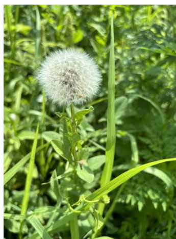
Slika 23. Sjemenke maslačka ( Taraxacum officinale F.H.Wigg, semina )