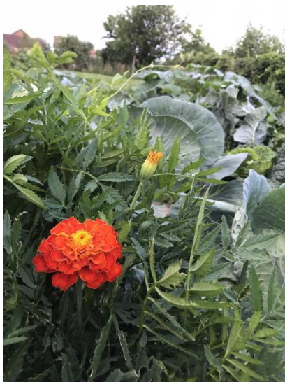
Slika 1. Francuska kadifa ( Tagetes patula L.) Foto: Bjelobrk A.M., 2024.

posaditi početkom svibnja kada su prijetnje od pojave mraza vrlo niske. Tagetes patula L., važna je ljekovita biljka, koristi se kod raznih poremećaja poput nadražaja kože, problema sa očima, ozljeda i želučanih problema. Bogat je izvor derivata tiofena, flavonoida, karotenoida, terpena i terpenoida (Riaz i sur., 2020.).