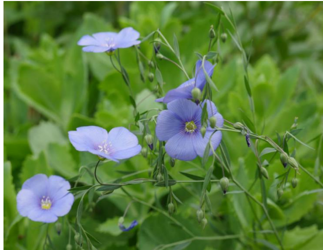
Slika 8. Lan ( Linum usitatissimum L.)

plavim cvjetovima, iako se javljaju i u drugim bojama kao što su bijeli i ružičasti cvjetovi (slika 8.). Biljka privlači pčele koje ih oprašuju, a nakon oprašivanja cvjetovi okrugle sjemene mahune. Ljekovita je biljka. Uzgaja se zbog vlaknastih struktura i sjemenja. Za uzgoj biljci pogoduje dobro drenirano pjeskovito-ilovasto tlo s dobrim kapacitetom zadržavanja vode. Ako se biljka sije na tlu gdje je veća propusnost tla za vodu tada je potrebno sjeme i mlade biljke redovito zalijevati i održavati tlo vlažnim. Sjeme se posije najkasnije do svibnja, izravno u tlo. Optimalno mjesto za uzgoj jest ono gdje dopijeva obilna količina sunčeve svjetlosti. Lan je jedna od najstarijih kultiviranih biljaka na svijetu koja ima koristi od sjemenki i vlakana. Važan je nutrijent zbog bogate \alpha -linolne kiseline (ALA, omega-3 masne kiseline), lignana, polinezasićenih masnih kiselina, topivih i netopivih vlakana, fitoestrogenih lignana, spojeva voska, proteinske i antioksidativne spojeve. Osim toga, sjeme sadrži komponente učinkovite u smanjenju kardiovaskularnih poremećaja, dijabetesa, probavnog sustava, poremećaja urinarnog trakta, osteoporoze, raka, artritisa, autoimunih i neuroloških bolesti. Međutim, nesvjesna konzumacija sjemena može uzrokovati toksičnost zbog tripsina, inhibitora mio-inozitol fosfata, kadmija i cijanogenih glikozida u sjemenu (Arslanoglu i Aytac, 2020.).