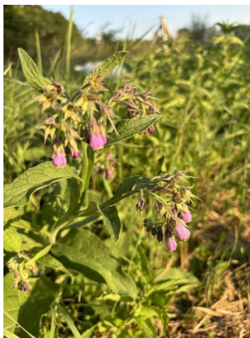
Slika 21. Gavez ( Symphytum officinalis L.)