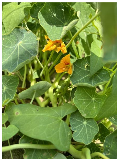
Slika 7. Cvijet dragoljuba ( Tropaeolum majus L., flos )

Osim što služe kao ukras u vrtovima, dobar su susjed u povrtnjacima i voćnjacima. Mnoge biljke pokazuju insekticidna svojstva. Ključ njihove upotrebe za dobrobit je njihova upotreba na biljkama koje su vrlo različite i stoga proizvode različite fitokemikalije. Na primjer, dragoljub odbija mnoge štetočine, ali u bližem je srodstvu s porodicom Brassicaceae i stoga bi bio uglavnom neučinkovit protiv kupusnog bijelca ili drugih štetnika kupusnjača jer bi njihove fitokemikalije privukle više štetnika (Kuepper i Dodson, 2001.). Dragoljub se sadi uz grah jer može djelovati kao „biljna zamka“ za lisne uši i meksičke grahove zlatice i drži ih podalje od graha. Nakon nakupljanja štetnika na dragoljub, biljka se vadi iz zemlje i uništi s nakupljenim štetočinama. Zatim, može se koristiti kao „biljna zamka“ za kupusnog bijelca. Kupusni bijelac polaže jaja te se hrani na dragoljebu umjesto na kupusu. Dragoljub proizvodi jednu vrstu ulja (gorušičino ulje) koje privlači insekte poput kupusnog bijelca (Sanjerehei, 2023.).