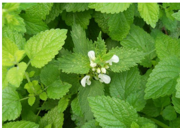
Slika 15. Matičnjak ( Melissa officinalis L.)