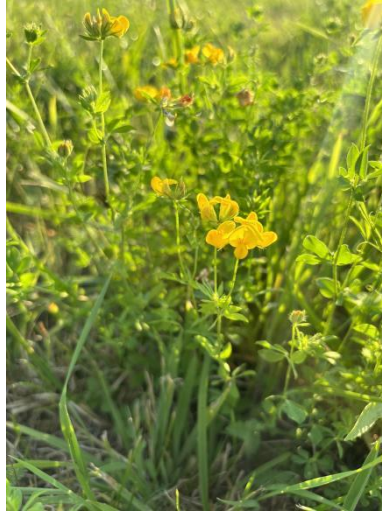
Slika 27. Cvijet piskavice ( Trigonella foenum-graecum L., flos )