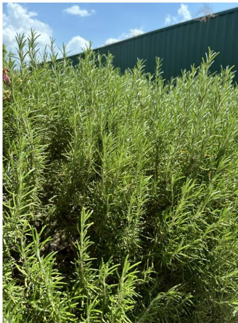
Slika 11. Ružmarin ( Salvia rosmarinus spenn.)

Ružmarin je grmolika, zimzelena biljka. Pripada porodici usnača ( Lamiaceae ). Poznata je po intenzivnom mirisu. Vrlo je razgranata biljka, uspravnih grana koja može narasti do 2 m visine (slika 11.). Na grančicama nalaze se čvrsti, kožasti i vrlo uski listovi. Listovi su s gornje strane tamnozeleno boje, a sa donje sivo-bijele boje. Na vrhu grančice razvijaju se mali ljubičasto-plavi cvjetovi. Cvjeta od ožujka do svibnja, a katkad u rujnu cvijeta po drugi put. Za sobom biljka ostavlja plod (kalavac). Sadrži ulja u cvjetovima, listovima i grančicama, ovisi o klimi, osunčanim i zaštićenim položajima. Poznata je biljka koja raste na sunčanim i kamenitim područjima. Uzgaja se na siromašnom, humusnom i dobro dreniranom tlu. Upotrebljava se kao začim, koriste se svježi i sušeni listovi. Destilacijom listova dobiva se eterično ulje koje se često koristi u kozmetici. Hranjivi sastav ružmarina otkriva veliku količinu vitamina i minerala. Najbolje proučeni bioaktivni spojevi su karnozna kiselina, karnozol, kafeinska kiselina i njezin derivat ružmarinska kiselina. Prepoznate su brojne biološke aktivnosti ružmarina, uključujući antioksidante, antibakterijske i antifungalne, antikancerogene, protuupalne i ostale aktivnosti (Ribeiro-Santos i sur., 2015.).