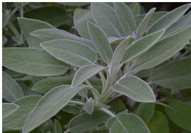
Slika 17. Kadulja ( Salvia officinalis L.)

Kadulja je višegodišnja biljka, može narasti do 50 cm. Pripada porodici usnača ( Lamiaceae ). Donji dijelovi stabljike su drvenasti s jakim korijenom, a gornji dijelovi su zeljasti. Na stabljici nalaze se uski listovi, eliptičnog oblika. Cijela biljka je sivkasto-zelene boje, upravo zato što je prekrivena dlačicama koje joj daju takvu boju (slika 17.). Na vrhu ogranka razvijaju se ljubičasti cvjetovi. Miris listova je poput kamfora (smolaste teksture, gorkog okusa i bezbojan), vrlo je aromatična biljka, a okus je pomalo gorak. Kadulja raste u našim područjima na kršu. Pogoduju joj visoke temperature koje su za nagomilavanje eteričnog ulja vrlo potrebne. Otporna je na sušu, a svojim korijenom sprječava nastanak erozije. Zbog toga, kod sabiranja biljke preporučuje se biljku čupati bez korijena. Uzgaja se na humusnom tlu s dobrim vodozračnim režimom. Biljka je osjetljiva na mraz i niske temperature. Biljka sadrži ljekovite tvari. Zbog svojih ljekovitih svojstava uzgaja se radi dobivanja eteričnog ulja i raznih drugih pripravaka (droga). Kadulja djeluje na čišćenje krvi, pospješuje izlučivanje sluzi i organa za disanje, djeluje i na izlučivanje sluzi iz želuca, pa bolesnik ponovo dobiva izgubljeni apetit (Willfort, 1978.).