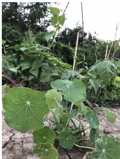
Slika 6. Listovi dragoljuba ( Tropaeolum majus L., folium )

vitamina C. Zbog svog bogatog fitokemijskog sadržaja i jedinstvenog elementarnog sastava dragoljub se koristi u liječenju mnogih bolesti npr. bolesti dišnog i probavnog sustava. Primjenjuje se i u dermatologiji jer poboljšava stanje kose i kože (Jakubczyk i sur., 2018.).