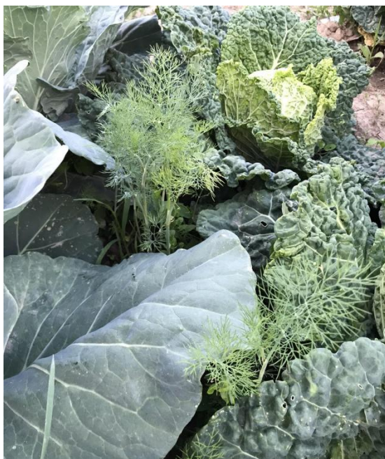
Slika 18. Kopar ( Anethum graveolens L.)

izlučivanje mokraćne, a pospješuje i izlučivanje mlijeka kod žena koje doje (Willfort, 1978.).