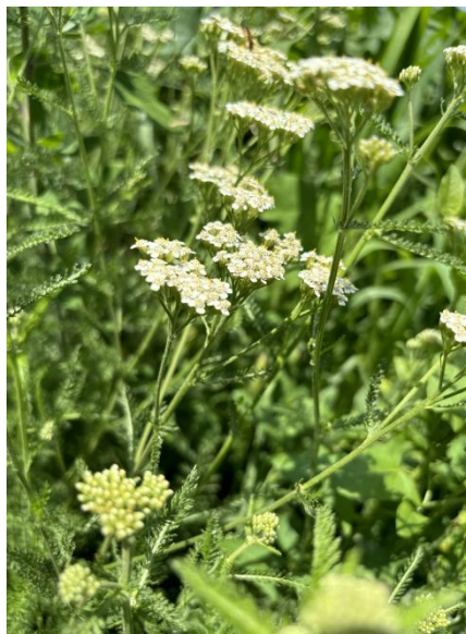
Slika 5. Stolisnik ( Achillea millefolium L.)

Stolisnik je trajna zeljasta biljka. Pripada porodici glavočika ( Asterceae ). Iz podanka u proljeće potjeraju široki, kovrčavi prizemni listovi, a zatim istjera stabljika. Stabljika je glatka i uspravna i nosi listove s kratkom peteljkom. Biljka je poznata po svojim bijelim ili ružičasto-bijelim cvjetićima skupljenim u cvat, nalaze se na vrhu stabljike (slika 5.). Nakon cvatnje za sobom ostavlja dugoljaste, srebrno-sive plodove (roška). Biljka može narasti do 80 cm visine. Listovi i cvjetovi imaju aromatičan miris, okus biljke je gorak. Proširen je diljem Europe. Vrlo često biljku nalazimo uz prometnice, na livadama, pašnjacima ili pak u vrtu. Stolisnik je skromna biljka, nema velike zahtjeve kod uzgoja. Otporan je na sušu, vrućine i hladnoću. Jedina mana je ta da mu ne odgovara vlažna ili isključivo mokra staništa. Stolisnik od davnina koristio kao lijek, ali i dan danas se koristi, najčešće u kozmetici. Također se koristi kao protuupalno sredstvo i hepatoprotektivna je biljka. A. millefolium smatra se sigurnim za dodatnu upotrebu. Propisuje se kao adstringentno sredstvo. Propisuje se kod hemoroida, glavobolje, poremećaja krvarenja, modrica, kašlj, gripe, upale pluća, bubrežnih kamenaca, visokog krvnog tlaka, menstrualnih poremećaja, groznice, reumatoidnog artritisa, gihta, osteoartritisa, vodenih kozica, šećerne bolesti, probavnih smetnji, ekcem, psorijaza i čirevi (Akram, 2013.).