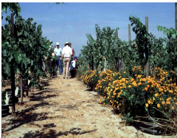
Slika 20. Uzgoj kadife u svrhu zaštiti mlade vinove loze od nematoda