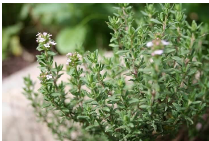
Slika 16. Timijan ( Thymus vulgaris L.)