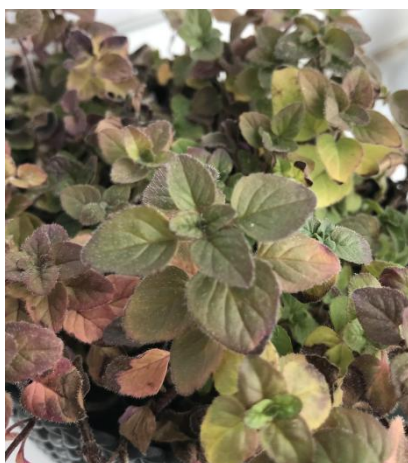
Slika 14. Mažuran ( Origanum majurana L.)

Mažuran je jednogodišnja biljka (slika 14.). Pripada porodici usnača ( Lamiaceae ). U obliku je malog grma, visokog 20 - 40 cm. Na kratkoj peteljci nalaze se mali dlakavi listovi, eliptičnog oblika i sivkaste boje. Na vrhu stabljike razvijaju se pršljenasti cvatovi unutar kojih se nalaze mali blijedo-crveni ili bijeli cvjetovi. Karakteristično je jako aromatičan i gorkog okusa. Mažuran je biljka kojoj odgovaraju toplije klime, poput mediteranske. Izrazito je ljekovita biljka te pomaže u raznim tegobama. Mažuran se upotrebljava kao sredstvo protiv grčeva, ublažuje bolove kod upale živaca, astme, glavobolje, migrene, vrtoglavice i još mnogo toga. Lagani čajni oparak od mažurana veoma pomaže u liječenju crijevnih grčeva kod djece (Willfort, 1978.). Potpuno se udomaćio u povrtnjacima. Dobro se slaže sa svim povrćem u vrtu, a njegovi cvjetovi ružičasto-bijele boje svojim jakim mirisom privlače bubamare, pčele i druge kukce. Preporučuje se saditi ga kao prateću biljku uz rotkvicu, aromatičan miris mažurana tjera štetnike poput mrkvine muhe, žižka i kupusnog moljca. Također, izvrsna je prateća biljka bundevi, izvrsno pokriva tlo i privlače osolike muhe koje se hrane lisnim ušima. Biljke kao što je mažuran s gustim lišćem i pokrivačem tla, zasjenjuju tlo i održavaju ga vlažnim. Osim toga, mažuran poboljšava okus pratećih biljaka (Sanjerehei, 2023.).