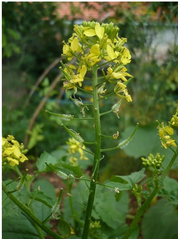
Slika 26. Bijela gorušica ( Sinapis alba L.)

protok krvi (Willfort, 1978). Fenoli i flavonoidi koji se nalaze u gorušici imaju antioksidativno djelovanje, ti prirodni antioksidansi imaju antikancerogena svojstva, inhibiraju apoptozu i stvaranju reaktivnih kisikovih vrsta (Khatib i Al-Makky, 2021.). Bijela gorušica izvrstan je susjed u našem vrtu, jer ga štiti od raznih prijetnji i doprinosi kvaliteti tla. Štiti susjedne biljke od nematoda i korovnih vrsta. Dezinfekcijska svojstva bijele gorušice mogu biti od koristi biljkama osjetljivim na probleme s nematodama, crvima i puževima. Hemayati i sur. (2017.) proveli su istraživanja na bijeloj gorušici. Kombinacijom bijele gorušice i uljane rotkve utvrdili su učinkovitost protiv cistolike nematode šećerne repe. Ustanovili su da sadnjom uljarica i bijele gorušice kao drugog usjeva u razdoblju između žetve žitarica i sadnje šećerne repe imaju višestruke prednosti kao što su poboljšanje proizvodnje šećerne repe, smanjenje nematode šećerne repe, zamjena upotrebe pesticida, sprječavanje ispiranja nitrata, suzbijanje korova i inhibicija erozije tla. Osim što odbija štetočine, također privlači oprašivače pčele i leptire. Biljka je vrijedan radnik, povećava plodnost tla i poboljšava njegovu strukturu.