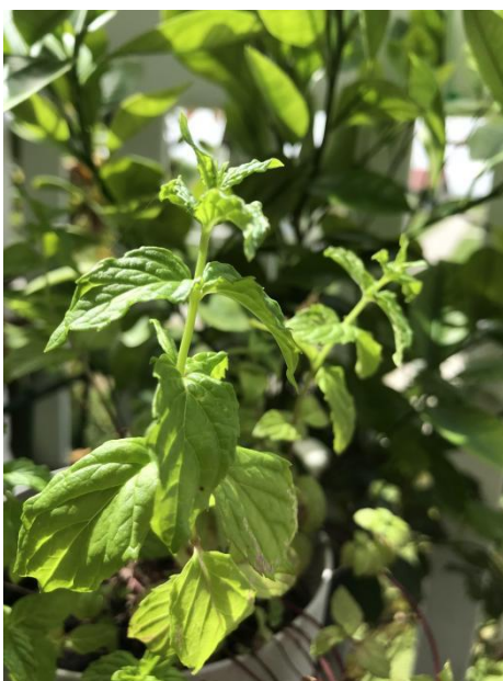
Slika 12. Paprena metvica ( Mentha piperita L.)