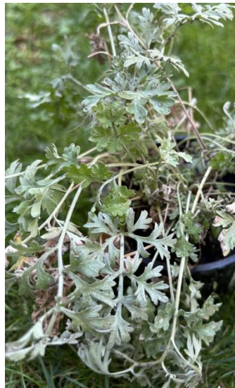
Slika 4. Pelin ( Artemisia absinthium L.)

Pelin je višegodišnja, polugrmasta biljka, visine 60 cm do 1 m. Pripada porodici glavočika ( Asteraceae ). Cijela biljka je svijetlo-sive boje i prekrivena dlačicama. Na stabljici nalaze se sivkasto-dlakavi listovi, trostruko-perastog oblika, prema vrhu stabljike listovi su sve manji i jednostavniji. Cvjetovi su svijetložuti, glavičastog oblika (slika 4.). Listovi i cvjetovi su gorkog okusa, a miris cijele biljke je aromatičan i jak. Uzgoj pelina je vrlo jednostavan. Vrlo je raširena biljka u našim područjima. Raste na pustim i neobrađenim tlima, kamenitim i osunčanim staništima, na stijenama, uz putove, na suhim područjima, posebice na tlima s vapnenom podlogom. Otporna je na sušu i ne zahtjeva velike količine vode. Pelin sadrži niz ljekovitih tvari. Najčešće se uzgaja zbog eteričnog ulja koje je sastavljeno od niza kompliciranih organskih spojeva. Eterično ulje je namijenjeno za inhaliranje. Osim što se uzgaja zbog eteričnog ulja, također se priprema čaj od pelina. Čaj od pelina odlično je sredstvo protiv grčeva u želucu i crijevima, protiv katara želuca (gastritis), kronične začepljenosti, proljeva i drugo (Willfort, 1978.).