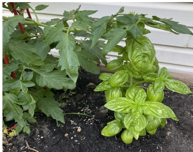
Slika 13. Bosiljak ( Ocimum basilicum L. )

područjima . Bosiljak je jedna od najvažnijih kultura s eteričnim uljima, kao i polifenolima, fenolima, flavonoidima i fenolnim kiselinama. Tradicionalno se koristio kod problema s bubrezima, kao hemostiptik kod poroda, bolova u uhu, menstrualnih nepravilnosti, artritisa, anoreksije, liječenje prehlade i malarije. Bosiljak je pokazao pozitivno djelovanje protiv virusnih, gljivičnih, bakterijskih i drugih infekcija. Najvažnija farmakološka upotreba bosiljka je djelovanje protiv raka, radioprotektivno djelovanje, antimikrobno djelovanje, protuupalno djelovanje, imunomodulatorno djelovanje, antistresno djelovanje, antidijabetičko djelovanje i kod kardiovaskularnih bolesti (Shahrajabian i sur., 2020.). Ljekovita biljka puna antioksidansa, prirodnih spojeva koji štite stanice našeg tijela. „Vaše tijelo proizvodi slobodne radikale kao odgovor na stres i upalu. Slobodni radikali također dolaze iz izloženosti okoliša, poput dima cigareta i ultranasilnog (UV) zračenja“ objašnjava Culbertson. Osim što sprječava rak, također pomaže u kontroli krvnog tlaka, poboljšava razinu šećera u krvi i još mnogo toga.