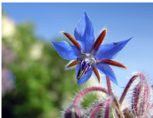
Slika 9. Boražina

Boražina je jednogodišnja biljka. Pripada porodici Boražinovke ( Boraginaceae ). Biljka je poznata po svojim plavim cvjetovima (slika 9.). Kod cvjetova može doći do promjene boje u tamniju ako je tlo siromašnije. Cvjetovi se nalaze na uspravnoj i razgranatoj stabljici prekrivenoj dlačicama, može doseći visinu od 15 - 80 cm. Također, na stabljici se nalaze jajoliki listovi koji su isto tako prekriveni dlačicama. Biljka za sobom ostavlja sjeme. Sjeme se koristi u proizvodnji ulja. Biljka je koja ima širu primjenu. Razmnožava se sjemenom. Sjetva se obavlja u ožujku na rahlom, suhom i dobro dreniranom tlu. Pogoduje joj obilje sunčeve svjetlosti. Iako je biljka kojoj pogoduje sunčeva svjetlost, vrlo je otporna na mraz te može preživjeti na temperaturama od -12 °C. Tradicionalno se boražina uzgajala u kulinarske i medicinske svrhe, iako se danas komercijalno uzgaja uglavnom kao uljarica koja sadrži gama-linolensku kiselinu i druge masne kiseline. Neuropatski liječnici koriste boražinu za regulaciju metabolizma i hormonalnog sustava te je smatraju dobrim lijekom za simptome PMS-a i menopauze. Boražina se ponekad preporučuje za ublažavanje i liječenje prehlade, bronhitisa i respiratornih infekcija općenito zbog svojih protuupalnih i balzamičkih svojstava (Farhadi i sur., 2012.).