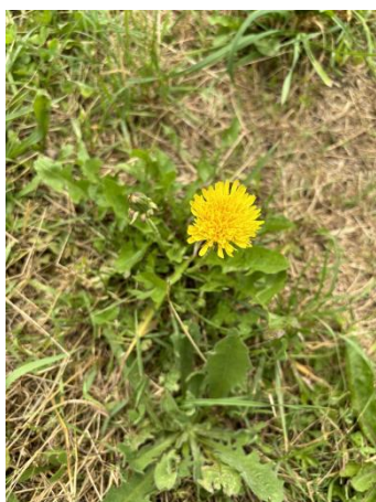
Slika 22. Cvijet maslačka ( Taraxacum officinale F.H.Wigg, flos )

Maslačak je trajna zeljasta biljka. Pripada porodici glavočika ( Asteraceae ). Poznata je po svojim žutim cvjetovima (slika 22.). Cvjetovi se nalaze na cjevastoj stabljici te pri dnu stabljike nalaze se nazubljeni i glatki listovi. Nakon cvatnje pojavljuje se sjeme, oblika kao zračna lopta, s mnogo sjemenki koje vjetar lako raznosi (slika 23). Korijen biljke je vretenast i mesnat. Cijela biljka sadrži mliječni sok koji nije otrovan. Mliječni sok je bijele boje i teksture kao lijepilo, vrlo je gorkog okusa. Maslačak dolazi često u većem mnoštvu na travnim površinama, u djetelištima, vrtovima i drugdje (Willfort, 1978.). Korovna je vrsta te ju je vrlo lako uzgojiti. Raste na otvorenom i osunčanom položaju, odgovaraju mu razni tipovi tla. Razmnožava se generativnim putem, odnosno, sjemenkama koje tvore zračnu lopticu te se šire na druge površine putem vjetra. Ljekovita je biljka, ljekovite tvari nalaze se u biljci kada je u cvatu ili korijenu. Koristi se kod mnogih oblika liječenja, kao kod gihta, reumatizma, skrofuloze, kožnih ekcema, lišaja, oteklina, čireva, krvnih bolesti, debljine, staračkih pojava, pomanjkanja apetita, kod smetnji u radu jetre i žući, kao i kod pojave vode u prsima i trbuhu (Willfort, 1978.).