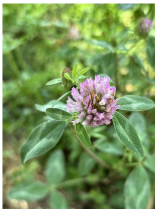
Slika 24. Crvena djetelina ( Trifolium pratense L.)

održavajući hranjive tvari za biljke i tlo na mjestu. Uzgoj crvene djeteline značajno je pridonio plodnosti tla prije uvođenja mineralnih dušičnih gnojiva Crvena djetelina može poboljšati održivost i očuvati cjelovitost okoliša. Nakon uzgoja korijenski sustav također doprinosi organskoj tvari u tlu, pružajući niz usluga ekosustava. Crvena djetelina može kontrolirati korov (McKenna, 2018.).