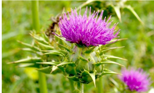
Slika 28. Sikavica ( Sylibum marianum L. )

Jednom kada biljka uvene, nakon sjemena, mesnati korijen se razgrađuje, dodajući organsku tvar, minerale i ostavljajući iza sebe značajan kanal za zrak i vodu da putuju dublje u profil tla.