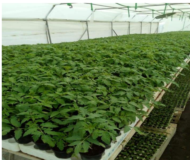
Slika 4. Presadnice rajčice