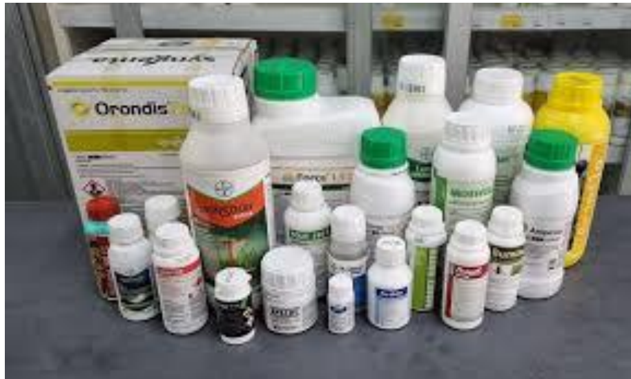
Slika 18. Sredstva za zaštitu bilja

Zaštita rajčice od bolesti i štetnika pesticidima zahtijeva pažljivo planiranje i primjenu kako bi se osigurala učinkovitost, zaštitila biljka te minimalizirala šteta za okoliš i ljude. Rajčica je osjetljiva na brojne bolesti i napade štetnika, a upotreba pesticida često predstavlja ključni dio zaštitnih mjera, posebno kada preventivne metode i biološka kontrola nisu dovoljno učinkovite.