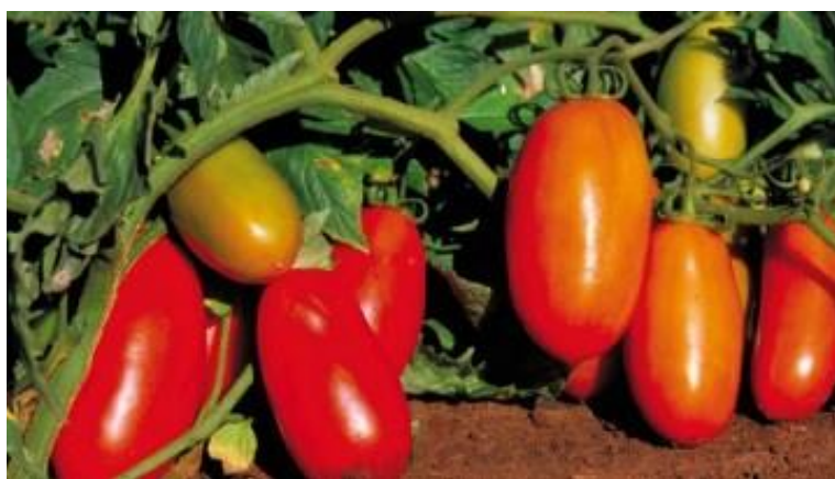
Slika 2. Biljka rajčice s plodovima

Stabljika rajčice je zeljasta, promjera 1-3 cm, prekrivena dlačicama, a pri dnu može postati drvenasta. Zbog nedostatka potpornog tkiva, stabljika je sklona polijeganju. Postoje tri tipa stabljike: indeterminantni, determinantni i semideterminantni. Indeterminantne stabljike su visoke i mogu narasti nekoliko metara, determinantne stabljike su niske ili grmolike i dosežu visinu do 1,5 metara, dok semideterminantne stabljike predstavljaju prijelazni oblik i mogu imati duže stabljike, ovisno o kultivaru. Kod indeterminantnog tipa rajčice, vegetacijski vrh raste sve dok su prisutni povoljni uvjeti temperature i svjetlosti, zbog čega u hidroponskom uzgoju dužina stabljike može doseći i do 12 metara (Lešić i sur., 2002.).