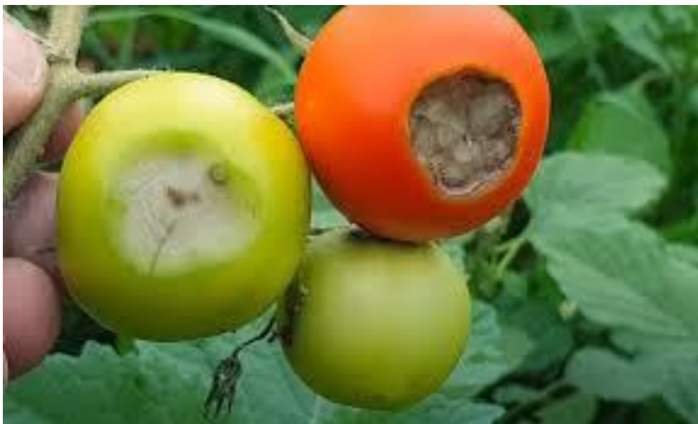
Slika 8. Vršna trulež na rajčici

mjere mogu značajno smanjiti rizik od vršne truleži i poboljšati zdravlje i prinos rajčica (Poljak, 2018.).