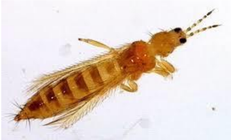
Slika 10. Kalifornijski trips