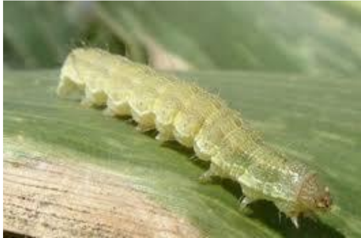
Slika 13. Žuta kukuruzna sovica