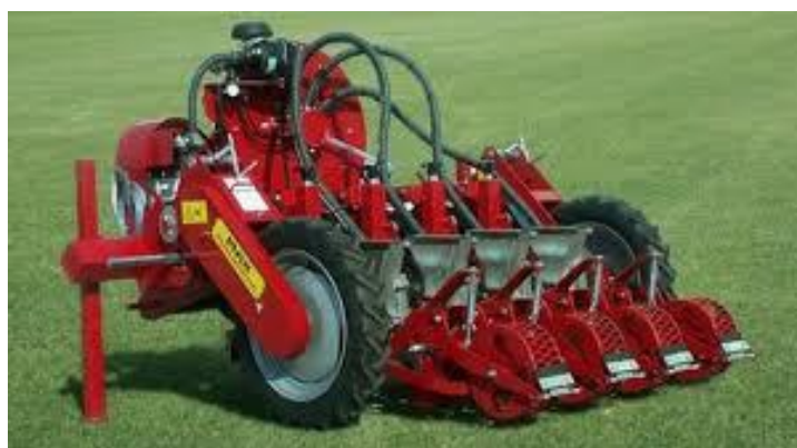
Slika 17. Sijačica za sjeme povrća

sjeme u otvoreno polje, omogućuje bolju organizaciju resursa, smanjuje početne investicije i ubrzava cijeli proces uzgoja. Unatoč rizicima poput neujednačenog klijanja i dužeg vremena do berbe, izravna sjetva rajčice u tlo na ovom OPG-u daje zadovoljavajuće rezultate i omogućuje održivu proizvodnju. Sjetva rajčice na otvorenom zahtijeva pažljivo planiranje i odgovarajuće uvjete kako bi se postigao uspješan rast i razvoj biljaka. Rajčica je kultura koja traži toplu klimu, pa se sjetva obavlja tek nakon što prođe opasnost od kasnih proljetnih mrazova. Optimalno vrijeme za sjetvu na otvorenom obično je krajem travnja ili početkom svibnja, kada se tlo dovoljno zagrije, a temperature zraka stabiliziraju. Sjemenke se postavljaju na razmak od 30-40 cm između biljaka, a između redova treba ostaviti prostor od 70-90 cm kako bi biljke imale dovoljno prostora za rast. Nakon sjetve, tlo se lagano prekrije i zalije, a u slučaju sušnog perioda potrebno je osigurati navodnjavanje kako bi se postiglo ujednačeno klijanje. Jedna od prednosti sjetve rajčice na otvorenom je što biljke odmah razvijaju snažniji korijenov sustav prilagođen okolišu, ali to zahtijeva pažljivo praćenje vremenskih uvjeta i redovito zalijevanje u početnim fazama rasta.