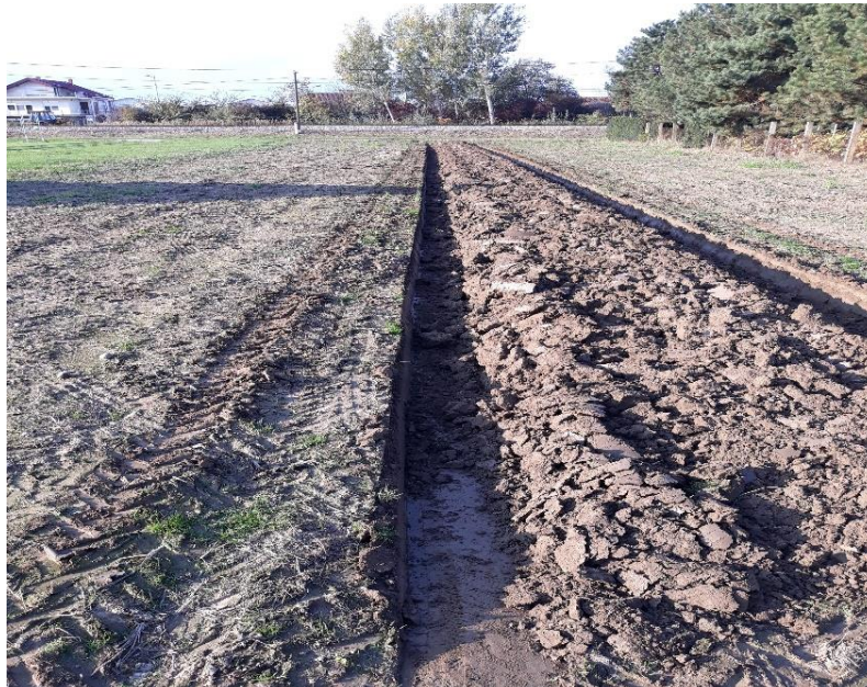
Slika 15. Oranje

Na obiteljskom poljoprivrednom gospodarstvu predusjevi za rajčicu igraju ključnu ulogu u pripremi tla i osiguravanju optimalnih uvjeta za rast i razvoj biljaka. Najčešće se kao predusjev koristi soja, i to iz nekoliko razloga. Soja je izuzetno korisna kao predusjev jer obogaćuje tlo dušikom zahvaljujući svojoj sposobnosti fiksacije dušika iz zraka putem simbiotskih bakterija u svojim korijenima. Ovaj proces obogaćivanja tla dušikom značajno doprinosi kvaliteti tla i njegovoj sposobnosti da podrži rast rajčica. Osim toga, soja doprinosi povećanju sadržaja hranjivih tvari u tlu, što rajčici omogućuje bolji start i potencijalno veće prinose. Kukuruz se također koristi kao predusjev, iako u manjem postotku. Kukuruz je koristan jer nakon žetve ostavlja organske ostatke koji poboljšavaju strukturu tla i njegovu sposobnost zadržavanja vlage. Međutim, kukuruz ne obogaćuje tlo dušikom kao soja, pa je njegova korist nešto manja u tom smislu. Obrada tla započinje jesenskim oranjem na dubini od 25cm. Oranje je proces obrade tla koji se obavlja pomoću traktorskog pluga. Cilj je razbijanje gornjih slojeva tla, prozračivanje i priprema tla za daljnju obradu. Oranje pomaže u uklanjanju korova, miješanju organskih materijala i poboljšanju strukture tla.