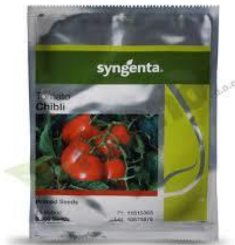
Slika 14. Chibli F1

Na OPG-u Šiketanc Ivan najviše se koristi rajčica sorte „CHIBLI F1“ sjemenarske kuće Syngenta®. Rajčica Chibli F1 je hibridna sorta koja se ističe svojim izvanrednim karakteristikama i pogodnostima za različite uvjete uzgoja, uključujući uzgoj u zaštićenim prostorima i uzgoj na otvorenom. Ova sorta je prepoznatljiva po svojoj sposobnosti da se prilagodi različitim uvjetima, pružajući izniman prinos i kvalitetu plodova. Chibli F1 je indeterminantni hibrid, što znači da biljka nastavlja rasti i rađati plodove tijekom cijelog vegetacijskog razdoblja. Plodovi su srednje veliki, obično okrugli, i imaju tamnocrvenu boju kada su potpuno zreli. Osim što su vizualno privlačni, plodovi ove sorte posjeduju dobar okus i čvrstu strukturu, što ih čini pogodnima za konzumaciju u svježem stanju te za preradu. Hibrid je također poznat po svojoj ujednačenoj zrelosti plodova, što omogućuje optimizaciju berbe i smanjuje potrebu za čestim pregledavanjem biljaka. Jedna od značajnih prednosti Chibli F1 je njena otpornost na uobičajene bolesti rajčice, uključujući plamenjaču, bijelu trulež i različite bakterijske infekcije. Ova otpornost doprinosi zdravlju biljaka i može značajno smanjiti potrebu za primjenom kemijskih tretmana, čime se smanjuju troškovi i utjecaj na okoliš.