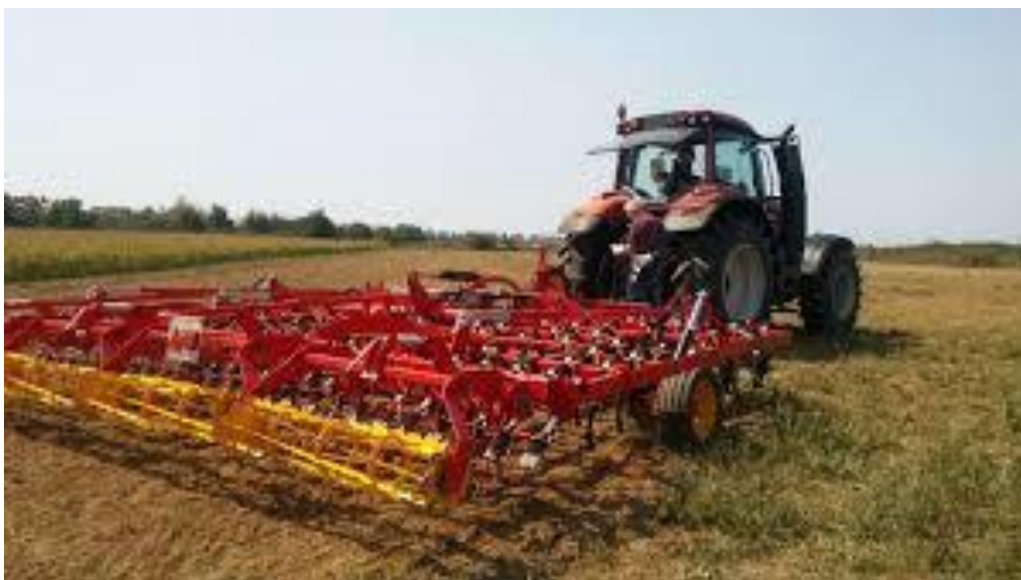
Slika 16. Sjetvospremač

Glavni cilj ove dopunske obrade je stvoriti ujednačen i fino usitnjen sloj tla, što je ključno za kvalitetan razvoj korijenskog sustava rajčice. Time osiguravamo da biljka ima lakši pristup dovoljnoj količini hranjivih tvari i vode, kao i da je tlo dovoljno rahlo kako bi se izbjegle prepreke u rastu. Pravilna priprema tla neposredno prije sjetve jedan je od ključnih faktora za uspješan uzgoj rajčice i postizanje visokih prinosa.