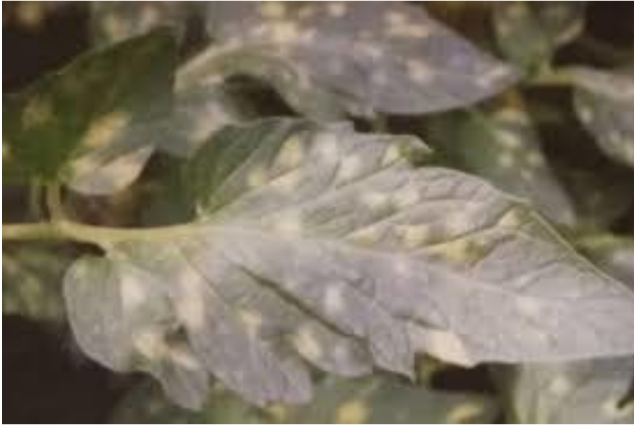
Slika 9. Baršunasta plijesan na rajčici