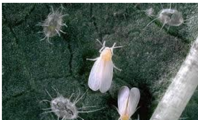
Slika 11. Cvjetni štitasti moljac