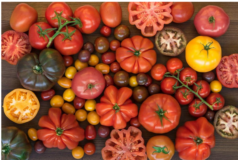
Slika 1. Različite sorte rajčice

Rajčica ( Solanum lycopersicum ) pripada obitelji Solanaceae . Porijeklom je iz Južne Amerike i jedna je od najčešće konzumiranih povrtnih kultura na svijetu (Zhang i sur., 2023.) Rajčica je član obitelji pomoćnica ( Solanaceae ) koja uključuje više od 3000 vrsta. Ova obitelj uključuje i druge popularne vrste, poput krumpira, duhana, paprike i patlidžana. Rajčica je jedina udomaćena vrsta iz odjeljka Lycopersicon roda Solanum koji se sastoji od 13 vrsta ili podvrsta. Prvo je udomaćena u Meksiku, a plod su u Europu donijeli španjolski istraživači sredinom 1500-ih. Dugi niz godina rajčice su se smatrale otrovnima i nesigurnima za jelo jer pripadaju obitelji pomoćnica. Rajčice su uvedene u Sjedinjene Američke Države 1710. godine, ali su postale popularne kao prehrambeni artikl tek kasnije u tom stoljeću. Danas je rajčica drugo najkonzumiranije i najraširenije povrće bez škroba u svijetu nakon krumpira. Prosječna svjetska proizvodnja rajčice procjenjuje se na oko 159 milijuna tona. Posljednjih nekoliko godina konzumacija rajčica znatno je porasla jer su postale važan dio ljudske prehrane. Stoga se i područje uzgoja rajčice u posljednjih nekoliko godina globalno proširilo. Vodeći proizvođači rajčice su Kina, Indija, SAD, Turska i Egipat. Prema procjeni USDA-e, 35 % sirovih rajčica prerađuje se u umake, 18 % u pastu od rajčice, 17 % u konzervirane rajčice, 15 % u sokove i 15 % u kečap (Padmanabhan i sur., 2016.)