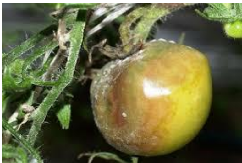
Slika 7. Bijela trulež na rajčici

skladištenja na njima se mogu razviti micelij i sklerociji. Takvi plodovi postaju sivi, razmekšaju se i potpuno propadaju. Optimalne temperature za zarazu bijelom truleži su između 15 i 21°C uz visoku vlagu zraka. Za učinkovitu kontrolu ove bolesti važno je održavati odgovarajuće uvjete u tlu i okolišu te primijeniti preventivne mjere kako bi se smanjila vlažnost i spriječilo širenje patogena (Ćosić i sur., 2002.).