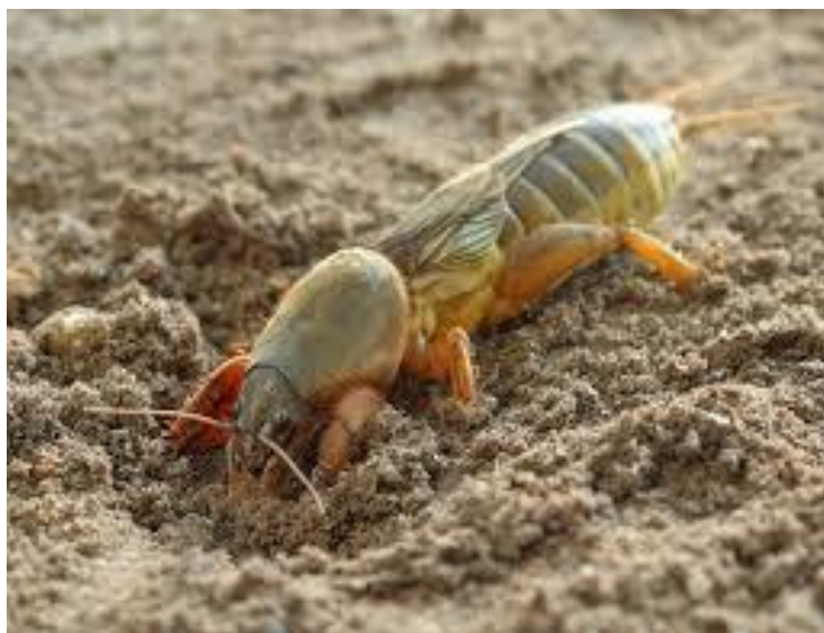
Slika 12. Rovac