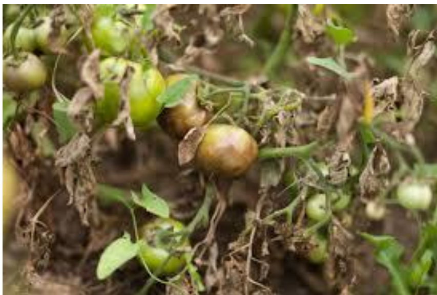
Slika 6. Plamenjača na rajčici

i na bilo kojem dijelu lista. Na naličju lista, pri dovoljnoj vlažnosti, formira se prljavo-bijela prevlaka. Na stabljici se pojavljuju veće smeđe do crne pjege koje se mogu proširiti u prstenasto oblikovanje, uzrokujući postepeno ugibanje biljke iznad mjesta infekcije. Na plodovima se razvijaju pjege koje s vremenom poprime brončanu boju. Ova bolest može značajno smanjiti kvalitetu i urod rajčice, stoga je važno poduzeti odgovarajuće mjere kontrole i prevencije kako bi se spriječilo širenje plamenjače (Cvjetković, 2016.).