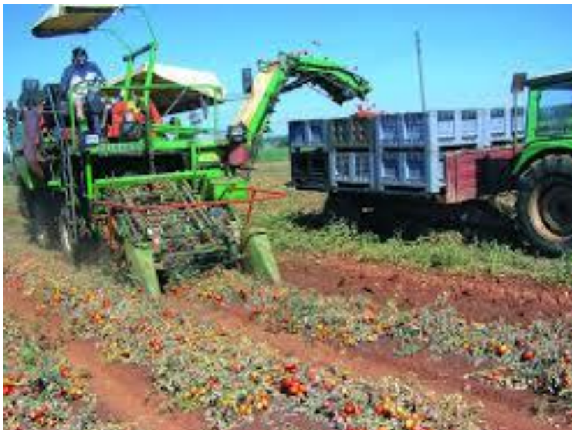
Slika 5. Mehanizirana berba rajčice