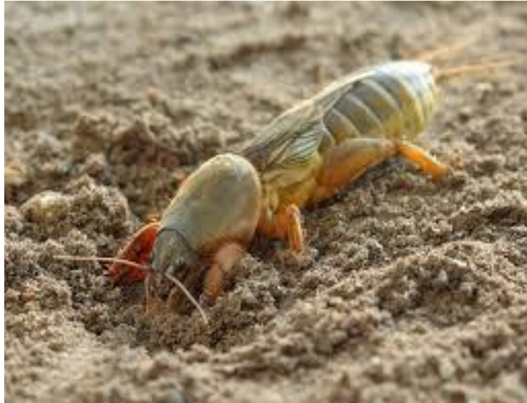
Slika 12. Rovac