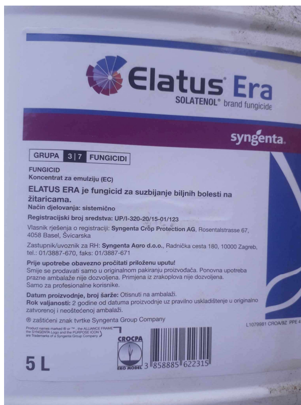
Slika 10 Elatus era