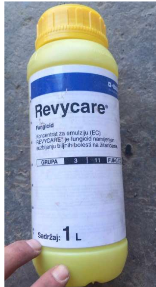
Slika 11 Fungicid Revycare

Druga prihrana obavljena je 30. ožujka 2023. također KAN-om u dozi od 80 kg/ha, dok je druga folijarna prihrana obavljena 12. travnja 2023. gnojivom Mortonijc u količini od 5 kg/ha. Mortonijc folijarno je gnojivo koje sadrži tri osnovna elementa ishrane N, P i K u omjeru 19:9:27 te razne mikroelemente potrebne za normalan rast i razvoj biljke (slika 10). Jako je širok spektar djelovanja ovog gnojiva, a vrijeme primjene ovisi o kulturi koju uzgajamo. Iznimno dobro djeluje na razvoj habitusa i korijenovog sustava te povećava kvalitetu i prinos oko 10 %.