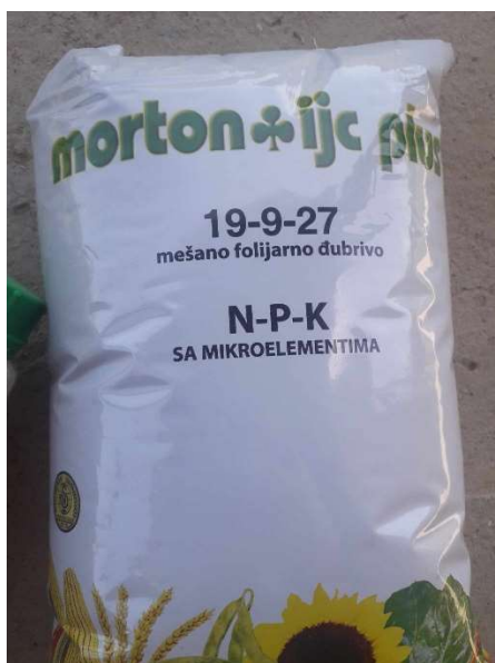
Slika 9 Mortonijc