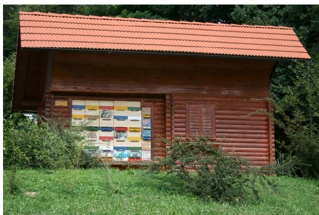
Slika 7: Stacionirani paviljonski pčelinjak

Stacionarni paviljonski pčelinjaci (Slika 7). Košnice iz ovih paviljona se u pravilu ne sele. U zadnjem dijelu paviljona najčešće je prostorija iz koje se vrši pregled košnica. Ova prostorija se koristi i za vrcanje meda, kao manje skladište i za slične potrebe. U nekim krajevima, a naročito u Sloveniji, postoji običaj da se prednja strana paviljona oslikava pčelarskim motivima. Tako pčelarski paviljoni postaju i male umjetničke galerije. U današnje vrijeme pčelinjaci ovog tipa koriste se i u zdravstvene svrhe primjenjujući apiterapiju i dajući pčelinjaku jedno potpuno novo značenje.