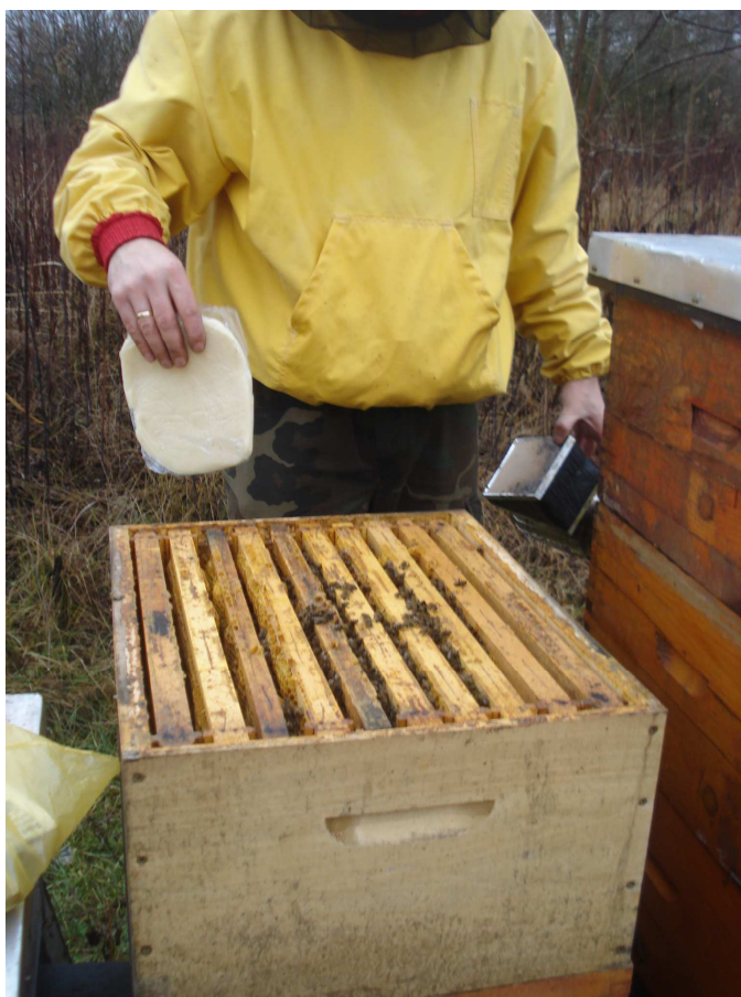
Slika 14 : Slaba zajednica

Pčelari znaju reći, zajednice imaju više bolesti, dok pčelarstvo samo jednu – slabe zajednice. U današnjim uvjetima življenja i pčelarenja važno je maksimalno iskoristiti sakupljački potencijal svake pčelinje zajednice i time osigurati rentabilno pčelarenje (Slika 14). Optimalan broj pčela u zajednici je između 40 i 55 tisuća pčela. Nije prihvatljiv pristup pčelarenju da će u dobrim godinama biti meda i da će pokriti sve gubitke u lošim godinama, potrebno je u svakoj godini u potpunosti iskoristiti pašu ovisno o uvjetima.