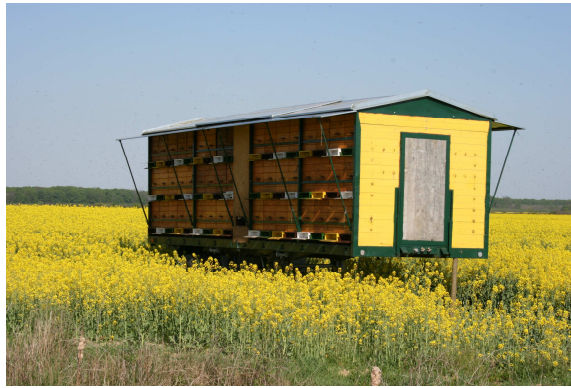
Slika 3: Seleći pčelinjak