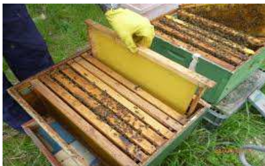
Slika 11 : Proširivanje plodišnog prostora

ulica u plodištu koji popunjavaju pčele s krajnjih ulica gdje nema legla (Slika 11). Pošto je period naglog buđenja prirode i pčela, matica će vrlo brzo zaleći dodani prazni okvir. Kod slabijih društava novi okvir dodajemo između krajnjeg okvira s leglom i okvira s cvjetnim prahom na strani kako se ne bi razbila cjelina gnijezda što može imati suprotan učinak od željenog.