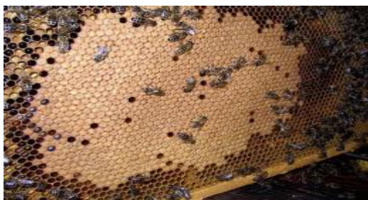
Slika 12 : Okvir s leglom

U ovo vrijeme počinje voćna paša, koja intenzivira razvoj zajednica. Ako je vrijeme dobro pčele će unijeti obilje nektara u košnice i početak će lučenje voska, tj. gradnja saća. Nektar koji pčele unose u košnicu može blokirati maticu u nesenju, zato je važno pravovremeno proširivanje zajednica i zapošljavanje mladih pčela u gradnji saća. Izgradnja saća je najbolji pokazatelj da je dnevni unos veći od dnevne potrošnje. Dakle u vrijeme cvatnje šljive, jabuke, itd. proširujemo plodišni prostor. Jačim zajednicama koje imaju najmanje pet okvira legla i deset ulica pčela dodajemo istovremeno po dva i više okvira satne osnove. Ove okvire stavljamo u sredinu, lijevo i desno od centralnog okvira s leglom. Slabijim zajednicama dodajemo po jednu satnu osnovu do legla (Slika 12). Novo dodane satne osnove pčele će u voćnoj paši brzo i kvalitetno izgraditi i matica će ih rado zaleći.