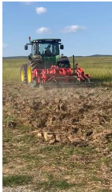
Slika 5. Podrivanje

Nakon oranja na dubini od 30 cm plugom Lemken, napravljena je dopunska obrada tla tanjuračem. Nakon kratke tanjurače, napravljen je prohod podrivačem kao što prikazuje Slika 5. i nakon podrivanja, ponovno tanjuranje kratkom tanjuračem (Slika 6.).