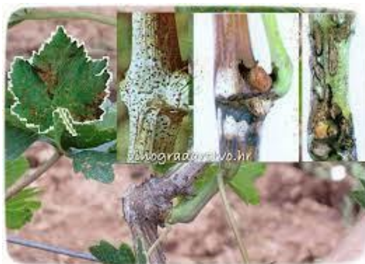
Slika 5. Crna pjegavost vinove loze

Gljiva prezimi u trulim grozdovima na trsu ili u mumificiranim bobama na površini tla. Simptomi bolesti očituju se na listovima, mladicama i rozgvi, a zaraza na bobicama je rijetka. Crnu pjegavost prepoznajemo po oštećenju na kori, a tijekom zimske rezidbe simptome na zaraženim čokotima prepoznajemo po pukotinama u obliku „žabljeg oka“, a kora može imati bijelu ili srebrnkastu boju s crnim točkicama. Kada zaražena loza propupa donji se pupovi ne otvaraju, na mladicama se tijekom vegetacije primjećuju nekroze te raspucavanje kore. Na najnižim listovima se javljaju nekroze. Crne točkice su plodna tijela gljive – piknidi. Piknidi mogu biti aktivni 3 - 4 godine, te oslobađati piknospore na rozgvi koja je ostala na tlu (Ciglar 1998.).