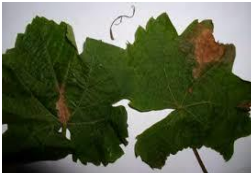
Slika 9. Simptomi bolesti na listovima