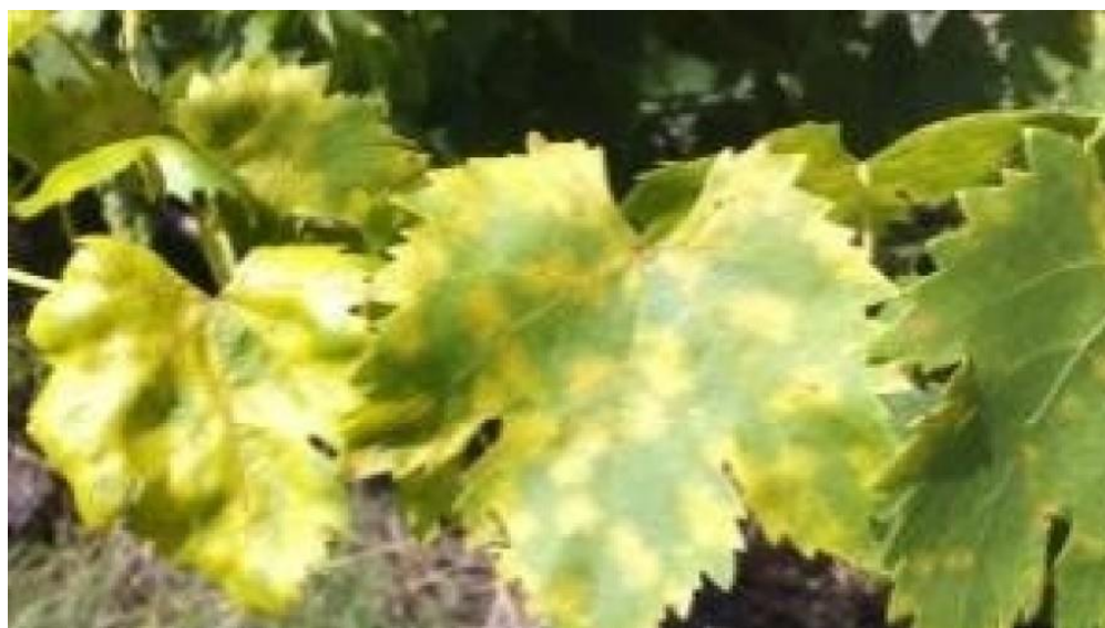
Slika 3. Prikazuje napad plamenjače na listu vinove loze