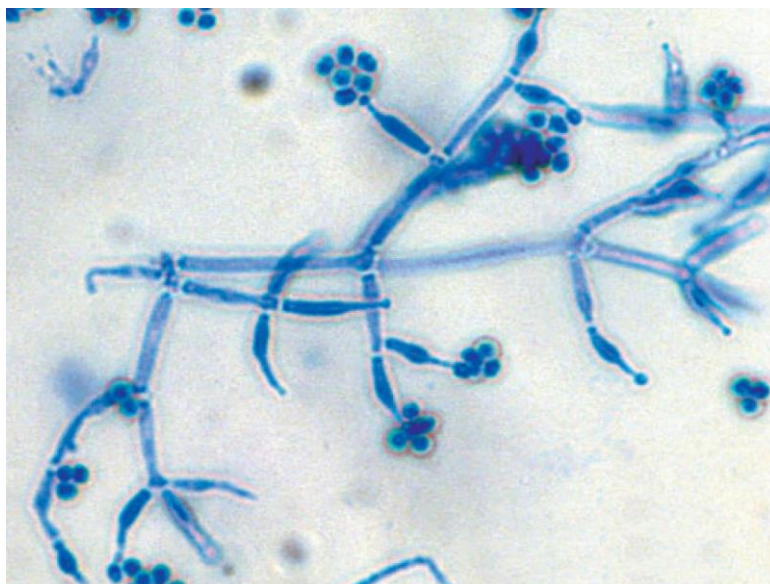
Slika 10. Trichoderma spp.