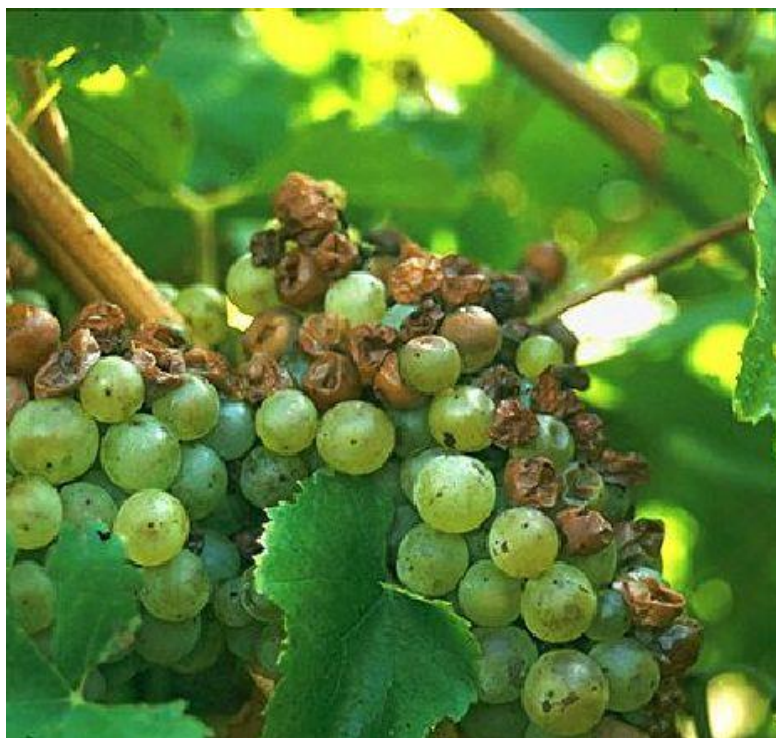
Slika 2. Prikazuje napad plamenjače na grozdu