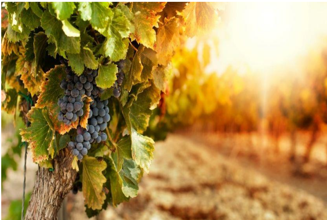
Slika 1. Prikaz vinove loze