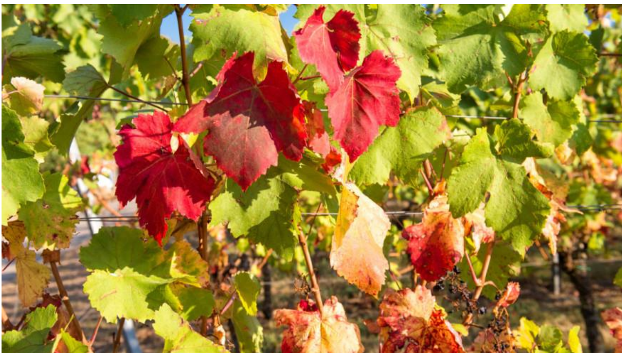
Slika 6. Crvenilost lišća vinove loze

karakteristične pjege omeđene rubom plojke. Pjege dobivaju trokutasti oblik, na početku su svjetložute boje, kasnije postaju crvenkatosmeđe. Tkivo u pjegama kasnije odumire, dolazi do ranog otpadanja listova na izbojima. Jak gubitak listova dovodi do zastoja u rastu cijelog čokota. Gljiva prezimljuje u otpalom zaraženom lišću. ( https://www.agroportal.hr/ )