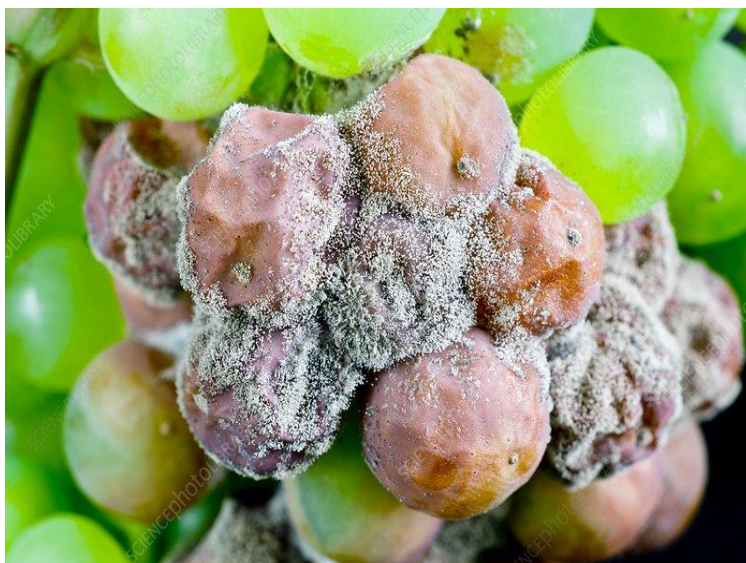
Slika 8. Simptomi bolesti na grozdu