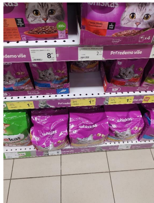
Slika 2. Whiskas