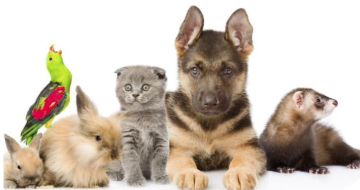
Slika 1. Kućni ljubimci – Web

Predviđa se da će prodaja hrane za kućne ljubimce u Hrvatskoj ostati stabilna tijekom sljedećih pet godina, dosežući cifru od 2 milijuna eura do 2028., što je na istoj razini kao i 2023. godine. Ovo je u skladu s dosljednom godišnjom stopom rasta od 5,9% od 2016. godine. U 2023. godini, Hrvatska je zauzela 25. poziciju na globalnoj ljestvici, s Estonijom tik ispred nje s 2 milijuna eura. Francuska, Velika Britanija i Španjolska drže drugo, treće i četvrto mjesto, redom. Što se tiče izvoza, očekuje se da će se hrvatski izvoz hrane za kućne ljubimce povećati na približno 3.113.000 kilograma do 2028., u usporedbi s otprilike 2.539.000 kilograma u 2023. To predstavlja godišnju stopu rasta od 3,2%. Od 1997. godine, hrvatski izvoz bilježi kontinuirani rast od 6,4% godišnje. U 2023. godini, Hrvatska je zauzela 45. poziciju u ovoj kategoriji, s Slovenijom kao vodećim izvoznikom s 2.539.000 kilograma. Francuska, Sjedinjene Države i Poljska su bile prva tri izvoznika. Što se tiče uvoza, prognozira se da će hrvatski uvoz hrane za kućne ljubimce porasti na približno 77.645.000 kilograma do 2028. godine, u usporedbi s gotovo 68.498.000 kilograma u 2023. To pokazuje godišnju stopu rasta od 2%. Od 1997. godine, hrvatska potražnja za uvozom hrane za kućne ljubimce rasla je prosječnom stopom od 3,1% godišnje ( https://www.reportlinker.com ).