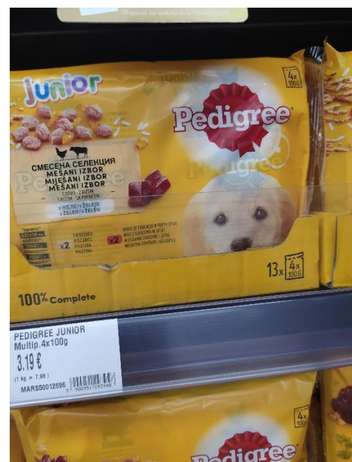
Slika 3. Pedigree