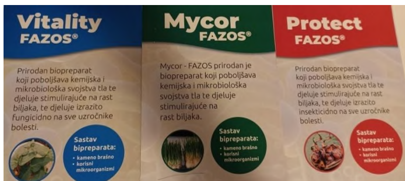
Slika 9. Biopreparati

Istraživanja su potvrdila da prilikom primjene mikrobiološkog preparata prosječni dobiveni prinos zrna pšenice uz tretman sjemena mikroorganizmima i zaštitu od bolesti je viši u odnosu na netretirano sjeme uz primjenu kemijskog fungicida. Također, vidljive promjene u postotcima su prisutne u hektolitarskoj masi zrna, masi 1000 zrna pšenice, sadržaju bjelančevina u zrnu pšenice, visini biljke. Kao konačni rezultat dobivena je zdrava biljka, tlo bez rezidua pesticida koje predstavljaju veliki zdravstveni i okolišni problem. (Kristek i sur., 2023.)