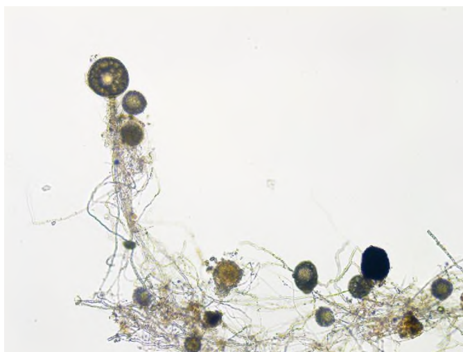
Slika 4. Glomus iranicum var. Tenuihypharum

Treća i posljednja prednost je da “Symborgova ekskluzivna gljiva” ima visoku otpornost na slane uvjete jer se može razviti čak i u uvjetima kada pH iznosi 4-9, što govori da osigurava toleranciju na salinitet s obzirom na stalnu upotrebu gnojiva. (Symborg, 2023.)