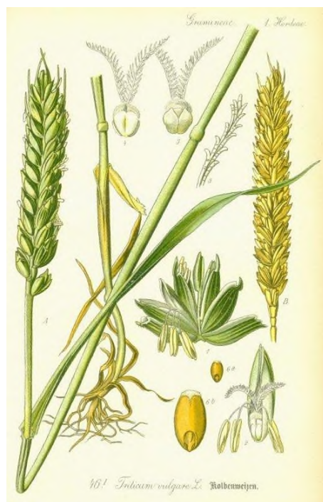
Slika 1. Morfologija pšenice

Praćenje modernih poljoprivrednih tehnologija i praksi, uključujući inovacije u uzgoju pšenice, može pridonijeti dugoročnom održivom razvoju poljoprivrede u Hrvatskoj. U modernom poljoprivrednom sustavu, često se koriste hibridne i poboljšane sorte pšenice koje su prilagođene klimatskim ekstremima, a poželjno je da budu visokorodne sa stabilnim visokim prinosima, otporni na bolesti i drugim poželjnim agronomskim karakteristikama. Odabir vrste pšenice može ovisiti o ekonomskim čimbenicima, potražnji tržišta, agroekološkim uvjetima i preferencijama poljoprivrednika. Prema podacima državnog zavoda za statistiku prosječni prinos u 2023. godini na zasijanoj površini od 170 000 ha je iznosio 4,8 t/ha. (DZS, 2023.)