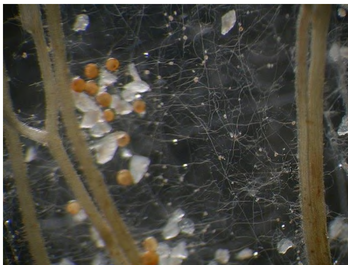
Slika 5. Gigaspora Margarita

Gigaspore su velike spore koje se često formiraju u sklopu životnog ciklusa određenih endomikoriznih gljiva, posebno onih iz reda Glomerales . Gigaspore su važan reproduktivni dio ovih gljiva i često imaju ulogu u stvaranju novih kolonija gljivica. U nekim vrstama, gigaspore se formiraju unutar karakterističnih struktura koje se nazivaju vezikule.