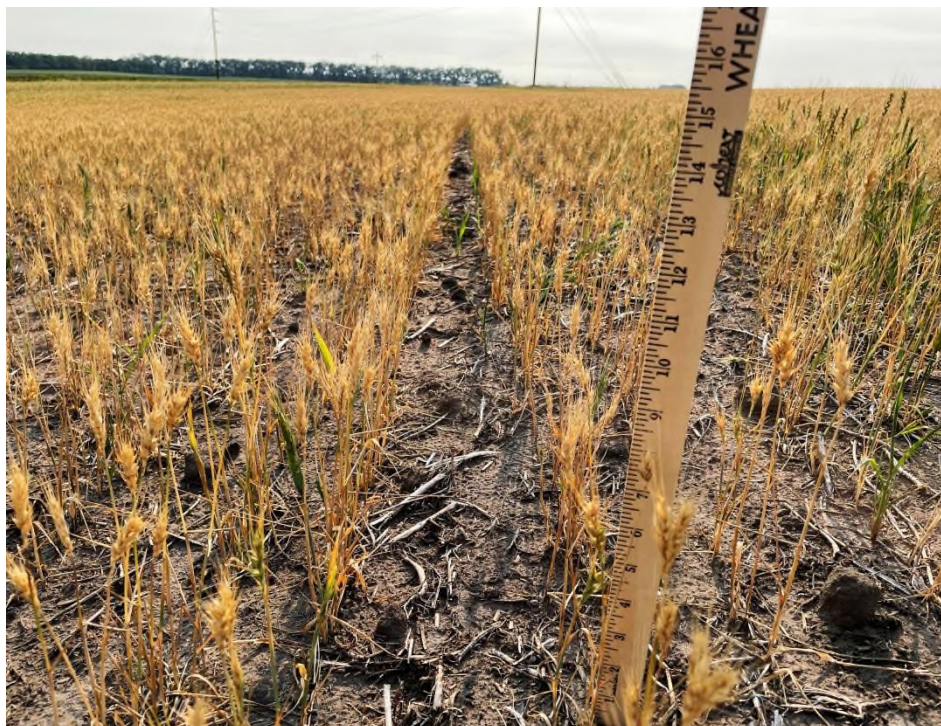
Slika 2. Pšenica uslijed dugotrajnog sušnog perioda

Prijetnja promjenjive globalne klime uvelike je privukla pozornost znanstvenika jer te varijacije imaju negativan učinak na globalnu proizvodnju usjeva i ugrožavaju sigurnost hrane diljem svijeta. Prema nekim predviđanjima poljoprivreda se smatra najugroženijom djelatnošću na koju utječu klimatske promjene. ( Agriculture and rural development, 2019.)