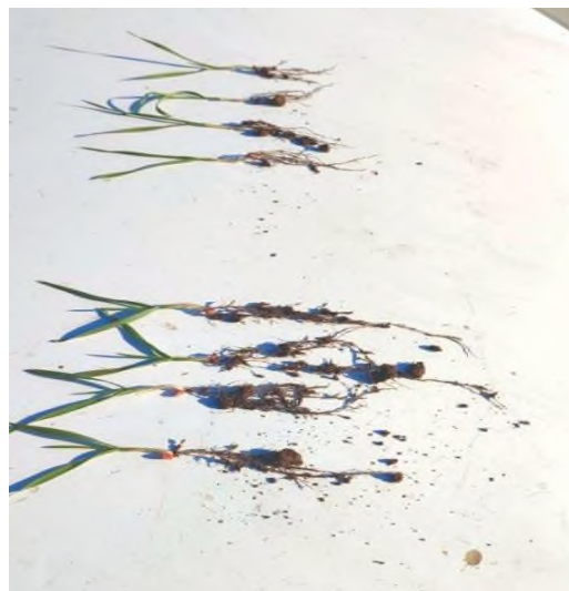
Slika 7. Iznimke biljke pšenice

Prema Kristek i sur. tretiranjem sjemena pšenice endomikoriznim gljivama dobili su povećanje visine biljaka za 1,7 - 4, 3%, koje naravno ovisi o sorti pšenice.(Kristek i sur., 2023.)