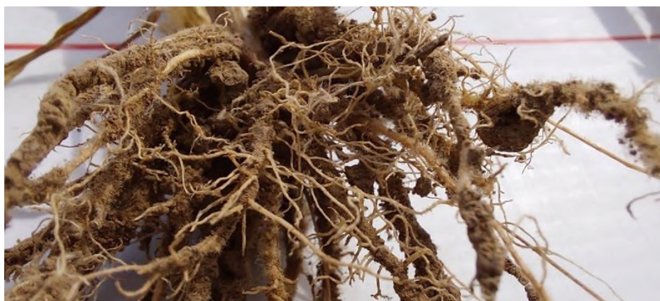
Slika 6. Razgranati korijen pšenice djelovanjem mikorize

Biljka je u značajno boljoj kondiciji u samo proljeće, boja joj je tamno zelena u odnosu na ostalu pšenicu i bujnija je. S obzirom da nije patila tijekom zime lako nastavlja dalje s razvojem. Obično se kod korištenja mikoriznih gljiva smanjuje prihrana pšenice, na 100 kg kod prve prihrane, odnosno 100 kg kod druge prihrane. Tijekom vegetacije pšenica pod utjecajem mikoriznih gljiva je izrazito bujna, brzo prolazi fenofaze razvoja (vlatanje, busanje), međutim ne završava značajno ranije vegetaciju što za posljedicu ima dobro nalivena zrna pšenice, više klasova i sam prinos je značajno veći, i do 20%. Ako se to komparira s redukcijom gnojidbe vidimo da se i ekonomski značajno isplati. (Kristek i sur., 2023.)