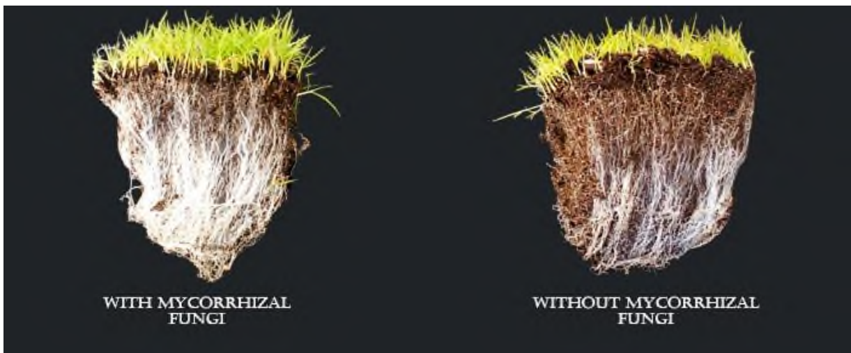
Slika 8. Primjer djelovanja mikorize na korijenov sustav

Problem za razvijanje ovih vrijednih gljivica predstavlja erozija, obrada tla i slične aktivnosti. Ukoliko jednom dođe do narušavanja vrlo sporo se oporavljaju, zbog toga bi bilo idealno suzdržati se od obrade tla jer može biti kontraproduktivno. Uz proces mikorizacije poželjno je primjeniti kvalitetno organsko gnojivo. Korijen se od grubog dijela dijeli na finije i tanje korijenje, zatim se nastavljaju nastavci gljive koje golim okom ne možemo vidjeti. Pomoću produžetaka mikoriznih gljiva površina korijena se uvišestručuje, baš kao i volume tla iz kojeg biljka upija hranjive tvari. Upravo kada se spore gljiva pronađu u blizini korijena dobiju kemijski signal za aktivaciju tj. prodiru među stanice korijena. Ondje stvaraju tvorbe preko kojih je moguća izmjena tvari s biljkom nakon čega slijedi puštanje gljivinih nastavaka iz korijena prema tlu. (Đurić i sur. 2020.)