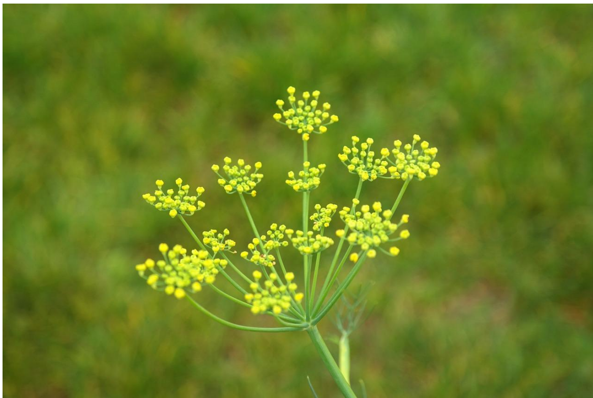
Slika 4. Komorač u cvatnji

Obični komorač ( Foeniculum vulgare Mill.), naziva se i koromač, rezen, morač, slatki kopar, slatki anis, divlja mirodija, zeljasta je dvogodišnja ili višegodišnja biljka iz porodice Apiaceae. Komorač je aromatična i ljekovita biljka slatkastog mirisa koja se može koristiti u kulinarstvu, prehrambenoj, kozmetičkoj i farmaceutskoj industriji (Grlić, 2005., Žutić, 2014.).