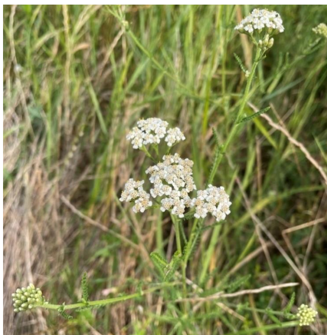
Slika 1. Stabljika i cvat običnog stolisnika (područje Osječko-baranjske županije, Dalj) (Bulić, A., proljeće 2024.)

Obični stolisnik je otporna trajna zeljasta biljka s plitkim sustavom podanka koja pripada porodici cjevastocjetnih glavočika (Asteraceae), te rodu Achillea koji obuhvaća približno od 110 do 140 vrsta (Ehrendorfer i Guo, 2006.). Naziv Achillea odnosi se na Ahileja, junaka trojanskog rata, koji je koristio stolisnik za liječenje rana vojnika u književnom djelu Ilijada (Saeidnia i sur., 2011.). Stabljika stolisnika je uspravna, većinom jednostavna, prekrivena vunenasnim dlakama (slika 1), a naraste do 60 centimetara visine. Naziv millefolium što znači 'tisuću listova' stolisnik je dobio prema tamnozelenim, aromatičnim i višestruko perasto razdijeljenim listovima (slika 2), prepoznatljiva filigranska izgleda. Cvjetovi običnog stolisnika (slika 3) su sitni, bijele ili blagoružičaste boje, a skupljeni su u plosnate okrugle cvatove (glavice) promjera do 6 mm koji se pojavljuju tijekom ljeta i jeseni. Plod je roška bez papusa (Ljubešić, 2010., Hulina, 2011., Raudone i sur., 2024.).