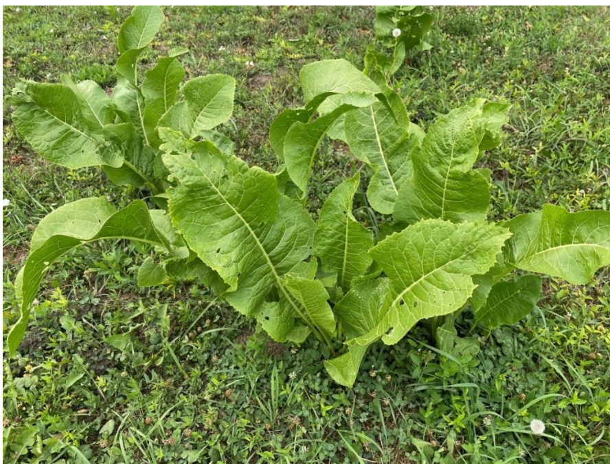
Slika 5. Listovi hrena (područje Osječko-baranjske županije, Dalj)

Hren ( Armoracia rusticana P. Gaertn., B. Mey. et Scherb.) je trajna biljka iz porodice krstašica (Brassicaceae) poznata od davnina kao vrijedna biljna vrsta u prehrani i narodna ljekovita biljka (Agneta i sur., 2013.). Hren je aromatična ljuta biljka koja se stoljećima koristi za poboljšanje okusa hrane, pomoć u probavi i poboljšanje ljudskog zdravlja. Zanemarena je i nedovoljno iskorištena biljna vrsta, posebno u pogledu potencijalnih dobrobiti za poboljšanje ljudskog zdravlja (Walters, 2021.).