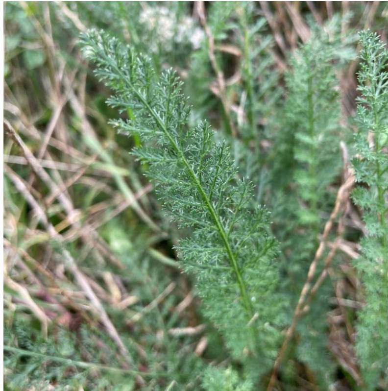
Slika 2. List običnog stolisnika (područje Osječko-baranjske županije, Dalj)

Stolisnik je kozmopolitska biljka, rasprostranjena po cijeloj Europi, Sjevernoj Americi i Aziji, a može se pronaći i u Australiji, kao i na Novom Zelandu. Raste u skupinama na pašnjacima i livadama, na sunčanim obroncima, a isto tako i kao korov u vrtovima, vinogradima i voćnjacima, te na ruderalnim staništima (Knežević, 2006., Applequist i Moerman, 2011., Hulina, 2011.).