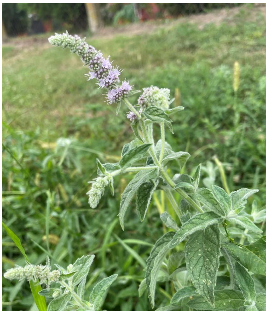
Slika 7. Dugolisna metvica (područje Osječko-baranjske županije, Dalj)

Dugolisna metvica ( Mentha longifolia (L.) L.) trajna je vrsta iz porodice usnatice (Lamiaceae) koja obuhvaća više od 7200 vrsta i oko 260 rodova drveća i grmlja. Rod Mentha obuhvaća više od 30 vrsta (Anwar i sur., 2019.). Točan broj vrsta još uvijek nije definiran s obzirom da većinu vrsta karakterizira veliki polimorfizam, koji se ogleda u obliku lista, indumentumu, vrsti cvjetova i cvjetova itd. Osim morfološke varijacije, većina vrsta Mentha također pokazuje značajnu kemijsku raznolikost u sastavu eteričnog ulja, ovisno o lokaciji rasta (Nikšić i sur., 2012.). Riječ mentha potječe od grčke riječi mintha , imena mitske nimfe koja se preobrazila u ovu biljku (Mahendran i Rahman, 2020.).