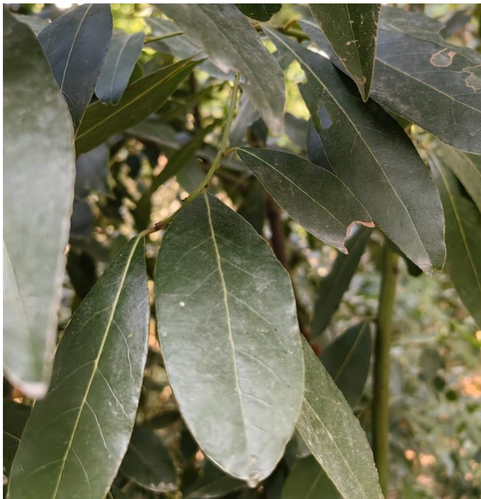
Slika 10. Lovorov list (područje Istarske županije, Pula) (Bulić, A., ljeto 2023.)

Među samoniklim začinskim biljem, lovor ( Laurus nobilis L.) je vjerojatno najpoznatija biljka. Lovor je zimzeleni grm ili drvo iz porodice Lauraceae i roda Laurus (Patrakar i sur., 2012.). Lovor je simbol slave, časti i trijumfa pa su te su lovorov vijenac dobivali pobjednici na Olimpijskim igrama kod starih Grka i ratu kod starih Rimljana (Hulina, 2011.).