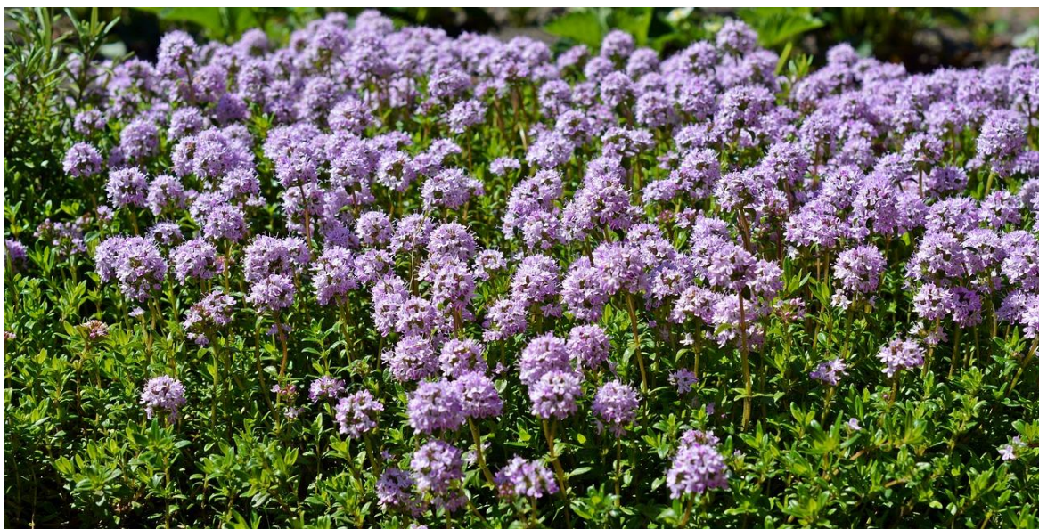
Slika 9. Majčina dušica

Majčina dušica ( Thymus serpyllum L.) začinska je i ljekovita vrsta iz porodice Lamiaceae i roda Thymus koji obuhvaća oko 350 vrsta (Wesołowska i sur., 2015.). Naziv roda dolazi od starogrčke riječi thymos koja znači „dim“. Ta je začinska biljka paljena u grčkim hramovima i njezin dim očaravajućeg mirisa predstavljao je znak odanosti božici Afroditi (Popa, 2021.). Majčina dušica u antička vremena bila je simbol plemenitosti, hrabrosti i bogatstva (Etyemez i İflazoğlu, 2022.).