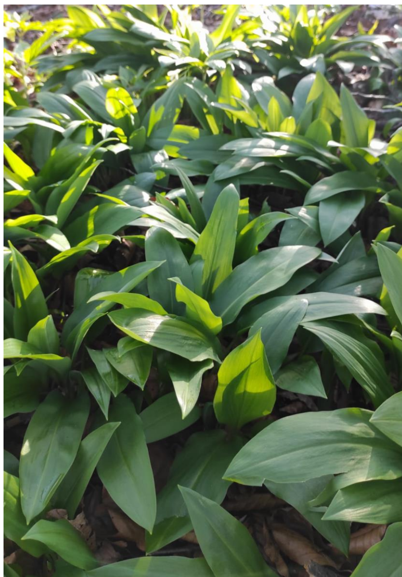
Slika 6. Medvjedi luk (područje Ličko-senjske županije (Korenica)

Medvjedi luk ( Allium ursinum L.) je samonikla višegodišnja zeljasta biljka iz porodice sunovratki (Amaryllidaceae) i roda Allium koja raste u vlažnim listopadnim šumama, često prekrivajući velike površine u bukovim šumama. Biljka je ime dobila prema narodnoj priči koja kaže da medvjedi, nakon što se probude iz zimskog sna, jedu ovu biljku kako bi očistili svoje tijelo od toksina i povratili energiju. Osim naziva medvjedi luk, postoje i drugi narodni nazivi za ovu biljku, poput: srijemuš, crijemuš, čremuž, šumski luk, pasji luk i divlji luk (Grlić, 2005., Sobolewska i sur., 2015., Ban i sur., 2023.).