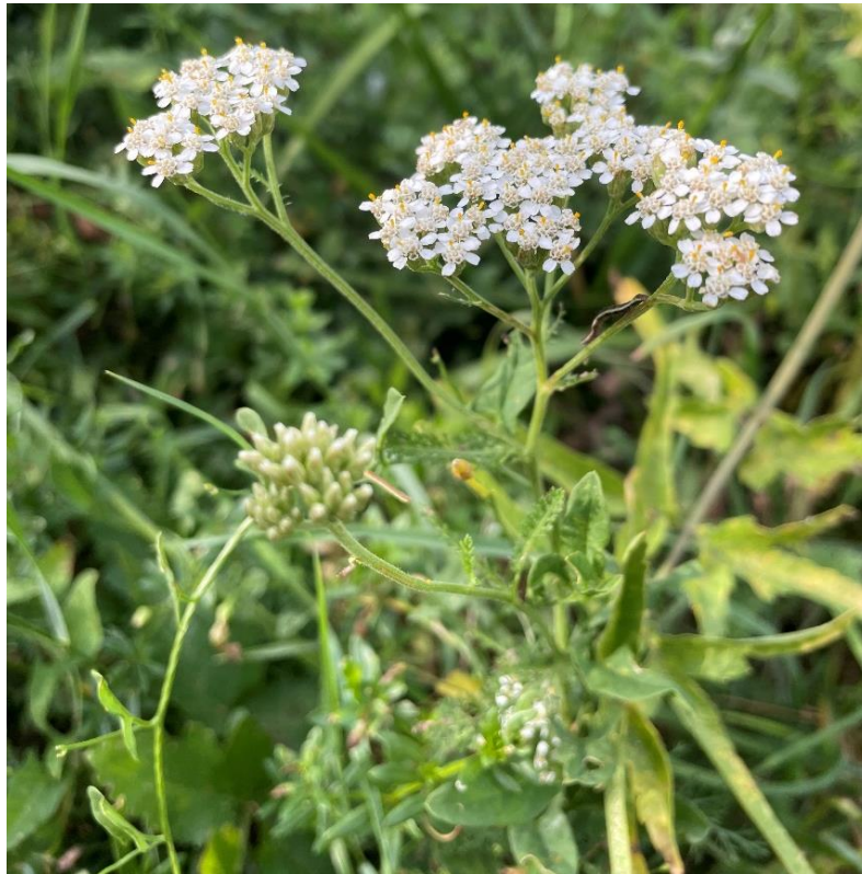
Slika 3. Cvat običnog stolisnika (područje Osječko-baranjske županije, Dalj)

pripremu čajeva, ekstrakt kao dodatak biljnim bombonima, dok se eterično ulje dodaje likerima (Grlić, 2005., Nowak i sur., 2010.). Filipović (2021.) navodi da 51,3 % ispitanika koristi stolisnik kao čaj ili kao tinkturu odnosno kremu.