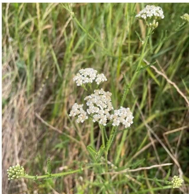
Slika 1. Stabljika i cvat običnog stolisnika (područje Osječko-baranjske županije, Dalj) (Bulić, A., proljeće 2024.)

Obični stolisnik je otporna trajna zeljasta biljka s plitkim sustavom podanka koja pripada porodici cjevastocjetnih glavočika (Asteraceae), te rodu Achillea koji obuhvaća približno od 110 do 140 vrsta (Ehrendorfer i Guo, 2006.). Naziv Achillea odnosi se na Ahileja, junaka trojanskog rata, koji je koristio stolisnik za liječenje rana vojnika u književnom djelu Ilijada (Saeidnia i sur., 2011.). Stabljika stolisnika je uspravna, većinom jednostavna, prekrivena vunenastim dlakama (slika 1), a naraste do 60 centimetara visine. Naziv millefolium što znači 'tisuću listova' stolisnik je dobio prema tamnozelenim, aromatičnim i višestruko perasto razdijeljenim listovima (slika 2), prepoznatljiva filigranska izgleda. Cvjetovi običnog stolisnika (slika 3) su sitni, bijele ili blagoružičaste boje, a skupljeni su u plosnate okrugle cvatove (glavice) promjera do 6 mm koji se pojavljuju tijekom ljeta i jeseni. Plod je roška bez papusa (Ljubešić, 2010., Hulina, 2011., Raudone i sur., 2024.).