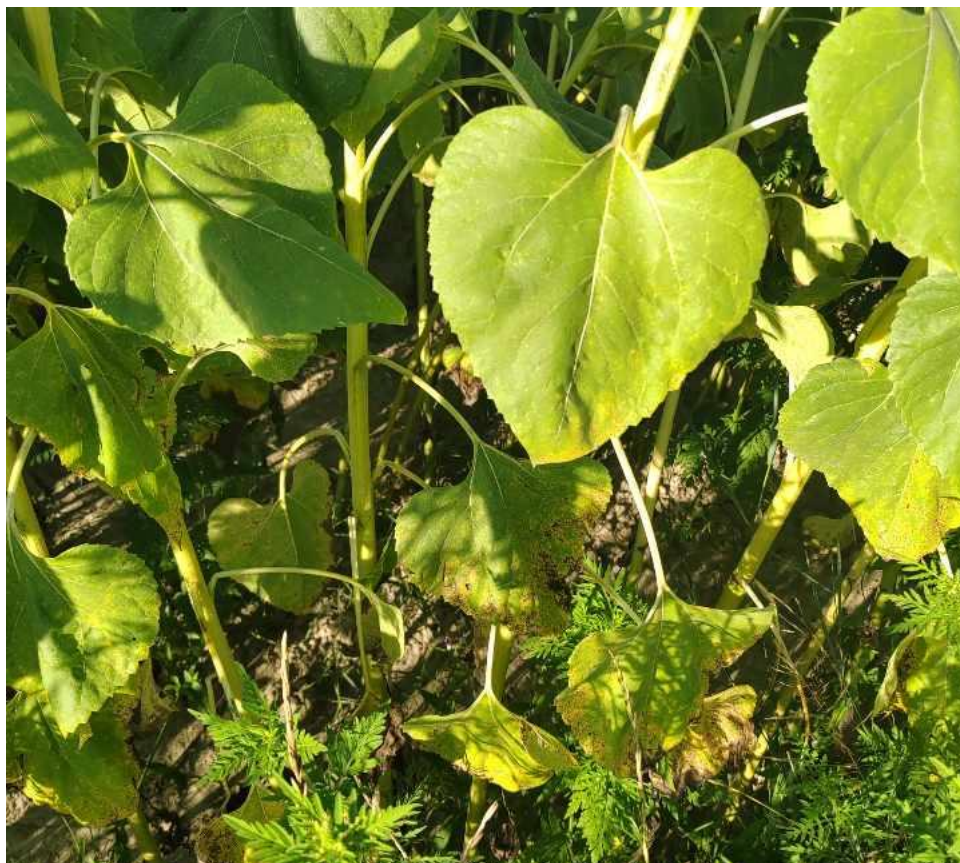
Slika 7. Pojava Septoria helianthi i Alternaria helianthi u slabom intenzitetu