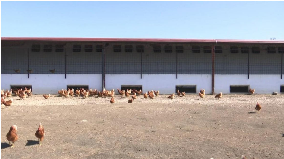
Slika 2. Farma koka nesilica u Soljanima

osnivači se navodi Vukovarsko-srijemska županija, Fakultet agrobiotehničkih znanosti Osijek, pet općina (Cerna, Vrbanja, Stari Jankovci, Lovas, Drenovci) i Poljoprivredna zadruga „Vinkovačka šparoga“. Cilj osnivanja usmjeren je na učinkovitije osnaživanje i poticanje cjelokupnog poljoprivredno-prehrambenog sektora Vukovarsko-srijemske županije, a posebno malih obiteljskih poljoprivrednih gospodarstava ( www.agro-klaster.hr ). Agroklaster je napuštenu zgradu u Soljanima prenamjenio u farmu za slobodni uzgoj nesilica gdje je zaposleno lokalno stanovništvo (slika 2).