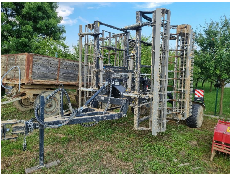
Slika 6. Kompaktor