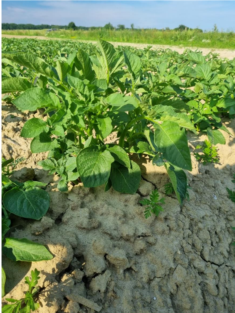
Slika 4. Cima

Podzemni dio stabljike se sastoji od stolona i gomolja. Stoloni su podzemne grane krumpira na čijim krajevima rastu gomolji krumpira. Gomolji, koji su ubiti cilj sadnje krumpira, služe kao spremište rezervnih tvari u biljci koje biljka koristi kao hranu u nepovoljnim uvjetima. Svrha gomolja je također i nespolno razmnožavanje. Epiderma je pokrovni sloj gomolja (kod zrelih krumpira naziva se pokožica ili koža), a može biti bijele, žute, crvene, plave ili ljubičaste boje. Meso gomolja je bijele ili žute boje. Za stolon je vezan pupčani dio gomolja, a sa suprotne strane se nalazi kruna s okcima. Iz okaca može izrasti klica koja izrasta u novu biljku krumpira. Veličina, tj. dubina okaca ovisi o sorti, a pogodno je da su okca što plića kako bi guljenje krumpira bilo olakšano s optimalnom količinom otpada.