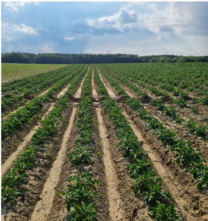
Slika 1. Krumpir u redovima

Krumpir (slika 1.) je dvogodišnja biljka koja raste kao zeljasta trajnica, a uzgaja se kao jednogodišnja biljka s gomoljem kao ciljem proizvodnje koji se koristi za ljudsku prehranu, hranidbu stoke itd. Biljka krumpira se sastoji od nadzemnog i podzemnog dijela.