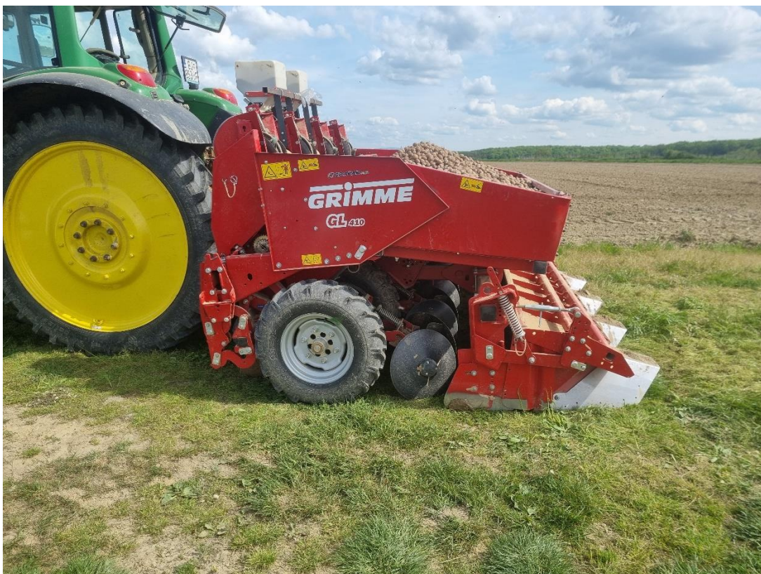
Slika 8. Sadilica za krumpir Grimme

Međuredni razmak iznosi 75 cm, dok razmak između gomolja u redu iznosi 35 cm. Jako je važno poštivati razmake između prohoda sadilice. Ako su susjedni redovi dvaju prohoda preblizu jedan drugome, tokom vađenja krumpira vadicica crtalom siječe susjedni red te presjeca gomolje u zemlji. Ukoliko su susjedni redovi predaleko jedan od drugoga, javlja se problem nespajanja prohoda prskalice te velike opasnosti od pojave bolesti i zakorovljavanja. Visina reda je 25 cm. Sorte opal je potrebno posaditi 2,7 t/ha kako bi se postigao optimalan sklop. Gomolj se sadi na dubinu od 10 do 12 cm od vrha gredice. Na promatranom zemljištu je krumpir posađen 1. travnja. Krumpir je u potpunosti niknuo 23.4. zbog dobre vlage i topline u tlu te dobrih vremenskih uvjeta.