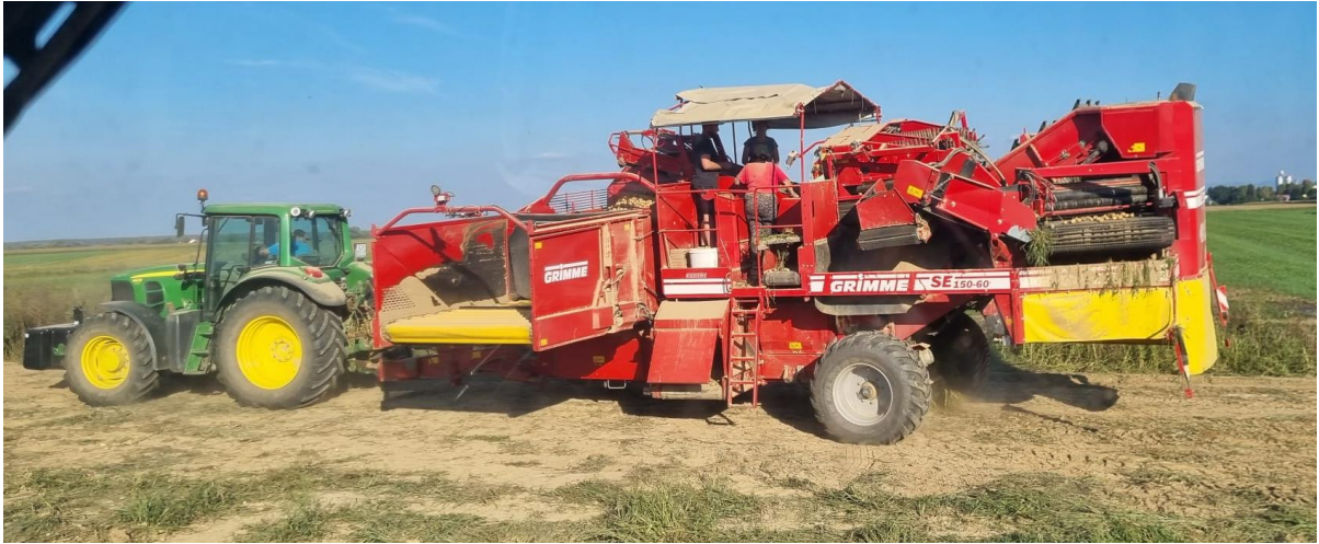
Slika 9. Kombajn za krumpir Grimme i traktor John Deere

Brzina vađenja ovisi od količine busa, ako su uvjeti optimalni i prinos visok moguće je vaditi krumpir brzinom od 6-7 km/h, ali to je vrlo rijetko, stoga prosječna brzina vađenja iznosi oko 3.5 km/h s kombajnom koji koristimo. Prosječna brzina na ovom zemljištu je iznosila 2 km/h.