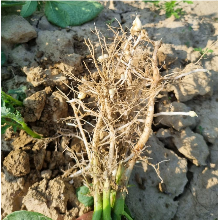
Slika 3. Podzemna stabljika s vidljivim korjenjem 45 dana nakon sadnje