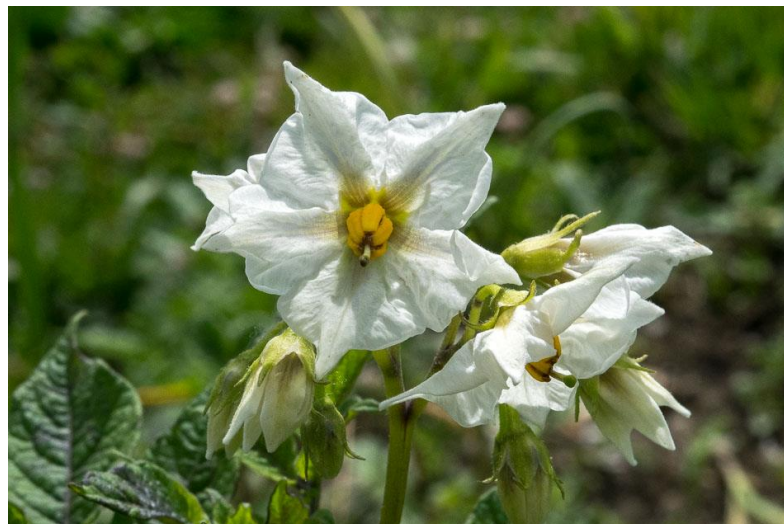
Slika 5. Cvijet krumpira

Cvjetovi (slika 5.) se sastoje od pet latica, pet lapova, pet prašnika i jednog tučka, a latice su međusobno srasle. Boja latica varira od bijele do ljubičaste i plave, ovisno o sorti. Cvjetovi se nalaze na vrhu biljke.