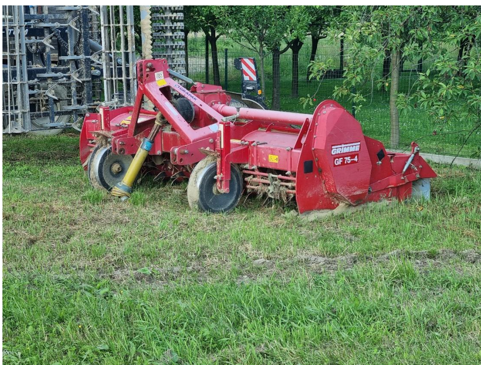
Slika 7. Freza/gredičar Grimme