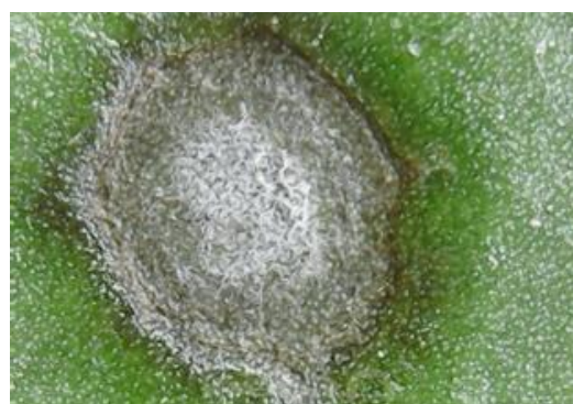
Slika 11. i 12. Cercospora beticola Sacc., mikroskopske slike (Viro, Šećerana Virovitica)