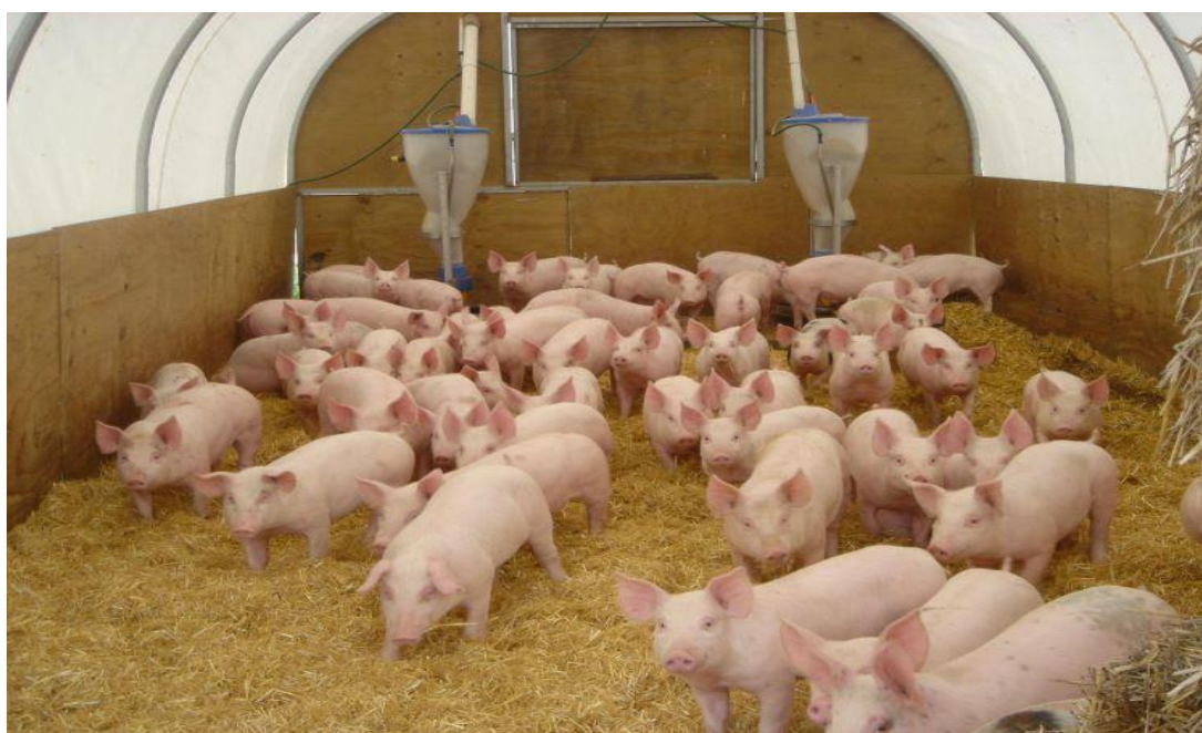
Slika 12. Držanje svinja na dubokoj stelji

Adekvatan smještaj i prostor važni su za dobrobit svinja i mogu neizravno utjecati na kvalitetu masti. Prenapučenost ili ograničeni prostor mogu dovesti do stresa, smanjene tjelesne aktivnosti i povećane konkurencije za resurse, što može negativno utjecati na rast svinja i taloženje masti. Osiguravanje svinjama dovoljno prostora, udobne stelje i čistog okoliša pomaže u promicanju njihove opće dobrobiti, što može doprinijeti boljoj kvaliteti masti (Perez-Hernandez i sur., 2022.).