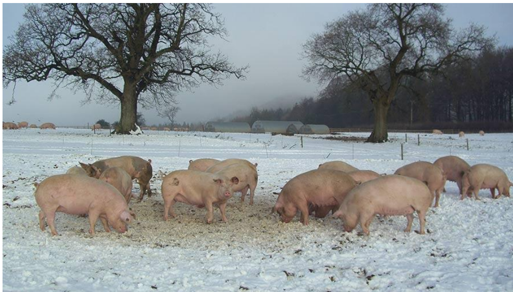
Slika 10. Držanje svinja u uvjetima niskih temperatura okoliša

Temperatura okoliša može utjecati na masno tkivo svinja. U hladnim okruženjima svinje mogu iskusiti povećanje taloženja potkožnog masnog tkiva kao prirodni odgovor na osiguravanje izolacije i održavanje tjelesne temperature. Dodatna mast djeluje kao izolacijski sloj, pomažući svinjama da očuvaju toplinu i smanje gubitak topline u okolinu. Niske temperature mogu potaknuti nakupljanje potkožnog masnog tkiva kako bi se poboljšala toplinska regulacija i zaštitila svinja od hladnog stresa (Uremović i Uremović, 1997.).