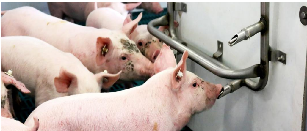
Slika 8. Napajanje svinja