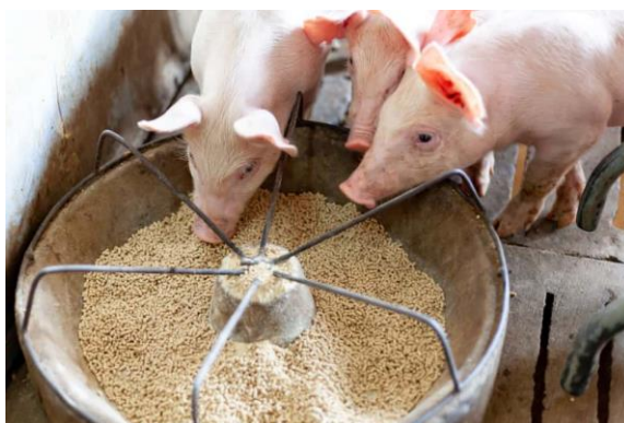
Slika 5. Hranidba svinja

Metabolizirajuća energija (ME) predstavlja energiju koja je dostupna svinji nakon što se uzme u obzir energija izgubljena u izmetu, urinu i plinovima nastalim tijekom probave. Obično se izražava u kilokalorijama (kcal) po kilogramu (kg) ili megadžulima (MJ) po kilogramu krmiva. Udio ME u hrani za svinje utvrđuje se laboratorijskom analizom ili procjenjuje na temelju sastava sastojaka krme (Switonski i sur., 2010.).