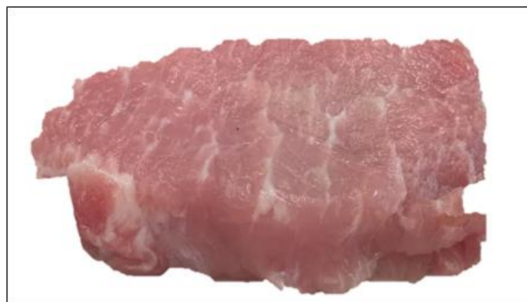
Slika 4. Sadržaj intramuskularne masti u mesu crne slavonske svinje