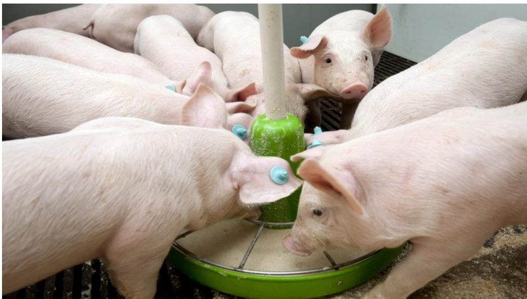
Slika 7. Hranidba odbite prasadi

prehrana u suhom obliku ili obliku peleta. Svinje u ovoj fazi mogu se hraniti ad libitum , dopuštajući im da jedu onoliko koliko žele, ili kroz ograničene programe hranjenja gdje se količina hrane kontrolira kako bi se optimizirao rast uz smanjenje gubitka.