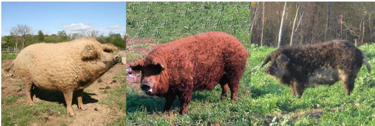
Slika 1. Bijeli, crveni i lasasti soj mangulice

Nastankom bijele mangulice i naglim porastom njenog broja došlo je do širenja ove pasmine u sve dijelove tadašnje Ugarske, pa tako i u Srijem i Banat. U Srijemu je, na gospodarstvu u blizini mjesta Buđanovci došlo do križanja bijele mangulice s tadašnjom „sremskom svinjom” („crna rudasta sriemska svinja”) koja je bila crne boje, a pretpostavlja se da je nastala križanjem šumadinke i crnih talijanskih svinja. Rezultat takvog križanja je svinja sivo crne čekinje s prljavo žutom linijom od donjeg dijela gubice, preko vrata, trbuha pa sve do repa, čiji je vrh crn. Ta svinja nazvana je lasastom mangulicom. Prema nekim izvorima, naziv je dobila po lasici ili po ptici lastavici, na čiju boju perja podsjeća, zbog kontrasta svjetle trbušne i tamne dlake. Prema drugim izvorima, za njeno ime zaslužni su žitelji Buđanovaca koje su tada nazivali „lasanima”. U to vrijeme, ovu svinju još se nazivalo i Buđanovačka rasa. Ona je posebno značajna za hrvatsko svinjogojstvo jer je sudjelovala u nastajanju crne slavonske svinje – fajferice. U istočnom Banatu, današnja Rumunjska, nastao je i treći soj mangulice - crvena mangulica.