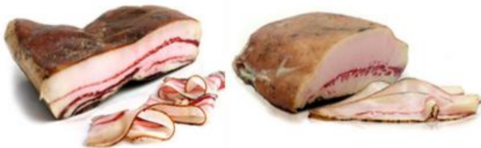
Slika 2. Slanina od mangulice

Istraživanje sastava masnih kiselina i udio kolesterola u svinjskoj masti mangulica i križanaca s mangulicom pokazuje da je udio nezasićenih masnih kiselina svinjske masti iznosio je preko 60 % kod mangulice i gotovo 60 % kod križanaca mangulice. Većina tih masnih kiselina bila je oleinska (43,6 – 44,8 %) i linolna kiselina (10,6 – 11,5 %). Pri tome, koncentracija kolesterola nije se značajno razlikovala između mangulica, njenih križanaca i mesnatih pasmina svinja, no kod mangulice i njenih križanaca utvrđen je veći udio tzv. „dobrog” kolesterola. Navedeno je da se 68,7 % udjela unutarmišićne masti u m. longissimus dorsi sastojalo od nezasićenih masnih kiselina, što je najmanje 6 % više nego kod njemačkog landrasa i njemačkog Sattelschweina. Sve navedeno dovelo je do toga da danas, osim nutricionista, čak i liječnici preporučuju konzumiranje masti od mangulice u preventivne i kurativne svrhe (Parunović i sur., 2015.).