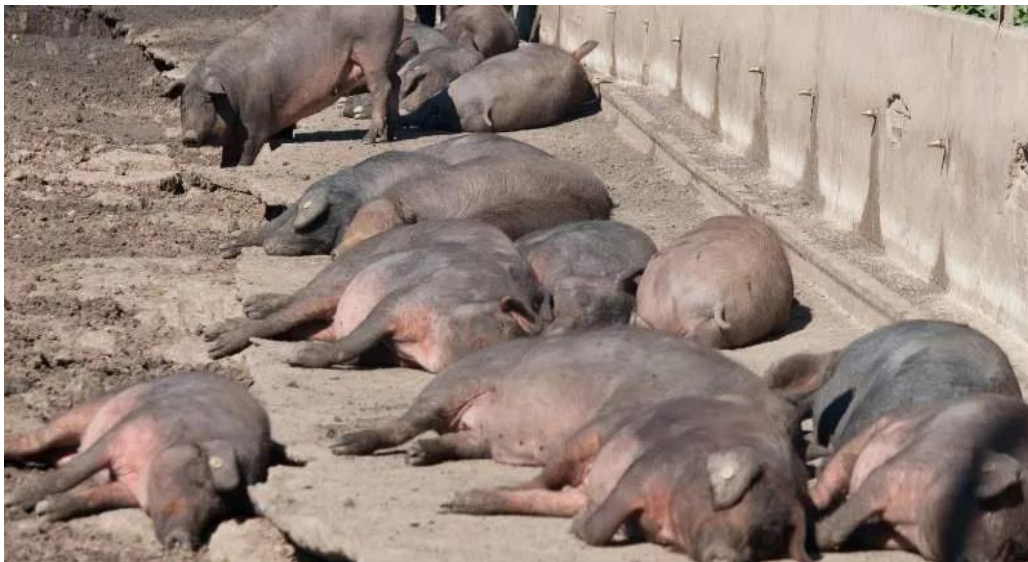
Slika 11. Držanje svinja u uvjetima visokih temperatura okoliša

Visoke temperature okoline mogu dovesti do toplinskog stresa kod svinja, što može utjecati na metabolizam i sastav masti. Toplinski stres može uzrokovati promjene u metabolizmu lipida i sastavu masnih kiselina u masnom tkivu. Može dovesti do povećanja nezasićenih masnih kiselina i smanjenja zasićenih masnih kiselina, potencijalno mijenjajući profil masnih kiselina u svinjskoj masti (Liu i sur., 2022.).