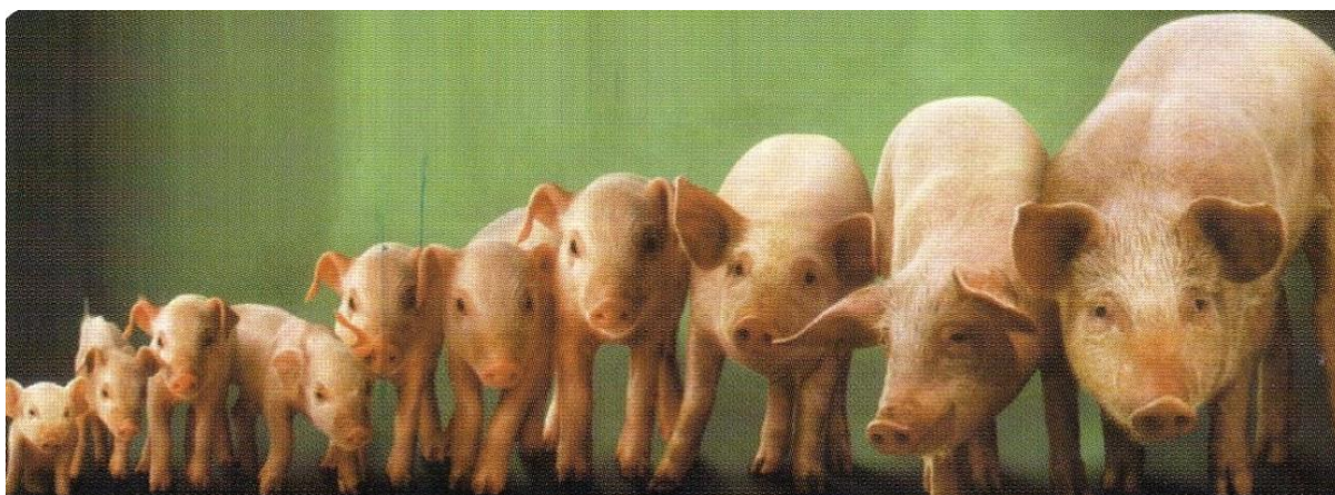
Slika 9. Različiti stadiji rasta svinja

Kako svinje stare, sastav i kvaliteta njihove masti mogu se promijeniti. Mlađe svinje obično imaju veći udio nezasićenih masnih kiselina u masti u usporedbi sa starijim svinjama. Mast od mlađih svinja obično je mekša i ima nižu točku taljenja zbog viših razina nezasićenih masnih kiselina, što može doprinijeti poželjnijoj kvaliteti masti (Cannon i sur, 1995.).