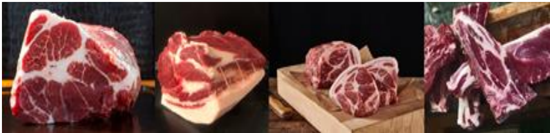
Slika 3. Meso mangulice

kvalitativna i tehnološka svojstva daleko su iznad mesa spomenutih svinja. Sadržaj unutar-mišićne masnoće, boja, pH vrijednost i sposobnost zadržavanja mesnog soka čine danas meso mangulice najkvalitetnijim svinjskim mesom koje se može pronaći na tržištu.