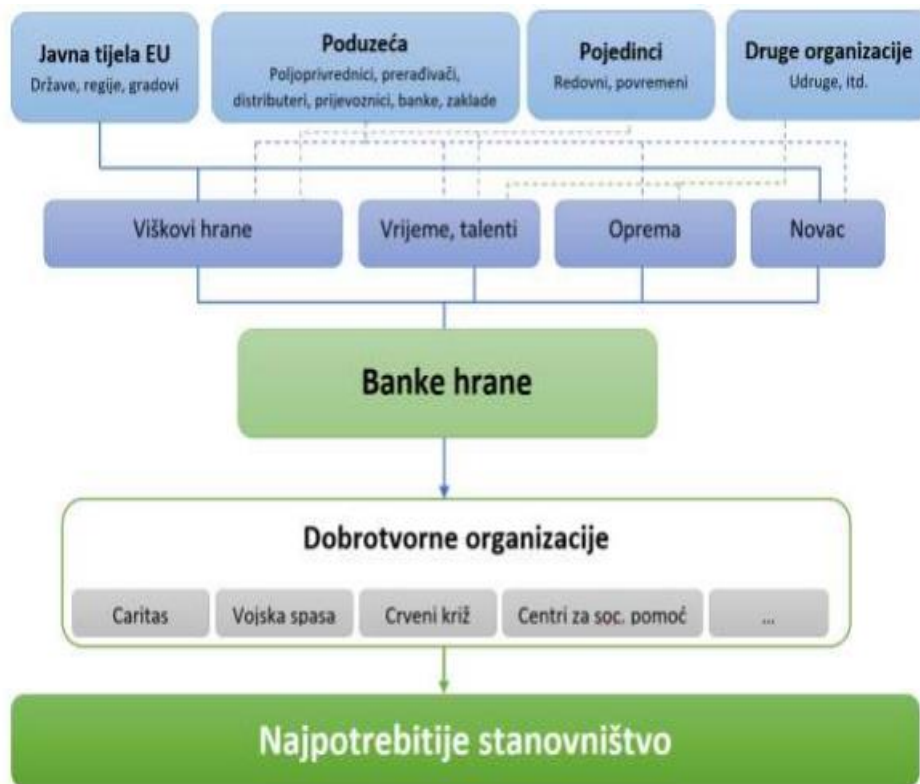
Slika 3. FEBA-in modeli za organizaciju i distribuciju hrane