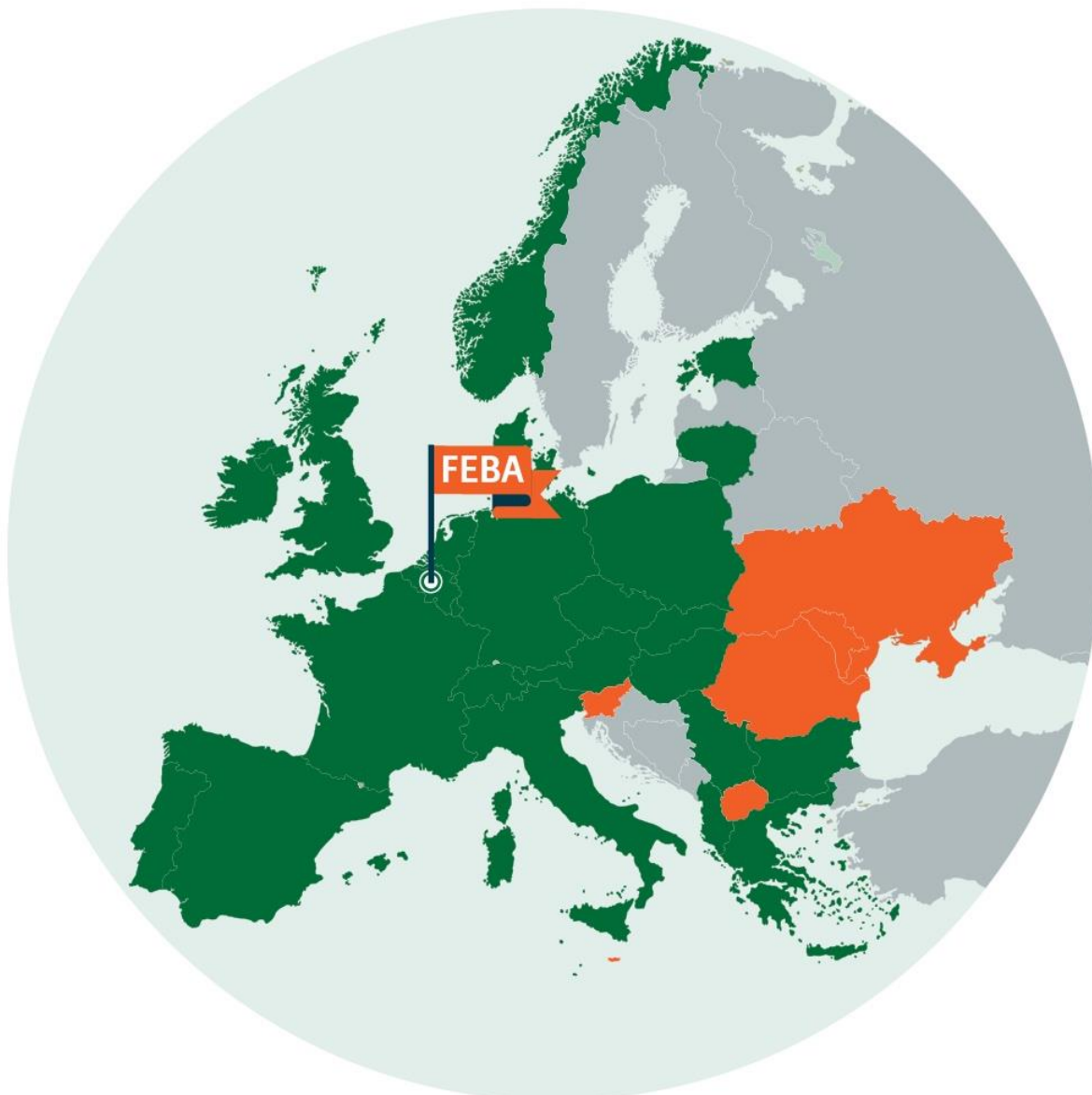
Slika 1. Članice i pridružene članice FEBA-e