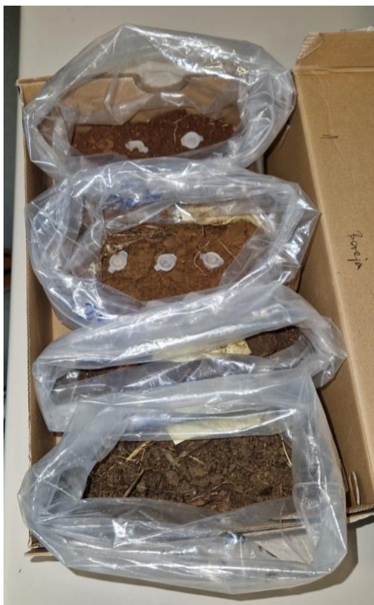
Slika 8. Izgled postavljenog pokusa