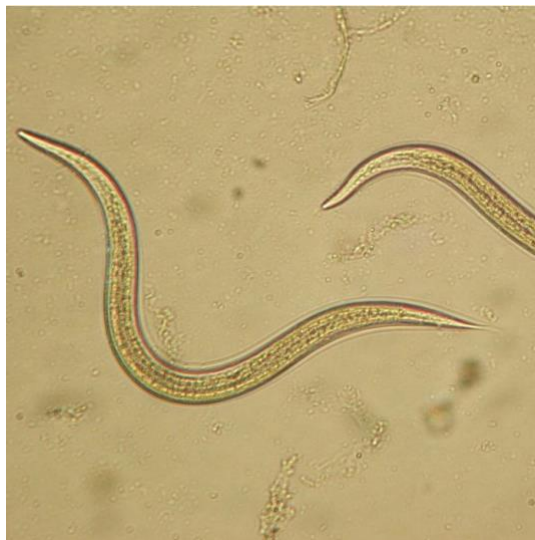
Slika 1. Entomopatogena nematoda iz roda Steinernema

Imaju minimalan utjecaj na neciljane organizme što ih čini ekološki prihvatljivim izborom za suzbijanje štetnika. Smatraju se sigurnim sredstvom za korisne organizme, ljude i životinje. Također, doprinose poboljšanju tla povećavajući mikrobiološku aktivnost i plodnost, čime potiču održivu poljoprivredu i dugoročnu produktivnost tla (Nježić, 2016.). Prednost korištenja entomopatogenih nematoda u sredstvima za zaštitu bilja je njihova jednostavna primjena. Osim toga, u većini zemalja sredstva koja sadrže entomopatogene nematode ne zahtijevaju registraciju, što olakšava njihovu upotrebu u poljoprivredi.