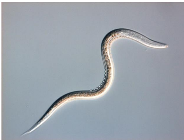
Slika 2. Entomopatogena nematoda iz roda Heterorhabditis