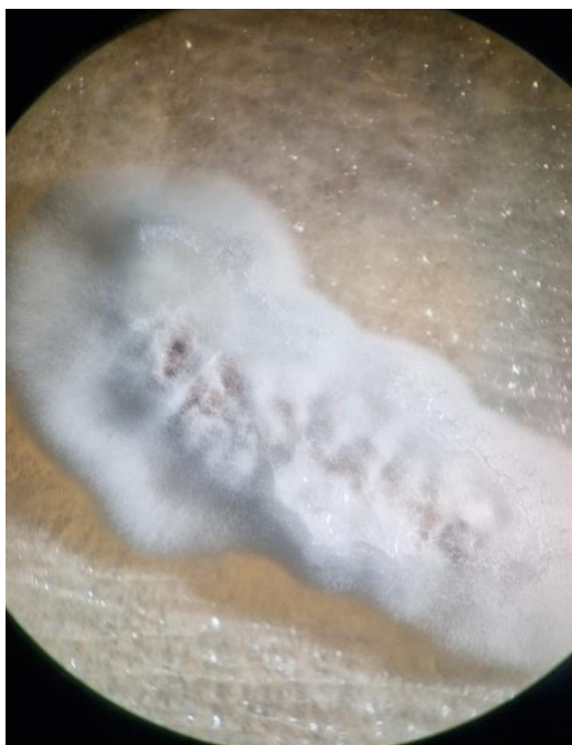
Slika 3. Bijeli micelij Beauveria bassiana razvijen na uginulom kukcu