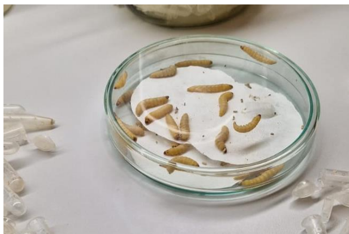
Slika 6. Gusjenica Galleria mellonella L.

Na Fakultetu agrobiotehničkih znanosti Osijek u laboratoriju za entomologiju i nematologiju provedeno je istraživanje s ciljem utvrđivanja prisutnosti entomopatogenih gljiva i entomopatogenih nematoda u tlu iz maslinika. Za izdvajanje entomopatogenih nematoda i gljiva iz uzoraka tla korištena je insect bait metoda.. U ovoj metodi za kukca mamca korištene su gusjenice velikog voskovog moljca ( Galleria mellonella L.) (Slika 6.).