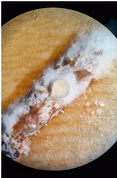
Slika 9. Galleria mellonella L. prekrivena micelijom entomopatogene gljive

Kako bi se utvrdila prisutnosti gljive na uginuloj gusjenici u sterilnom okruženju, pomoću mikrobiološke ušice, uzet je uzorak gljive s tijela gusjenice i prebačen u Petrijevu zdjelicu s PDA podlogom. Petrijeva zdjelica s PDA podlogom zatvorena je parafilmom kako bi se spriječila kontaminacija i razvoj drugih mikroorganizama. PDA podloga s nacijepljenom gljivom ostavljena je deset dana na sobnoj temperaturi dok se gljiva potpuno razvila, nakon čega je prebačena u hladnjak na 4 °C kako bi se očuvala duži period.