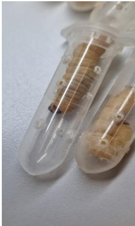
Slika 7. Gusjenice velikog voskovog moljca u kivetama spremne za umetanje u uzorke tla

Prije postavljanja pokusa, uzorci tla pripremljeni su stavljanjem u plastične vrećice i ostavljanjem na sobnoj temperaturi kako bi se tlo prilagodilo okolnim uvjetima, te potaknula aktivnost entomopatogena. Osim pripreme tla, pripremljene su i plastične kivete, s probušenim sitnim rupicama. Kako bi gusjenice mogle disati i omogućile entomopatogenim organizmima da dopru do gusjenica velikog voskovog moljca. Gusjenice su postavljene u plastične kivete, potom u uzorak tla. (Slika 7.).