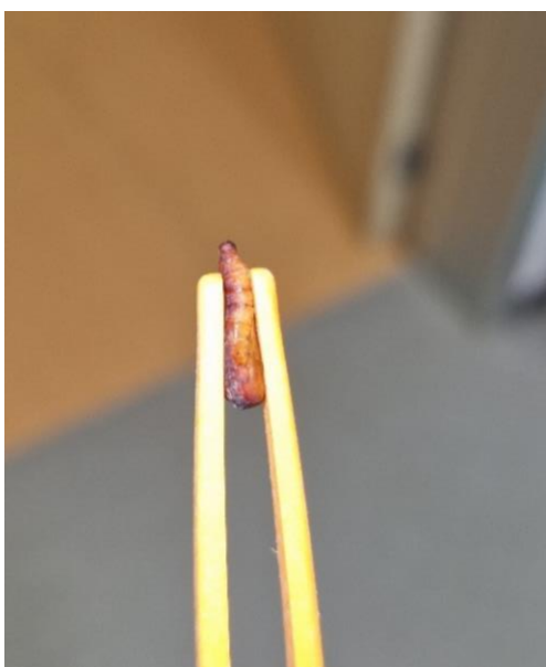
Slika 10. Kukuljica velikog voskovog moljca