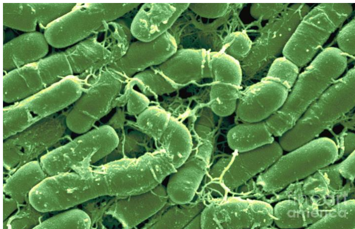
Slika 4. Entomopatogena bakterija Bacillus thuringiensis pod mikroskopom

sadrže navedenu bakteriju vrlo su učinkoviti zbog bakterijske proizvodnje kristala koji su toksični za kukce.