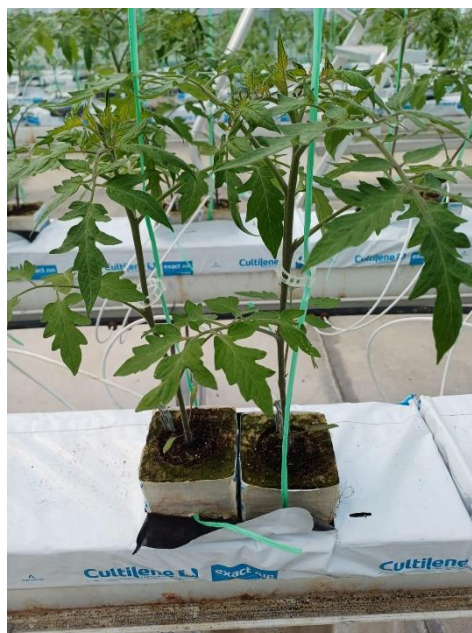
Slika 23. Prikaz postavljenih presadnica u hidropon.

svaki red jedan do drugog. Iznad redova se napinje žica s kojih se za svaku biljku spušta potporno PE vezivo. Biljke su prije postavljanja u hidropon presađene u kocke kamene vune. Dana 15.04.2024. godine presadnice rajčice u kockama kamene vune su postavljene na blokove u prethodno opisani hidropon. Kocke su se postavljale na već označena mjesta na blokovima, a ispod svake kocke je provučeno potporno vezivo (Slika 22.). U svaku kocku je postavljen po jedan emiter za hranjivu otopinu. Prilikom samog postavljanja presadnica, veziva i emitera je bilo potrebno paziti da se isti ne isprepletu kako kasnije ne bi došlo do komplikacija tijekom proizvodnog procesa. U trenutku sadnje tj. postavljanja biljaka rajčice, iste su bile u fenofazi cvatnje te je prva cvjetna etaža već bila zametnuta. Nakon postavljanja presadnica, odmah je pokrenut sustav za fertirigaciju.