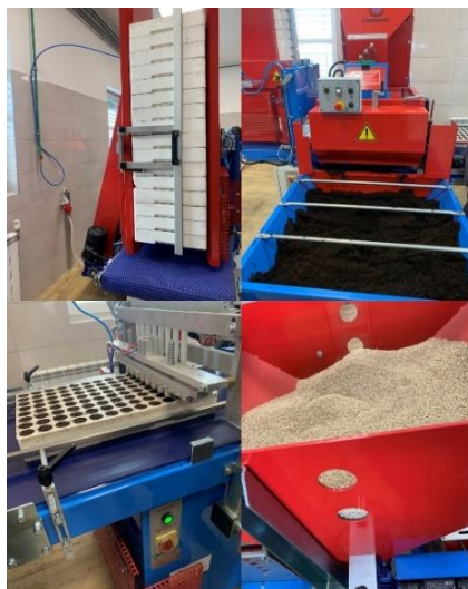
Slika 21. Prikaz robota za sjetvu sjemena.

Poljoprivredno šumarska škola posjeduje i automatiziranu liniju za sjetvu tj. robota za sjetvu. Robot se sastoji od stalka na koji se postavljaju kontejneri od stiropora, sanduka tj. spremnika za supstrat, glave tj. punjača kontejnera sa supstratom, transportne trake, ulagača sjemena i na kraju spremnika i punjača koji dodaje vermikulit. Kontejneri se pune supstratom te trakom lagano dolaze do dijela za postavljanje sjemena. Nakon što je sjeme postavljeno trakom odlazi do sanduka s vermikulitom koji se postavlja kao zadnji tj. zaštitni sloj te, a osigurava ujednačenije klijanje i nicanje. Nakon što je vermikulit postavljen, kontejner se skida s robota i odlaže sa strane.