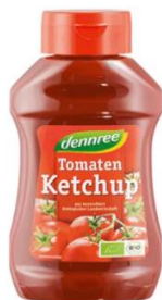
Slika 5. Prerađevina rajčice - kečap.

Rajčica je vrlo rasprostranjena u svijetu. Najviše se koristi u svježem stanju, ali i za proizvodnju različitih prerađevina (pasirana rajčica, pelati, koncentrat rajčice, kečap, sok od rajčice) (Slika 5.). Zeleni plodovi se mogu koristiti kao sastojak mariniranih miješanih salata.