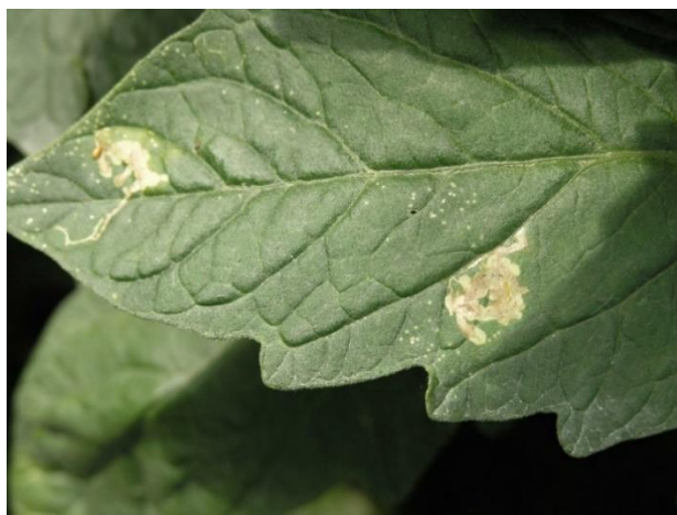
Slika 12. Lisni mineri na listu rajčice.

Lisni mineri imaju četiri razvojna stadija: jaje, ličinka, kukuljica i imago. Jaja su ovalnog oblika duga oko 0,35mm. Boja im varira od bijele do tamnije smeđe. Nakon izlijeganja, ličinke su bijele boje. Kako se razvijaju tako mijenjaju boju u svijetlo-ružičastu. Duga je oko 7,5 mm. Prije nego gusjenica postane kukuljica, ponovno mijenja boju i postaje svjetlije zelena. Kukuljice su dužine oko 5,5 mm, dok je imago dužine oko 10 mm. Ženke jaja polažu pojedinačno na naličju lista, stabljici i čaški. Kukuljiti se mogu unutar mine bez čahurenja ili na listu izvan mine stvaranjem čahure. Životni ciklus ovisi o temperaturi. U zaštićenom prostoru ima 10 – 12 generacija. Štete radi na plodu, stabljici i listu. Prisutnost možemo utvrditi feromonskim lovkama (Maceljski i sur., 2004.).