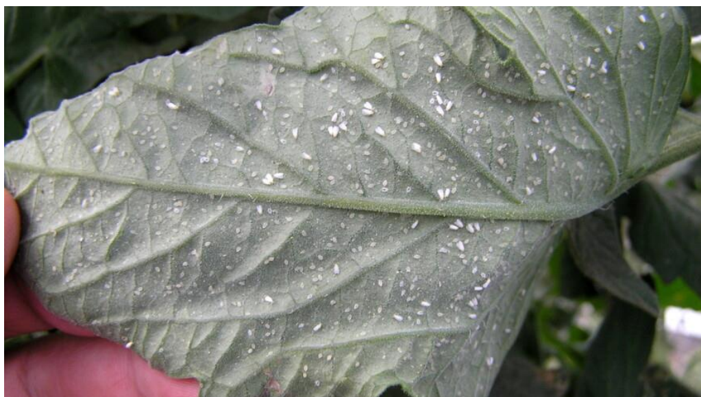
Slika 11. Štitasti moljac na naličju lista.

Štitasti moljac je jedan od gospodarski najvažnijih štetnika rajčice. Maleni je kukac koji je u odraslom stadiju dužine 2 mm, dok je ličinka veličine 0,2 – 1 mm. Tijelom mu je prekriveno bijelim prahom koji potječe od voštanih izlučevina. U zaštićenim prostorima prisutni su tijekom cijele vegetacije. Razmnožavanje štitastog moljca može biti spolno i nespolno. Kod nespolnog razmnožavanja iz neoplođenih jaja razvijaju se isključivo mužjaci. Ženke jaja polažu na naličju lista pojedinačno ili u skupinama, a često to bude u obliku polukruga ili potpunog kruga. Jaja su eliptičnog oblika, u početku svijetložuta i kasnije smeđe boje. Iz jaja se razvija ličinka prvog stadija koja ima tri para nogu, i jedini su pokretni stadij ličinke. Štete na biljkama uzrokuju odrasli stadiji i ličinke tako što sišu biljne sokove na listovima te tako dolazi do odumiranja listova. Napad štitastog moljca može se prepoznati po simptomima koji se pojavu na lišću u obliku klorotične pjegavosti, žućenja i gubitka turgora. Ličinke sisanjem biljnih sokova dovode do oštećenja koji kasnije rezultiraju neujednačenim dozrijevanjem ploda (Šimala i sur., 2016.). Sekundarne štete javljaju se lučenje medne rose. Odrasli kukac i ličinka luče mednu rosu na kojoj dolazi do razvoja gljive čađavice. Ako dođe do pojave gljive čađavice na listu, smanjuje se njegova asimilacijska površina, a plodu se smanjuje njegova tržišna vrijednost.