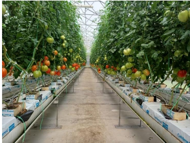
Slika 28. Neujednačenost dozrijevanja plodova rajčice (Ergon F1).

Plodovi rajčice kod sorata u beef tipu rajčice (plodovi na rastresitoj cvati) kao što je slučaj kod hibrida Ergon F1, ne dozrijevaju u isto vrijeme. Rajčica koja se bere za prodaju mora biti tehnološki zrela. U početku se berba obavlja svaka 3 – 4 dana, kasnije svaka 2 – 3 dana, a ponekad i svaki dan.