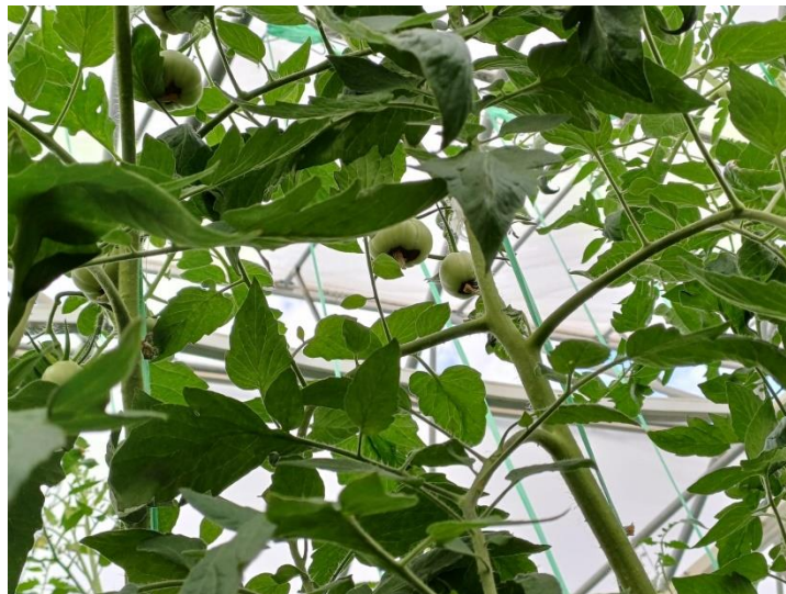
Slika 27. Pojava plamenjače na plodu rajčice.

Tijekom proizvodnog ciklusa i to pred sam početak zriobe plodova pojavila se plamenjača. Sukladno, obavljeno je jedno tretiranje s Polyram-om u dozi od 100 g na 400 kvadrata.