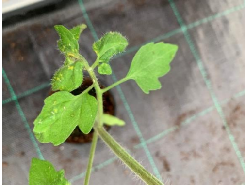
Slika 13. Lisne uši na listu rajčice.

Pojava lisnih ušiju je opasna jer izazivaju zastoje u rastu biljke i dolazi do kovrčanja listova. Iza njih ostaje medna rosa koja kaplje po donjim listovima čineći ih ljepljivim gdje se nakon toga razvijaju gljive čađavice. Lisne uši su vektori virusa. Javljaju se u proljeće i jesen za vrijeme toplog i suhog vremena kao i nakon obilnih kiša. Prirodni neprijatelj lisnih ušiju je bubamara.