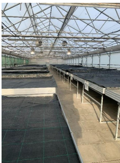
Slika 17. Plastenik s rolo stolovima.

Poljoprivredno šumarska škola Vinkovci proizvodnju presadnica rajčice za sadnju u hidropon obavlja u plasteniku opremljenim rolo stolovima (Slika 17.). Rolo stolovi su dubine oko 105 mm i pune se vodom kako bi biljke tj. presadnice dobile potrebnu količinu vode i hranjiva.