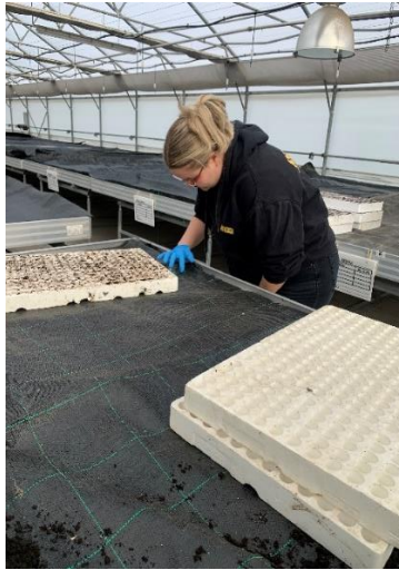
Slika 20. Postavljanje sjemena u kontejner za presadnice.

višak supstrata je lagano rukama uklonjen s kontejnera. Na vrh je zatim dodan vermikulit zbog poboljšavanja prozračnosti i sprečavanja jake evaporacije vode.