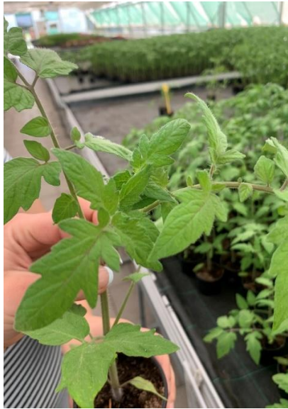
Slika 2. Listovi rajčice.

Listovi rajčice su složeni i neparno perasti na dugoj peteljci (Slika 2.). Kod povoljnih uvjeta list može narasti do 50 cm dužine. Liske su nejednake veličine, nazubljene, manje ili više naborane i dlakave.