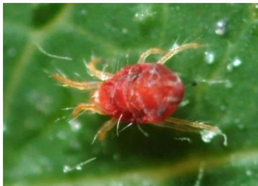
Slika 14. Crveni pauk na listu rajčice.

Crveni pauk je grinja. Imago je ovalnog oblika, nježne je građe i gotovo proziran te dug oko 1 mm. Boja tijela im varira od bjelkaste do crvenkaste, a ovisno o biljci na kojoj parazitiraju. Simptomi zaraze uočavaju se na listu u obliku klorotičnih pjega. Za razvoj crvenog pauka potrebna je niska relativna vlaga, visoka temperatura i obilje svjetla. Za razvoj od jajeta do imaga potrebno je 8 – 12 dana. Ženka živi oko 30 dana i za to vrijeme odloži 90 – 120 jaja. Jaja polaže po cijelom listu gdje nakon 3 – 5 dana izlaze ličinke koje prolaze tri stadija (Maceljski i sur., 2004.).