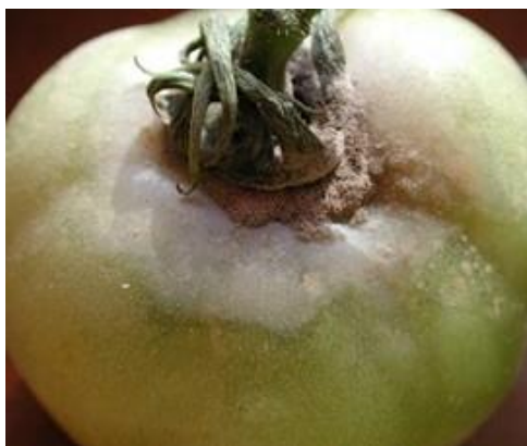
Slika 8. Prikaz simptoma na plodu rajčice.

Siva plijesan ekonomski je značajna bolest na rajčici, a uglavnom se pojavljuje u zaštićenom tipu proizvodnje zbog pogodnih uvjeta za razvoj bolesti. Do infekcije osjetljivih biljaka dolazi kroz prirodne otvore ili rane (ubodi insekta, oštećenje od vjetra, zakidanje zaperaka). Za razvoj konidija i infekciju potrebna je kap vode ili visoka relativna vlažnost zraka te temperatura između 15 i 20°C. Klijanje spora potiču različite kemijske tvari poput aminokiselina, šećera, organskih kiselina, hormoni rasta i slično. Rasad rajčice može biti napadnut već u klijalistu. Kod presađenih biljaka napad se najčešće uočava na stabljici, na mjestu zakinutih zaperaka u obliku nekroza eliptičnog oblika sive boje. Idealno mjesto za razvoj gljive su dijelovi cvijeta nakon cvatnje. Do infekcije može doći i na mjestu gdje je plod pričvršćen za peteljku (Miličević, 2016.).