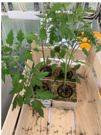
Slika 15. Proizvodnja presadnica rajčice u kockama kamene vune za sadnju u hidropon.