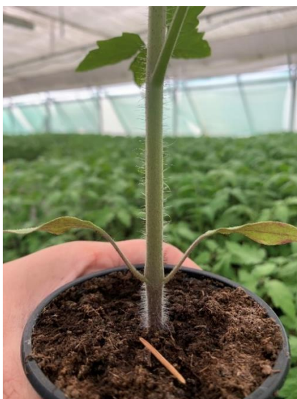
Slika 1. Stabljika rajčice.

Stabljika je zeljasta i prekrivena dlačicama (Slika 1). Postoje tri tipa stabljike: indeterminantan što označava nedovršen rast (visoke sorte), semideterminantan i determinantan kojeg odlikuje ograničen rast i grmolik oblik nadzemnog dijela. Indeterminantne sorte mogu narasti do nekoliko metara visine, a vegetacijski vrh im je aktivan sve dok imaju povoljne uvijete. Iz pazuha listova se razvijaju sekundarne grane koje se odstranjuju. Determinantna stabljika ima kraće internodije te naraste na visinu od 0,5 – 1 m, a na vrhu se stvara cvat. Iz pazuha listova se stvaraju sekundarne grane, koje imaju isti raspored listova i cvjetova kao i glavna stabljika. Iz tog razloga cijela biljka ima grmolik izgled (Lešić i sur., 2002; Matotan, 1994).