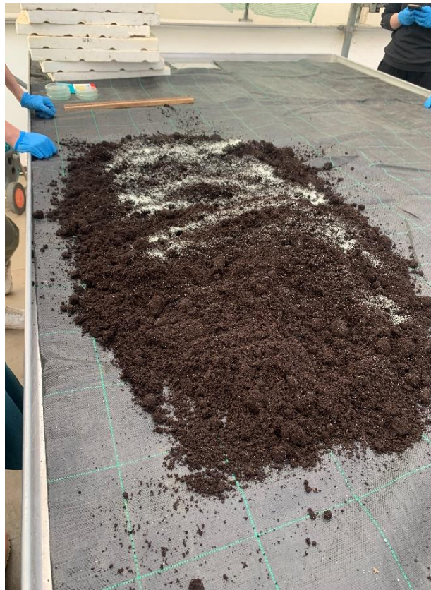
Slika 19. Miješanje supstrata i zeolita.

Kao medij rasta je korišten susprtat Potgrond H koji je mješavina crnog sphagnum treseta i finog bijelog sphagnum treseta. Supstrat je prije sjetve usitnjen i pripremljen za sjetvu. Nakon toga, dodan je prirodni mineral zeolit ZeoSand koji se koristi kao poboljšivač. ZeoSand regulira vlažnost tla i štedi vodu, djeluje na vodozračni režim, kao biostimulator rasta, štedi gnojiva, djeluje antiseptički, antibakterijski, antivirusno, te regulira pH tla.