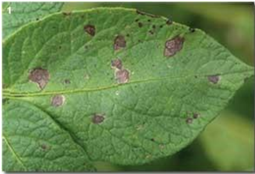
Slika 9. Koncentrična pjegavost na listu.

Na rajčici se ovaj uzročnik pojavljuje u svim uzgojnim područjima. Javlja se u humidnim i u semiaridnim područjima gdje su česte rose koje osiguravaju dovoljno vlage za razvoj gljive. Simptomi se mogu pojaviti na stabljikama, lišću i plodovima u bilo koje vrijeme vegetacije. Ukoliko do pojave bolesti dođe u stadiju klijanca dio biljaka će propasti, a preživjeli dio biljaka će zaostajati u rastu. Na njima se mogu uočiti smeđe dublje pjege, a mogu zaraziti i cijelo područje između dva nodija. Unutar većih pjega uočavaju se karakteristični koncentrični krugovi. Na starijem lišću prvo se uočavaju male smeđe do crne pjege nepravilnog oblika, a tkivo oko njih poprima žutu boju. Pjege brzo rastu te dobivaju manje ili više okrugao oblik s više koncentričnih krugova. Ukoliko se na listovima razvije veća količina pjega one se spajaju u veće nekrotične površine, ali unutar njih se uvijek vide pojedinačne pjege. Kod jake zaraze listova dolazi do njihovog sušenja i otpadanja. Bolest može izazvati defolijaciju, te dolazi do smanjena broja i veličine ploda. Na plodovima se zaraza pojavljuje dok su još zeleni ili tijekom sazrijevanja (Šubić, 2016.).