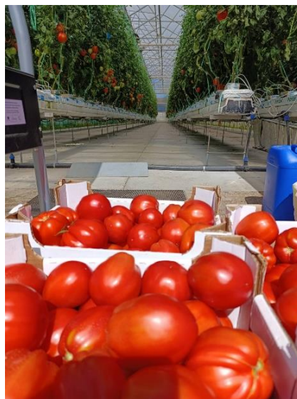
Slika 29. Prikaz ubranog ploda rajčice.

U školskom hidroponu prva berba je obavljena 20.06.2024. godine. Tehnološki zreli plodovi su brani ručno te odmah pakirani u kartonske kutije.