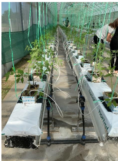
Slika 24. Prikaz navodnjavanja/prihrane rajčice.

Tablica 5. prikazuje recepturu hranjive otopine koje je bila primijenjena u početnoj fazi rasta i razvoja rajčice. Sva korištena hranjiva tj. soli se dodaju u spremnike i miješaju te se dobije bazna hranjiva otopina koja je koncentrirana te ju sustav kasnije distribuira prethodno miješajući s određenom količinom vode kako bi se dobila konačna koncentracija hranjive otopine (Slika 24.).