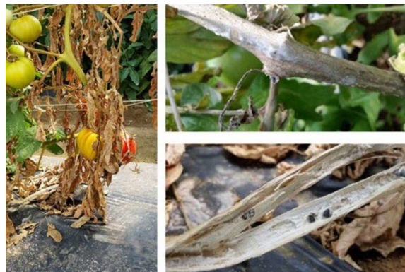
Slika 7. Bijela trulež rajčice.

Bijelu trulež uzrokuje polifagni parazit Sclerotinia sclerotiorum . Kod pojave bolesti glavni izvor zaraze su sklerociji. Sklerociji kličaju u micelij ili apotecij s askusima i askosporama. Klijanjem sklerocija u tlu dolazi do stvaranja micelija koji se prvo nastanjuje na mrtvu organsku tvar, a zatim prodire u korijen i vrši zarazu. Ako se bolest pojavi na stabljici zarazu obavljaju askospore. Hife iz proklijalih askospora se šire s lista na lisnu peteljku i stabljiku. Rajčica je na bijelu trulež osjetljiva u svim razvojnim stadijima, iako se prvi simptomi uočavaju u cvatnji. Zaraza se pojavljuje na stabljici u razini tla, iako ulazna mjesta za gljivu mogu biti pazušci zaperaka ili rane otkinutih zaperaka (Ivić, 2016.).