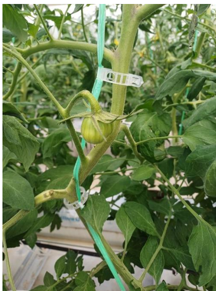
Slika 25. Prikaz pojave sive plijesni rajčice.

bolesti. Slika 25. prikazuje pojavu sive plijesni rajčice na mjestima uklanjanja zaperaka. S obzirom da se bolest pojavila samo na nekoliko biljaka, i to zbog neprofesionalnog uklanjanja zaperaka, zaražene biljke su uklonjene iz zaštićenog prostora kako ne bi došlo do daljnjeg širenja zaraze.