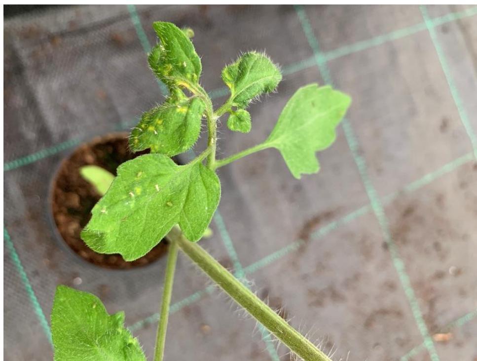
Slika 22. Pojava lisnih ušiju na presadnicama.

Nakon što je završena sjetva sjemena, kontejneri su postavljeni na rolo stolove u plasteniku. Tijekom svih 47 dana proizvodnje presadnica, iste su redovito navodnjavane. Nakon što su biljke razvile 2 – 3 lista, provedeno je pikiranje mladih biljaka koje su transferirane u pojedinačne plastične lončice. Biljke su redovito kontrolirane kako bi se smanjio rizik od jače pojave bolesti i štetnika. U plasteniku su se tijekom provedbe proizvodnje presadnica pojavile lisne uši na nekoliko presadnica (Slika 21.). Na presadnicama su se počeli uvijati listovi. Nakon uočavanja pojave štetnika zaražene presadnice su uklonjene iz plastenika kako ne bi došlo do daljnjeg širenja štetnika.