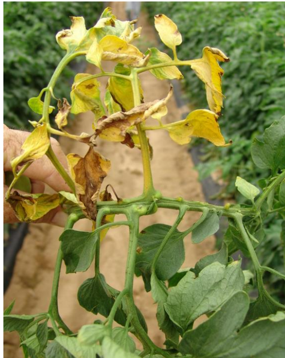
Slika 10. Simptomi fuzarijskog venuća na stabljici rajčice.

Gljiva Fusarium oxysporum u obliku klamidiospora može preživjeti dugi niz godina u tlu. U tlu može preživljavati do dubine 90 cm. Optimalna temperatura tla za razvoj gljive je 26 – 28°C. U zoni korijenovog vrata razvijaju se konidije i klamidiospore odakle se vodom dalje prenose u biljke. Kod proizvodnje u zaštićenim prostorima najčešći izvori zaraze su supstrati, presadnice, obuća i odjeća. Mlade biljke koje su dobivene iz zaraženog sjemena vrlo brzo propadaju bez vidljivih vanjskih simptoma. Biljke koje su zaražene preko tla imaju svijetlije glavne žile, a lišće počinje žutiti (Sever i Cvjetković, 2016.).