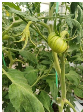
Slika 3. Prikaz cvijeta i razvoj ploda.

Prvi cvat javlja se na internodiju nakon 5 – 9 listova, što jednim dijelom ovisi o genotipu, a dijelom o temperaturama za vrijeme rasta i razvoja. Cvat je jednostavni ili složeni grozd. Jednostavni grozdovi imaju od 7 – 12 cvjetova, dok sastavljeni ima i višestruko više. Cvijet je dvospolan, većinom s pet lapova, pet latica i pet prašnika. Zeleni lapovi obuhvaćaju pup iz kojeg se javljaju žute latice (Slika 3.) (Lešić i sur., 2002; Matotan, 1994).