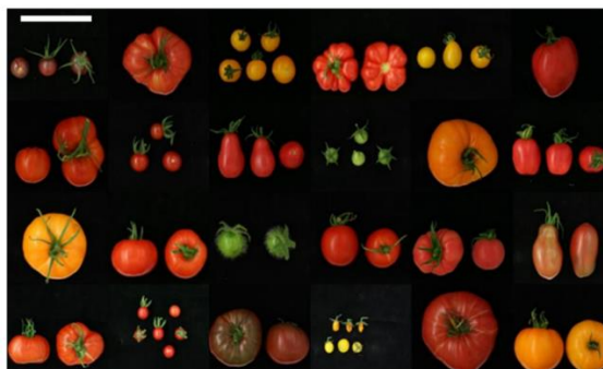
Slika 4. Prikaz različitih oblika rajčice.

Oblik ploda može biti srcolik, plosnati, okrugli (jabučar), ovalni (šljivar), naborani i kruškoliki. Stapka ploda ima na bazi sloj stanica koji omogućava da se plod odvaja zajedno s cijelom stapkom i čaškinim listićima. Oni ostaju uz plod, a tijekom rasta ploda oni se također povećavaju. Taj dio je uočljiv kao zadebljanje na stapci ploda. Kod proizvodnje rajčice za industrijsku preradu u kojoj se vrši mehanizirana berba, poželjno je da se plodovi odvajaju bez stapke. Rajčicu za svježnu potrošnju je potrebno brati sa stapkom (Lešić i sur., 2002; Matotan, 1994).