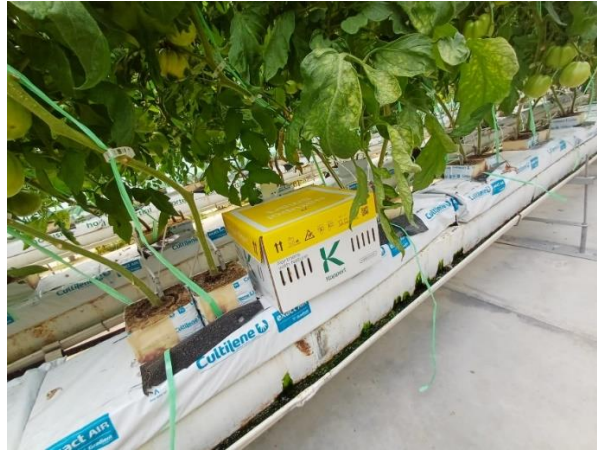
Slika 26. Košnica s bumbarima postavljena u hidropon.

Tijekom proizvodnog ciklusa i to pred sam početak zriobe plodova pojavila se plamenjača. Sukladno, obavljeno je jedno tretiranje s Polyram-om u dozi od 100 g na 400 kvadrata.