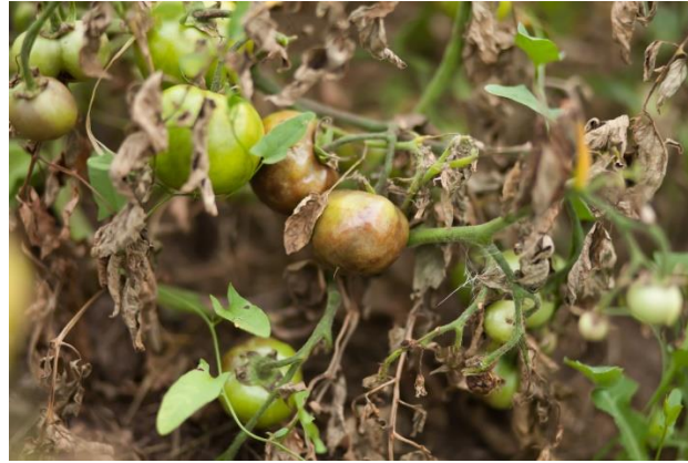
Slika 6. Prikaz plamenjače na nadzemnim dijelovima rajčice.