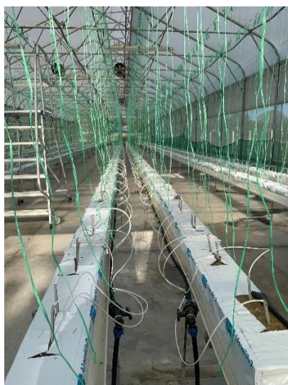
Slika 16. Prikaz sustava za navodnjavanje u hidroponu.

U hidroponskom uzgoju, ručno zalijevanje i prihrana ne osiguravaju kvalitetan uzgoj i veliki prinos te nisu prikladni za veće površine. Stoga, za hidroponski model proizvodnje potrebno je plastenik opremiti automatskim sustavom za navodnjavanje i prihranu (fertigacija). Sustav mora imati precizne dozatore, tajmer i senzor vlažnosti supstrata koji će točno odrediti potrebnu količinu i trenutak dodavanja hranjive otopine. Pri odabiru jedinice potrebno je voditi računa o dnevnoj potrošnji vode. Sustav za fertigaciju sadrži i senzore za kontrolu zaslanjenosti i pH vrijednosti (konduktometar i pH metar), a potrebno je imati i kontrolni set za kontrolu od strane tehnologa. Broj navodnjava tijekom dana ovisi o mikroklimatskim uvjetima, količini svjetlosti, razvijenosti nasada i supstratu.