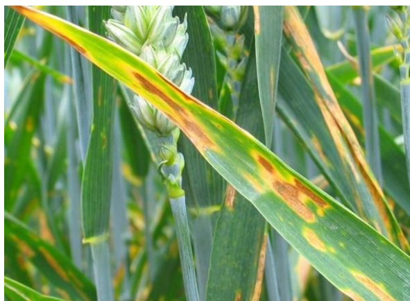
Slika 6. Smeđa pjegavost lista pšenice