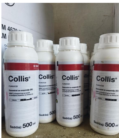
Slika 17. Fungicid Collis

Collis je kombinirani preventivni fungicid sistemičnog djelovanja, koji sadrži dvije aktivne tvari (krezoksim-metil i boskalid) koje se međusobno nadopunjuju u suzbijanju pepelnice, čime se osigurava sigurna zaštita. Collis (slika 17) je primijenjen 3 puta u vegetaciji u razmacima 10 – 14 dana, a doza je bila 0,3 – 0,4 l/ha.