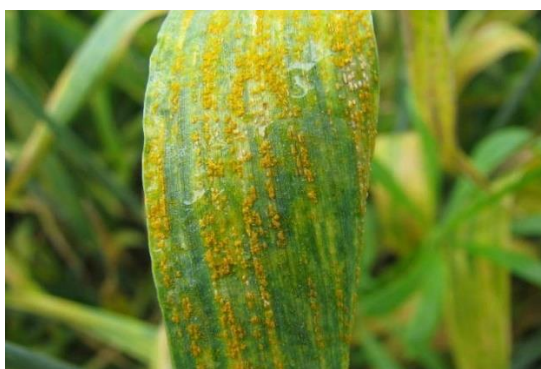
Slika 8. Žuta ili crtičava hrđa

Uzročnik je Puccinia striiformis (slika 8) koja je poznata u čak više od 60 zemalja u svijetu. Bolest se najčešće javlja u vlažnijim i hladnijim područjima, iako je u današnje vrijeme sve češće ima i u toplijim područjima, gdje su manje količine oborina. U Hrvatskoj se već pojavljivala, ali nije činila značajne štete. Simptomi se najčešće mogu uočiti na plojci listova i na pljevama, iako može zaraziti sve zelene dijelove pšenice. Uočavamo žute pjege koje su sačinjene od uredosorusa koji se nalaze u nizovima, koji izgledaju kao crtice na listu. Optimalni uvjeti su temperature od 10 – 15 °C i visoka vlažnost zraka. U punom cvjetanju dolazi do zaraze zrna, kada uredospore padaju na cvjetove i prokliju.