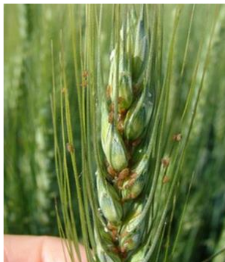
Slika 4. Lisne uši

Lisne uši (slika 4) su poznati štetnici koji se mogu naći na različitim kulturama. Govoreći o lisnim ušima na pšenici, poznato je desetak vrsta, a neke od njih su: Sitobion avenae , Schizaphis graminum , Metopolophium dirhodum , Rhopalosiphum padi i dr. Lisne uši čine direktne štete sisanjem biljnih sokova na klasu ili listu, te tako izazivaju smanjenje prinosa. Štete mogu praviti i indirektno, prenoseći viruse s biljke na biljku ( https://www.savjetodavna.hr ).