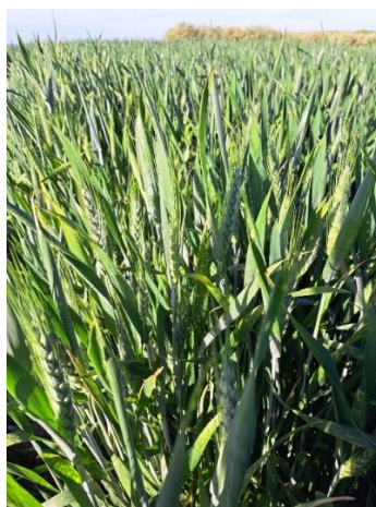
Slika 12. Prikaz pšenice na obrtu

Na obrtu se pšenica (slika 12) uzgaja već dugi niz godina, uz praćenje svih povoljnih uvjeta za njezin razvoj i poštivanje plodoreda, koji ima važnu ulogu u poljoprivrednoj proizvodnji. Do sada na obrtu nije bilo problema s bolestima i zarazama pšenice u tolikoj mjeri da je došlo do opadanja kvalitete i prinosa zrna. U 2023. godini na obrtu su sijane dvije sorte pšenice na 22 ha, Sofru i Gabrio, koje su se pokazale dosta kvalitetnim i dobrim sortama, s obzirom na urod, jačinu otpornosti na štetnike i bolesti i sl.