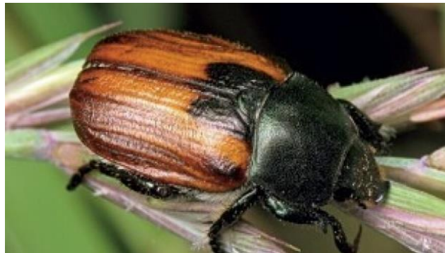
Slika 3. Žitni pivac

Kod nas nema registriranih sredstava za suzbijanje žitnog pivca ( https://www.agroklub.com/ratarstvo/zitni-pivci/5358/ ).