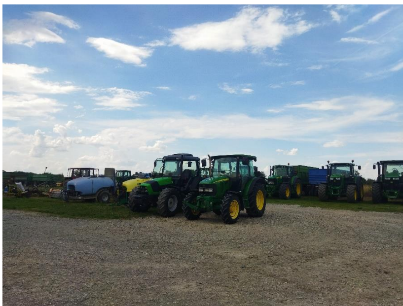
Slika 11. Dio mehanizacije u posjedu obrta

Ono što na obrtu omogućuje bavljenje poljoprivrednom proizvodnjom je umjerena kontinentalna klima, sa povoljnim rasporedom oborina, ilovasta tla koja su poznata po svojoj kvalitetnoj strukturi jer uglavnom sadrže više hranjivih tvari nego pjeskovita i glinena tla, te imaju dobra svojstva zadržavanja vode u optimalnim količinama. Temperature su povoljne za uzgoj navedenih kultura, iako su ljeta sve toplija, a sazrijevanje nekih plodova je bilo i do mjesec dana ranije, nego što je očekivano. Također, poznato je da su potrebna posebna