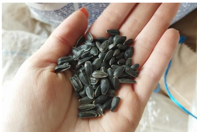
Slika 14. Sjeme suncokreta sorte Sumiko

Na obrtu Matanovac u 2023. godini sijane su dvije sorte suncokreta, Sumiko HTS i SY Bacardi CLP. Sumiko HTS (slika 14 i slika 15) je vrhunski hibrid, kojeg u ponudi ima Syngenta. Sjeme ove sorte suncokreta sadrži značajne količine ulja, a s obzirom da je suncokret važna uljarica, proizvodnja je isplativa. Osim što sjeme sadrži veće količine ulja, sama biljka suncokreta je dosta čvrsta, otporna na polijeganje, podnosi sve tipove tla, a može se sijati i u kasnijim rokovima sjetve, ako to uvjeti dozvoljavaju. Uz pravilnu njegu i održavanje ovog usjeva, može se ostvariti visoki prinos.