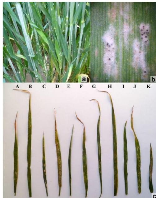
Slika 5. Pepelnica na pšenici

nakon nekog vremena postaju crne boje, oni sadrže askuse i askospore koje imaju ulogu u preživljavanju nepovoljnih uvjeta. Ono što pogoduje širenju askospora su hladnije i kišovito vrijeme. Napadnuti listovi i pljevice postaju klorotični, djelomično ili potpuno odumiru što značajno smanjuje asimilacijsku površinu i povećava respiraciju, a što u konačnici negativno utječe na sve komponente prinosa ( https://www.agroklub.com/ratarstvo/pepelnica ).