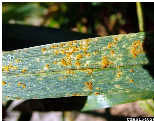
Slika 9. Lisna hrđa pšenice