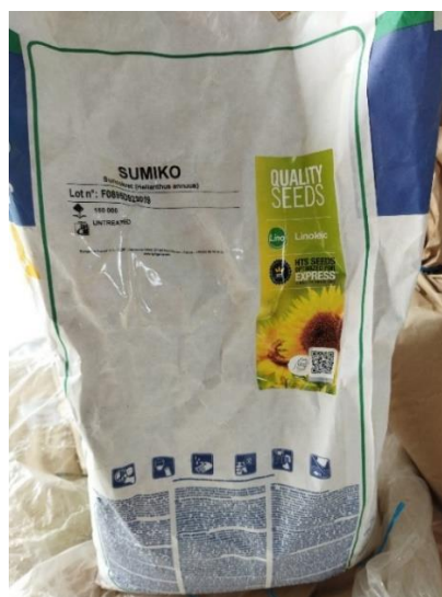
Slika 15. Sumiko sorta