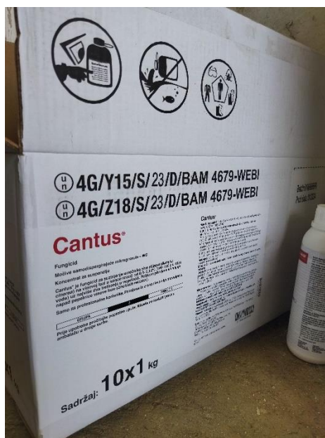
Slika 16. Fungicid Cantus

Collis je kombinirani preventivni fungicid sistemičnog djelovanja, koji sadrži dvije aktivne tvari (krezoksim-metil i boskalid) koje se međusobno nadopunjuju u suzbijanju pepelnice, čime se osigurava sigurna zaštita. Collis (slika 17) je primijenjen 3 puta u vegetaciji u razmacima 10 – 14 dana, a doza je bila 0,3 – 0,4 l/ha.