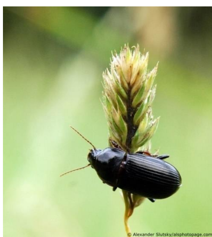
Slika 2. Žitarac crni

Žitarac crni je važan štetnik na parcelama gdje se uzgoj žitarica ponavlja kroz nekoliko godina. Predstavlja jedinu štetnu vrstu trčka. Odrasli oblici su crne boje (slika 2), a ličinke su blijedožute boje i prave veće štete nego odrasli kukac. Odrasli se u vrijeme voštane i mliječne zriobe hrane zrnom, ali pri tome ne nastaju veće štete (Maceljčki i Igrc, 1991.). Često i pregrizaju vlat ispod klasa pa se na tlu hrane zrnom pšenice. Ličinka štete prave tijekom listopada i studenog, kada se hrani vršnim dijelovima lista. Noću pojedu mekane dijelove, a žilice ostaju i kovrčaju se. Ličinke mogu vršni dio lista uvući u tlo i tako se hraniti ( https://agrobasesapp.com ).