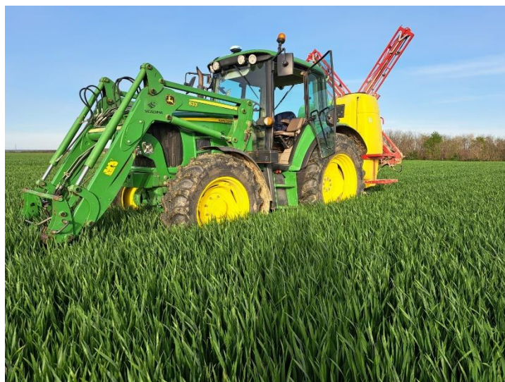
Slika 13. Zaštita pšenice

Prosaro 250 EC je fungicid koji je također vrlo kvalitetan i snažan u zaštiti pšenice od pepelnice, smeđe pjegavosti lista i smeđe hrđe. Dvije aktivne tvari koje sadrži su protiokonazol i tebukonazol. Primijenjena je jedna doza sredstva u fazi vlatanja (1 l/ha) tijekom 2023. godine na obrtu Matanovac.