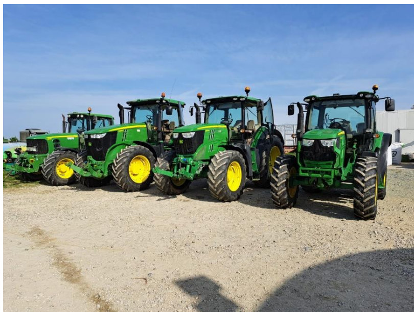
Slika 10. Dio traktora u posjedu obrta