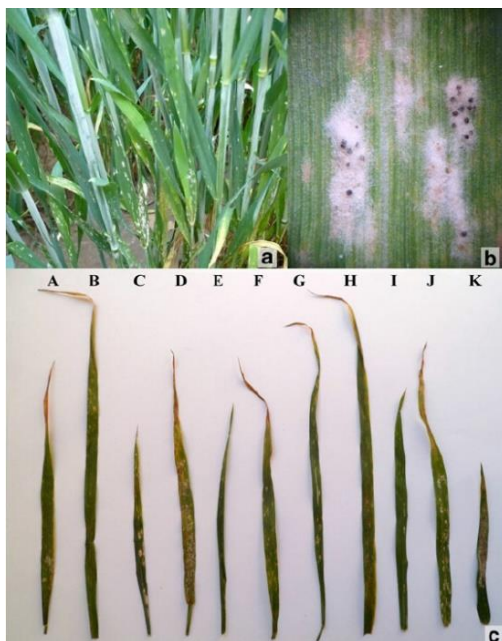
Slika 5. Pepelnica na pšenici

nakon nekog vremena postaju crne boje, oni sadrže askuse i askospore koje imaju ulogu u preživljavanju nepovoljnih uvjeta. Ono što pogoduje širenju askospora su hladnije i kišovito vrijeme. Napadnuti listovi i pljevice postaju klorotični, djelomično ili potpuno odumiru što značajno smanjuje asimilacijsku površinu i povećava respiraciju, a što u konačnici negativno utječe na sve komponente prinosa ( https://www.agroklub.com/ratarstvo/pepelnica ).