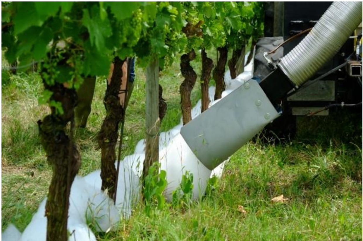
Slika 10. Ekološka kontrola korova zagrijanom pjenom

Vrlo učinkovita metoda koja je patentirana je uništavanje korova primjenom zagrijane pjene. Danas već imamo i patentirani uređaj koji na korov nabacuje biorazgradivu zagrijanu pjenu bez koja je bez štetnih kemijskih spojeva, i to je vrlo dobra alternativa za sve proizvođače koji se bave ekološkom proizvodnjom (www.tecnovict.com, 2024). Pjena se zagrijava na 70 °C, te se postepeno hladi i uništava korov. Uređaj je posebno pogodan za ekološke vinograde (Slika 10.)