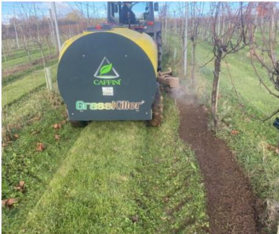
Slika 11. Ekološka kontrola korova zagrijanom pjenom

Ova metoda bazira se na principu korištenja mlaza vode pod vrlo visokim pritiscima, koji dostižu i do 1000 bara. Uređaj koristi pumpu pogonjenu preko priključnog vratila traktora, a voda pod tlakom dolazi do mlaznica koje su postavljene ispod rotirajućih glava, koje imaju mogućnost bočnog pomaka, pa je radno tijelo u mogućnosti da zaobiđe stablo ili trs. Ovaj uređaj je izuzetno učinkovit u kontroli korova u vinogradima i voćnjacima (Slika 11.).