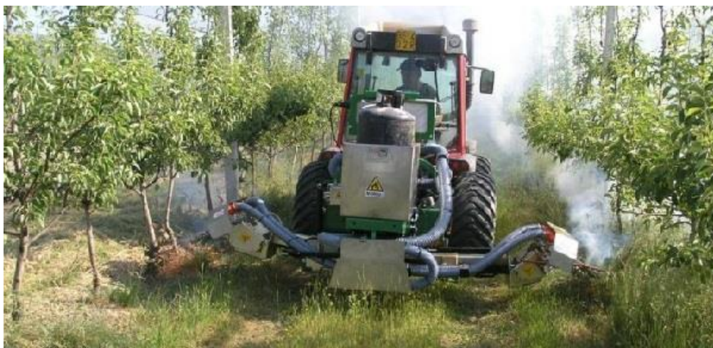
Slika 9. Uništavanje korova plamenom

Prema Mia i sur. (2020.) moderna tehnologija značajno je unaprijedila učinkovitost propanskih plamenika kao učinkovite alternativne metode suzbijanja korova u voćnjaku i vinogradu. Prema Wei i sur. (2010.) ovaj sustav zahtijeva jedan ili više metalnih plamenika koja se usmjeravaju na zakorovljenu površinu unutar reda (Slika 9. ). U ovom načinu kontrole korova održava se temperatura na površini korova između 60 °C pa do 70 °C korištenjem propanskog plamena koji se uz pomoć specijalne opreme zagrijava korov do njegove degradacije. Bond i Grundy (2021.) tvrde da je za optimalan učinak potrebno održavati kut između plamenika i korova od 22,5° do 45,0°, a korove bi trebalo spaliti dok ne prijeđu visinu od 5 cm. Najlakše je uništiti na ovaj način širokolisne korove, dok je uskolisne travne korove nešto teže uništiti. Potreban je i češći broj prohoda jer se korov relativno brzo regenerira.