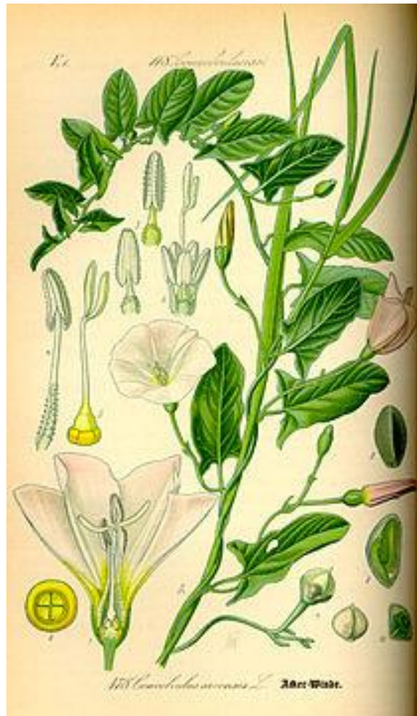
Slika 2. Poljski slak

Slak (Slika 2,) je višegodišnji korov kojega je izuzetno teško suzbiti te se redovno pojavljuje u vinogradima i voćnjacima naših krajeva. Ova biljka ima spratolik korijenov sustav koji ide u dubinu do šest metara, što čini problem kod suzbijanja. Prepoznaje se po srcolikim listovima i bijelom-trubastom cvijetu.