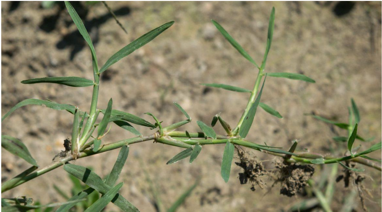
Slika 3. Pirika

Pirika (Slika 3.), je višegodišnja biljka iz porodice trava (Poaceae). Vlati su uspravne i čvrste, naraste do 150 cm visine. Podanak je puzajuć, bijeli, dubok do 20 cm no vrlo dug. Dužina podanka na jednom hektaru može iznositi i do 5000 km, a na 1 m 2 mogu se naći podzemni organi čija je težina oko 3 kg ( www.plantea.com.hr , 2024.). Listovi su dugački, uski i plosnati, ušiljenog vrha, na licu su hrapavi. Lisni rukavci su goli ili češće dlakavi. Cvjeta od svibnja do kolovoza cvjetovima skupljenima u oko 10 cm dugačkim klasovima. Klas se sastoji od 7-36 klasića jajastog oblika od kojih svaki sadrži 3-5 cvjetova. Plod je dlakavo pšeno. Biljka proizvede do 1000 pšena godišnje a zadržava klijavost do 4 godine. ( www.plantea.com.hr , 2024.). Jako je invazivna korovska vrsta koja se teško iskorijenjuje a širi se uz pomoć rizoma.