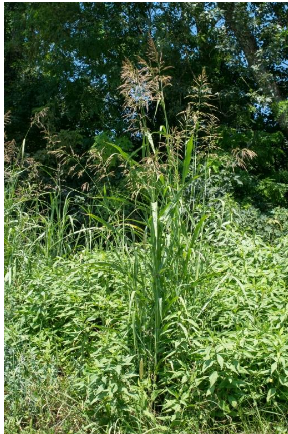
Slika 4. Divlji sirak

Višegodišnja zeljasta biljka iz porodice trava ( Slika 4.). Stabljika je uspravna i glatka, može narasti i do 2 metra visine. Podanak je jak, horizontalan, puzajuć s brojnim bijelim vriježama. Raste i snažnije nego nadzemni dio biljke. U jednoj sezoni može narasti i do 90 metara u duljinu a na jednom hektaru moglo bi ga se skupiti do tri tone. Listovi su plosnati, glatki, hrapavih rubova, dugi oko 50 cm, široki 1-2 cm i s izraženom bijelom ili blijedozelenom glavnom žilom u sredini. Rukavci su glatki. Cvjetovi su skupljeni u razgranate metličaste cvatove na vrhovima stabljika, piramidalnog su oblika, veliki do 30 cm, sastavljeni od nekoliko grana smještenima u pršljenove. Klasići su dvospolni. Cvate od lipnja do rujna. Plod je pšeno, a jedna biljka u sezoni proizvede do 1800 sjemenki. ( www.plantea.com.hr/piramidalni-sirak , 2024.).