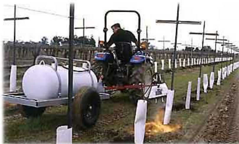
Slika 7. Spaljivanje korova unutar redova

Metoda uništavanja korova spaljivanjem (Slika 7.) uz korištenje plina propana jako je učinkovita metoda kontrole korova, osobito uz samu provodnicu voćke ili čokota. Ova metoda je i relativno jeftina u usporedbi sa drugim načinima suzbijanja korova. Na ovaj način možemo se učinkovito riješiti i glodavaca unutar redova, te smanjiti štete na korijenovom sustavu. Negativne strane ovakvog načina kontrole korova mogu biti oštećenja čokota ili debla uslijed nestručnog rukovanja, te moguće oštećenje sistema za navodnjavanje kap po kap.