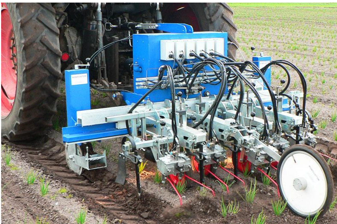
Slika 12. Robovator u povrćarskoj proizvodnji ( Izvor: https://www.visionweeding.com/robovator-mechanical/ )

Danas na tržištu imamo u ponudi nekoliko sistema robotske kontrole korova, a prema Peruzzi i sur. (2017.), sistem nazvan „Robovator“ bio je jedan od najučinkovitijih i prikladan za ekološki uzgoj te unutar redno suzbijanje korova (Slika.12). On reže korov na dubini tla od 1-2 cm pomoću par zubaca, gdje svaki zub ima ravnu oštricu nalik nožu.