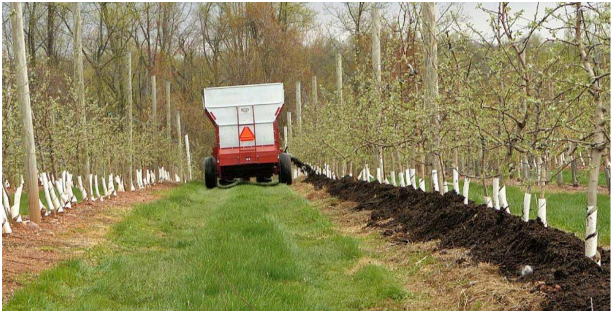
Slika 8. Korištenje organskog malča unutar redova

Korištenjem inertnog malča (Slika 8.) unutar redova postižemo dobar porast stabala i čokota, te odlične prinose. Kao materijal se najčešće koriste: slama, sijeno, drvena sječka, papir, tkanina, pa čak i kamenje. Izbor materijala ima do nekog stupnja utjecaj na performanse stabala i čokota, budući da različito utječu na okolinske faktore temperature i vlage. Malč ima pozitivnog utjecaja na mikro i makro faunu u tlu, te pozitivno utječe i na očuvanje strukture tla. Negativnost je da su sirovine relativno ograničene i skupe u odnosu na druge načine borbe protiv korova. Pogoduje razvoju poljskih miševa i voluharica te razvoju Phythophtore, jer se ispod mulcha razvija povećana vlažnost. Općenito materijal koji ima širi odnos C: N je poželjniji, jer traje dulje i manje se razvijaju korovi.