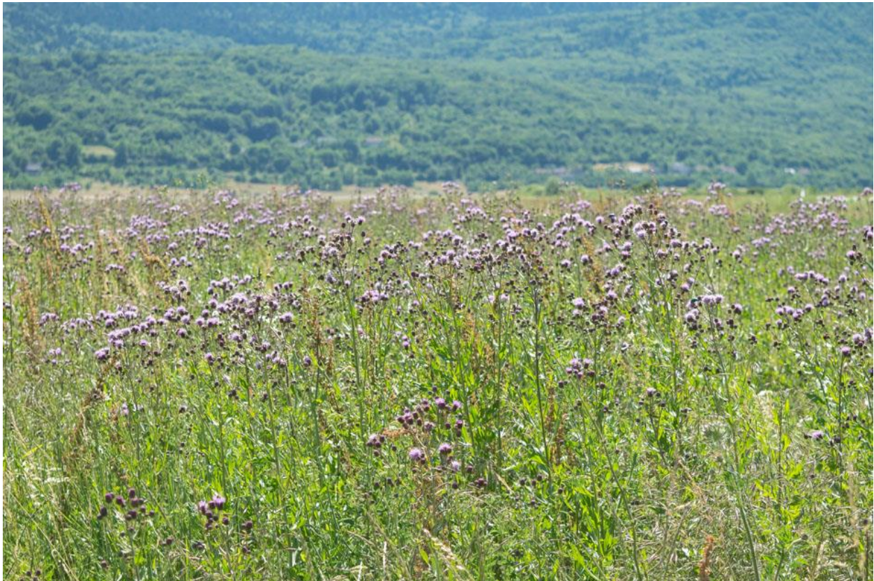
Slika 5. Osjak

Osjak (Slika 5.) je trajna zeljasta biljka iz porodice glavočika (Asteraceae). Stabljika mu je uspravna, bridasta, u gornjem dijelu razgranata, naraste do 2 metra visine. Korijen je jak, ovisno o staništu. Na rahlim oranicama ide u dubinu do 200 cm, na teškim zemljištima korijen je obično plitak. Listovi su naizmjenični, lancetasti, cjeloviti, na licu goli, naličje je sivo pustenasto, donji se nalaze na kratkim peteljicama a gornji su sjedeći i obuhvaćaju stabljiku, perasto su urezani i prekriveni su mnogobrojnim bodljama. Dvodomna je biljka. Cvjetovi su tamnoljubičaste boje, skupljeni u oko 1,5-2 cm velike glavice su pojedinačne ili po 2-3 čine cvat. Ovojni listići na cvjetovima smješteni su poput crijepa na krovu. Cvate od lipnja do rujna. Plod je plosnata i glatka roška s bijelim papusom dužine do 3 cm. U prosjeku biljka proizvede 4000-5000 sjemenki, no može ih dati i do 40 000, a zadržavaju klijavost i preko 6 godina ( www.plantea.com.hr/poljski-osjak , 2024).