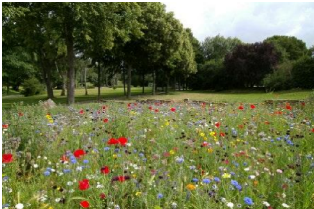
Slika 4. Livadna paša