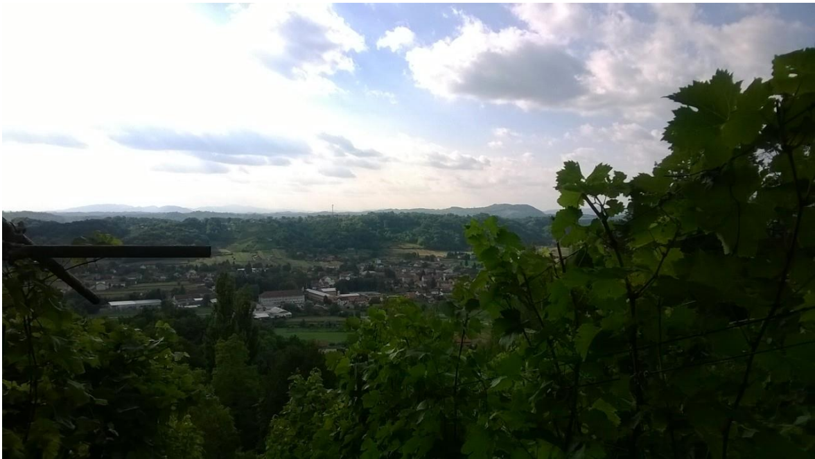
Slika 1. Hrvatsko zagorje, Zlatar

Rijeka Drava predstavlja granicu između Hrvatskog zagorja i Međimurja. Kalnik predstavlja granicu prema Podravini, a djelomično i Prigorju. (Wikipedija, 2014.)