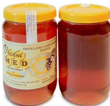
Slika 12. Med od kestena

Karakterističnog je intenzivnog mirisa i pomalo gorkastog okusa. Najljekovitiji je med za probleme s kompletnim probavnim traktom i srčano-žilnim sustavom. Također pogoduje jetri, slezeni, žuči (pogotovo nakon operacije žuči).