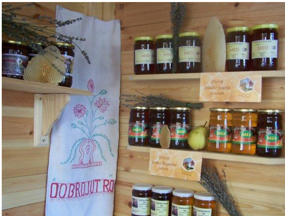
Slika 5. Seoski turizam Crnko – prodaja pčelinjih proizvoda

Kulturne znamenitosti na trasi Slatkog puta su u sklopu Seoskog turizma Crnko gdje posjetitelji mogu razgledati dvije autentične seoske kuće i zbirku predmeta iz prošlosti ovog ruralnog područja (narodne nošnje, plugovi, preše i drugi predmeti svakodnevne upotrebe) te župnu crkvu Sv. Elizabete u Jalžabetu, mjesnu crkvu u Kelemenu i pil Sv. Benedikta u Vukovcu. ( www.slatki-put.com , 2014.)