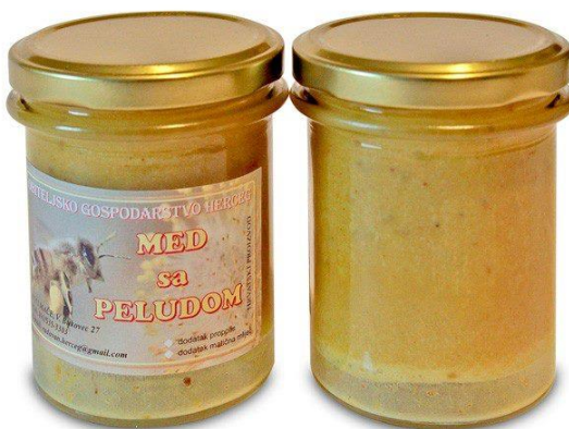
Slika 16. Med sa peludom i propolisom

Koristan je za podizanje imuniteta, gastritis, čir na želucu, slabokrvnost, protiv stresa, za jetru, za skidanje kolesterola. Pravilno se konzumira 1-3 žličice dnevno otopljene u ustima. Jedna žličica za djecu od 1 godine starosti, do 3 žličice za odrasle osobe.