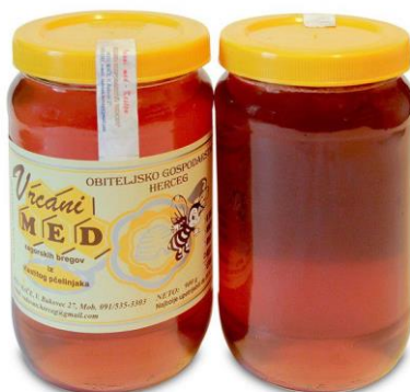
Slika 12. Med od kestena

Karakterističnog je intenzivnog mirisa i pomalo gorkastog okusa. Najljekovitiji je med za probleme s kompletnim probavnim traktom i srčano-žilnim sustavom. Također pogoduje jetri, slezeni, žuči (pogotovo nakon operacije žuči).