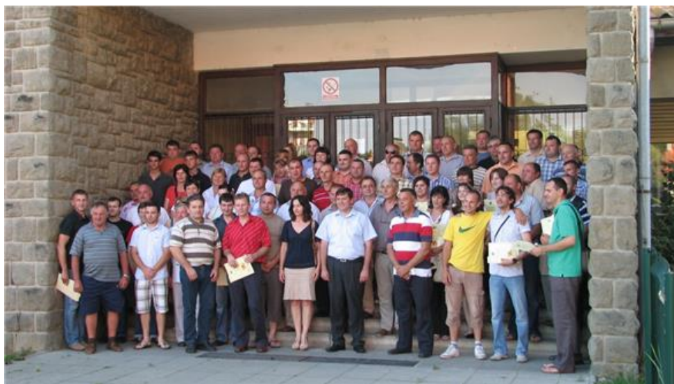
Slika 9. Budući pčelari

Tijekom teorijskog i praktičnog dijela edukacije u trajanju od 120 sati, polaznici – njih čak 84 - su osposobljeni za stručnu i sigurnu upotrebu pribora koji se koristi u pčelarstvu, održavanje pčelinjaka, obrađivanje pčelinjih proizvoda te provođenja zaštitnih mjera u pčelinjaku. Cilj edukacije bio je ojačati znanja i vještine polaznika iz područja pčelarstva kako bi postali konkurentniji na tržištu.