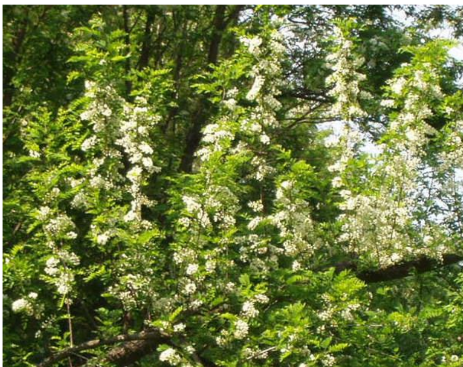
Slika 6. Paša za pčele: bagrem u proljeće

Posebna priča o tome medu počinje 2010. kada na Svjetskom natjecanju u Semiču u Sloveniji Ivan Kožić iz Udruge Nektar u Konjščini postaje njime šampion odnosno apsolutni pobjednik. Također u Sloveniji u listopadu 2011. Vinko Ferenčić također iz Udruge Nektar iz Konjščine na 13. međunarodnom ocjenjivanju meda ponovno je imao najbolje ocijenjen bagremov med.