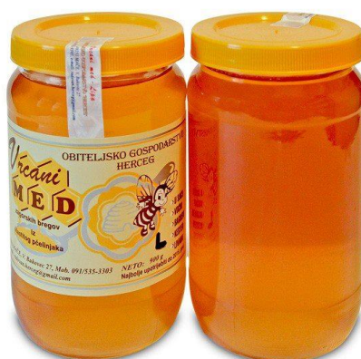
Slika 13. Med od lipe

S obzirom na činjenicu da lipov med potiče znojenje, njegovo korištenje se preporuča kod prehlada i gripa, kao i za eliminaciju toksina iz organizma. Lipov med se preporuča kod upala dišnih i probavnih organa. Pospješuje metabolizam, blagog je okusa te mirisom podsjeća na čaj od lipe.