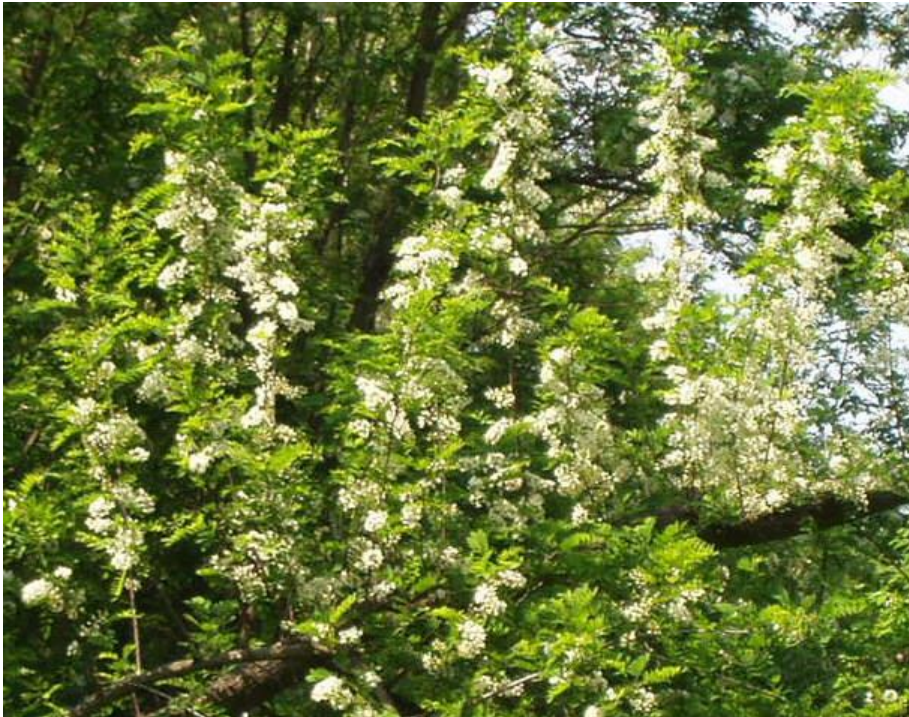
Slika 6. Paša za pčele: bagrem u proljeće

Posebna priča o tome medu počinje 2010. kada na Svjetskom natjecanju u Semiču u Sloveniji Ivan Kožić iz Udruge Nektar u Konjščini postaje njime šampion odnosno apsolutni pobjednik. Također u Sloveniji u listopadu 2011. Vinko Ferenčić također iz Udruge Nektar iz Konjščine na 13. međunarodnom ocjenjivanju meda ponovno je imao najbolje ocijenjen bagremov med.