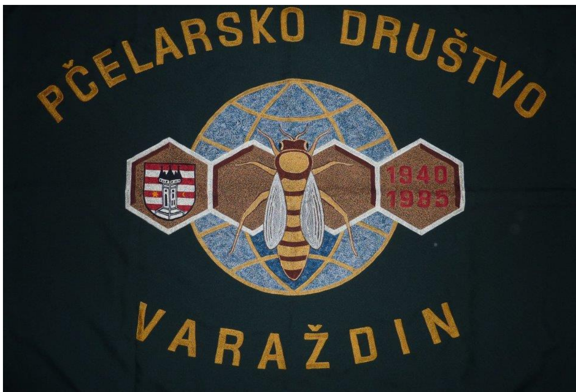
Slika 2. Zastava Pčelarskog društva Varaždin