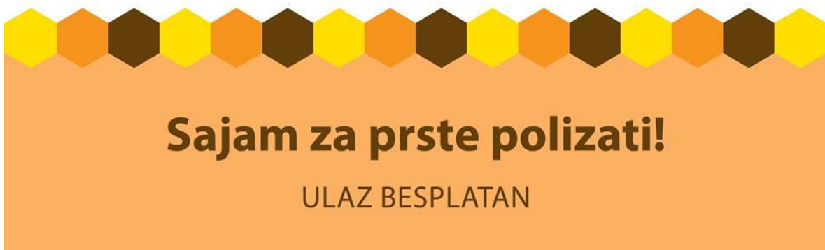
Slika 3. Plakat za sajam Sivka

24.-26.10.2014., Varaždin dvorana Graberje