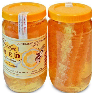
Slika 11. Bagremov med sa saćem

Saće je pčelama kuća ili dom. Pčele u njega pohranjuju svoju hranu – med, cvjetni prah i propolis. Zato je med u saću najoriginalniji med jer nije vrcan. Onako kako ga pčele napune i naprave mi ga samo izrežemo na komade i upakiramo u tegle te zalijemo bagremovim medom.