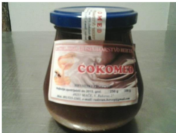
Slika 15. Čokomed

Spoj dva božanska okusa meda i čokolade neće Vas ostaviti ravnodušnima. Sastojci: med od bagrema i čokolada kakaovac (15-20%).