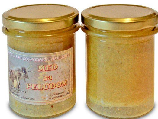
Slika 16. Med sa peludom i propolisom

Koristan je za podizanje imuniteta, gastritis, čir na želucu, slabokrvnost, protiv stresa, za jetru, za skidanje kolesterola. Pravilno se konzumira 1-3 žličice dnevno otopljene u ustima. Jedna žličica za djecu od 1 godine starosti, do 3 žličice za odrasle osobe.