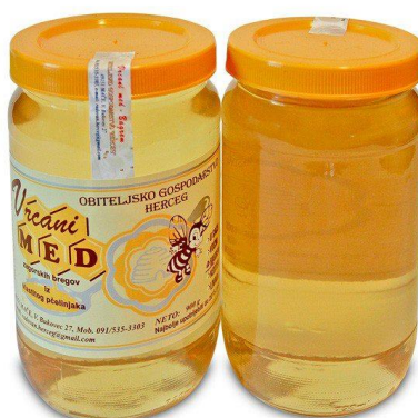
Slika 14. Med od bagrema

Najblažeg je mirisa i okusa, lagan za želudac i stoga ga uvijek preporučamo za malu djecu, ali i dijabetičarima (ima najveći postotak fruktoze). Dobar je za dišne puteve, smirenje i najbolji je za zasladiti čaj.