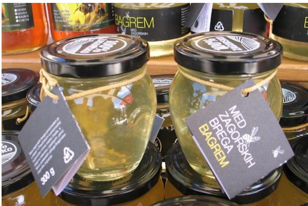
Slika 8. Bagremov med

povoljno utječe na živčani sustav, pomaže pri nesanicima i ublažava stres, poboljšava ishranu staničja, normalizira oksidaciju i detoksikaciju organizma, pospješuje ionizaciju, organizmu osigurava kalij i natrij