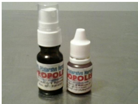
Slika 17. Propolis kapi

Propolis je najjači prirodni antibiotik i antioksidans. Propolis djeluje na bakterije, viruse, gljivice i parazite tako da ih uništava ili sprječava njihov rast i razvoj. Veže slobodne radikale u organizmu. Izvrstan za imunitet u svako doba godine.