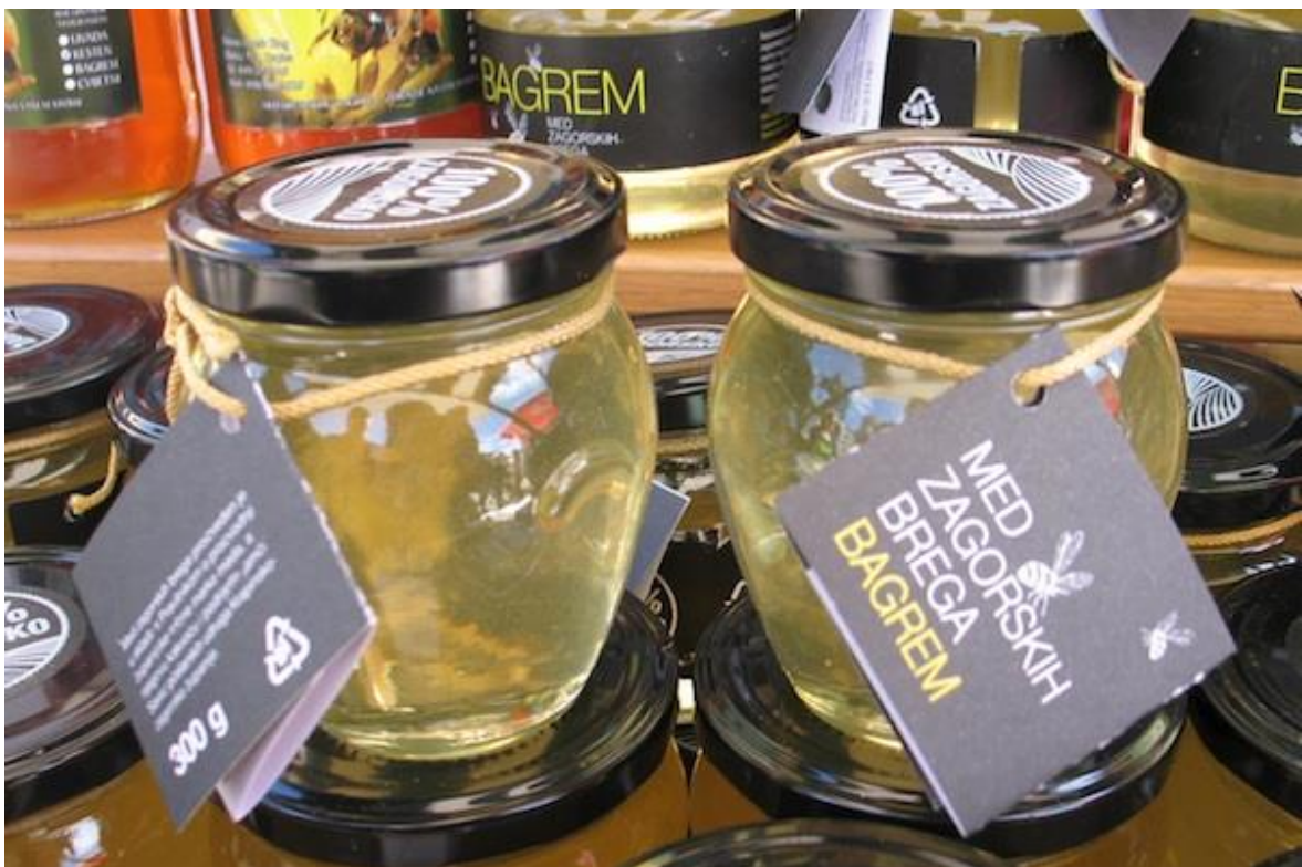
Slika 8. Bagremov med

povoljno utječe na živčani sustav, pomaže pri nesanicima i ublažava stres, poboljšava ishranu staničja, normalizira oksidaciju i detoksikaciju organizma, pospješuje ionizaciju, organizmu osigurava kalij i natrij