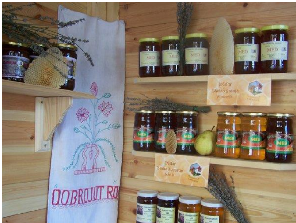
Slika 5. Seoski turizam Crnko – prodaja pčelinjih proizvoda

Kulturne znamenitosti na trasi Slatkog puta su u sklopu Seoskog turizma Crnko gdje posjetitelji mogu razgledati dvije autentične seoske kuće i zbirku predmeta iz prošlosti ovog ruralnog područja (narodne nošnje, plugovi, preše i drugi predmeti svakodnevne upotrebe) te župnu crkvu Sv. Elizabete u Jalžabetu, mjesnu crkvu u Kelemenu i pil Sv. Benedikta u Vukovcu. ( www.slatki-put.com , 2014.)