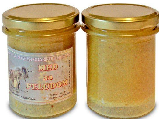
Slika 16. Med sa peludom i propolisom

Koristan je za podizanje imuniteta, gastritis, čir na želucu, slabokrvnost, protiv stresa, za jetru, za skidanje kolesterola. Pravilno se konzumira 1-3 žličice dnevno otopljene u ustima. Jedna žličica za djecu od 1 godine starosti, do 3 žličice za odrasle osobe.