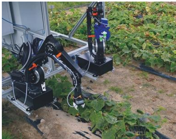
Slika 3. Robot za berbu krastavaca

CATCH istraživači žele razviti i testirati robotski sustav s dva kraka koji se sastoji od jeftinih i laganih modula. Krajnji cilj: ovaj sustav može se koristiti za automatizirani uzgoj krastavca i druge poljoprivredne aplikacije. Robotski berač za skupljanje bi trebao biti ekonomičan, visokih performansi i pouzdan. Čak i u nepovoljnim vremenskim uvjetima, on bi trebao biti u stanju prepoznati zrele krastavce, nježno ih ubrati s dvije hvataljke te ih pohraniti ( https://gospodarski.hr/rubrike/mehanizacija/roboti-za-berbu-krastavaca/ )