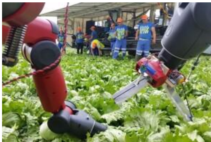
Slika 4. Ubranje zelene salate