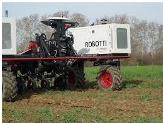
Slika 9. Robot za berbu bundeva

Povrh toga, pripremu tla za sjetvu bundeva mogu obavljati i roboti. ( https://www.ducksize.com/robots-for-pumpkins?Category=Weeding )