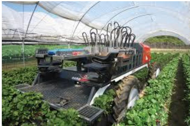
Slika 11. Agrobot harvester

Analizirajući dva slijedeća proizvoda: Agrobot SW6010 i AGSHydro. Proizvodi ih poduzeće: Agrobot, Huelva, Španjolska. Nadalje, analiziraju se cijena, dostupnost i funkcija Agrobot SW6010 i AGSHydro, s tim da su izgled i funkcija Agrobot harvester prikazana na slici 11., dok je na slici 12. prikazan sustav hidroponskog uzgoja uz pomoć Agrobota (Knežević, 2023.).