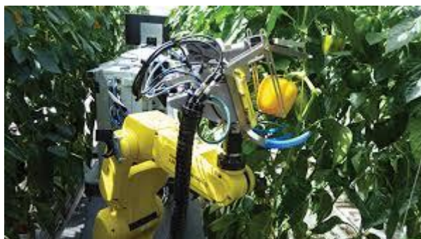
Slika 2. Robot za berbu paprike