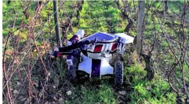
Slika 13. Wall-Ye 1000 Pruning Robot

Proizvodi Agrobot SW6010 i AGSHydro koriste se za berbu jagoda. Robot je korišten za berbu jagoda u Oxnardu, Kaliforniji, u 2020. godini. Radilo se ispitivanje odnosno završno testiranje berbe jagoda u siječnju 2019. godine. Planira se provesti sezonsko testiranje u sljedećim godinama, počevši od 2020. godine. U nastavku slijedi analiza robota Wall-Ye 1000 koji se koristi vinogradima s ciljem obrezivanje vinove loze. Poduzeće za proizvodnju robota Wall-Ye 1000 nalazi se u Maconu, Francuska. Slikovni prikaz robota Wall-Ye 1000, u vinogradima Francuske (Knežević, 2023.).