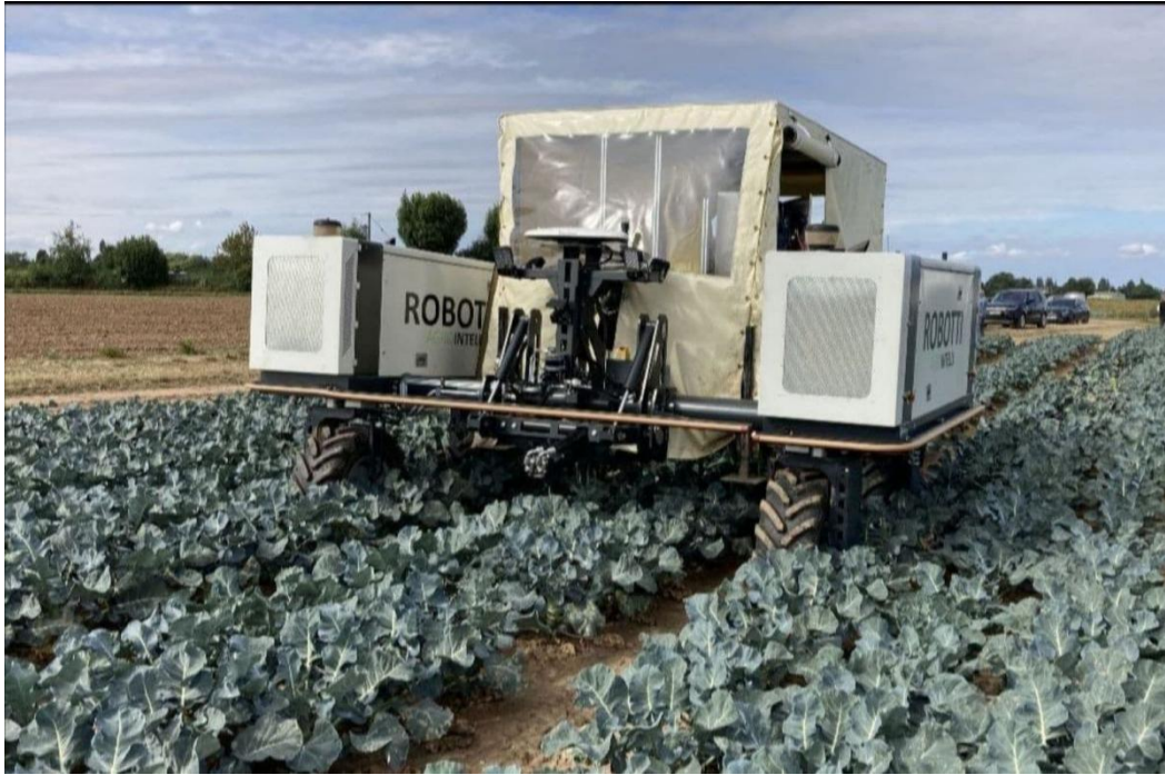
Slika 8. RoboVeg za branje brokula