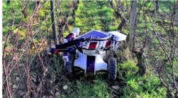
Slika 13. Wall-Ye 1000 Pruning Robot

Proizvodi Agrobot SW6010 i AGSHydro koriste se za berbu jagoda. Robot je korišten za berbu jagoda u Oxnardu, Kaliforniji, u 2020. godini. Radilo se ispitivanje odnosno završno testiranje berbe jagoda u siječnju 2019. godine. Planira se provesti sezonsko testiranje u sljedećim godinama, počevši od 2020. godine. U nastavku slijedi analiza robota Wall-Ye 1000 koji se koristi vinogradima s ciljem obrezivanje vinove loze. Poduzeće za proizvodnju robota Wall-Ye 1000 nalazi se u Maconu, Francuska. Slikovni prikaz robota Wall-Ye 1000, u vinogradima Francuske (Knežević, 2023.).