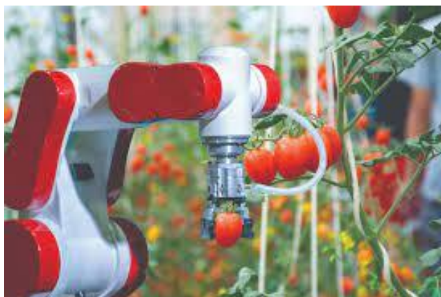
Slika.1 Stroj za berbu rajčica

(Izvor: https://gospodarski.hr/rubrike/mehanizacija/roboti-u-poljoprivredi/ )