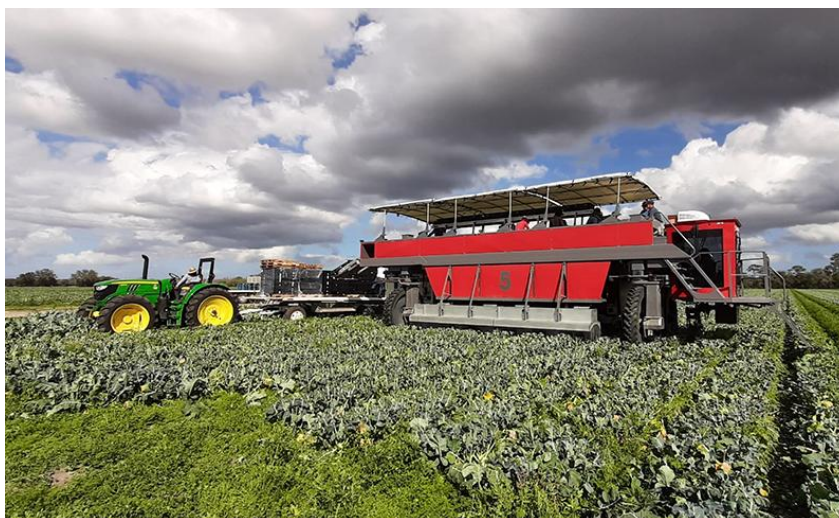
Slika 6. Računalno upravljani kombajn za brokulu