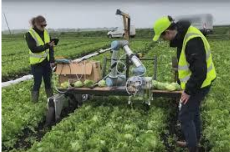
Slika 5. Vegebot