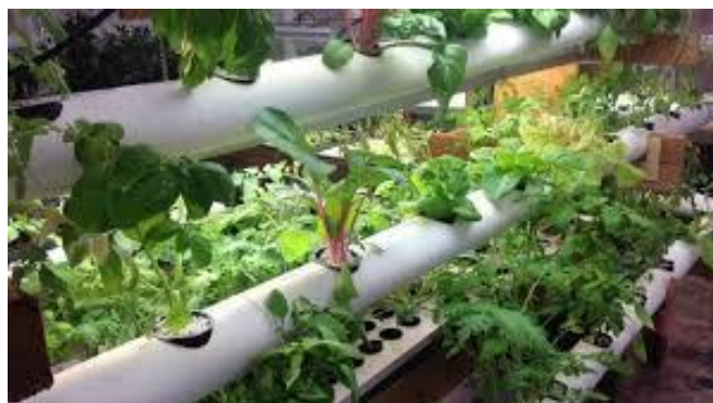
Slika 12. Sustav hidroponskog uzgoja uz pomoć Agrobota