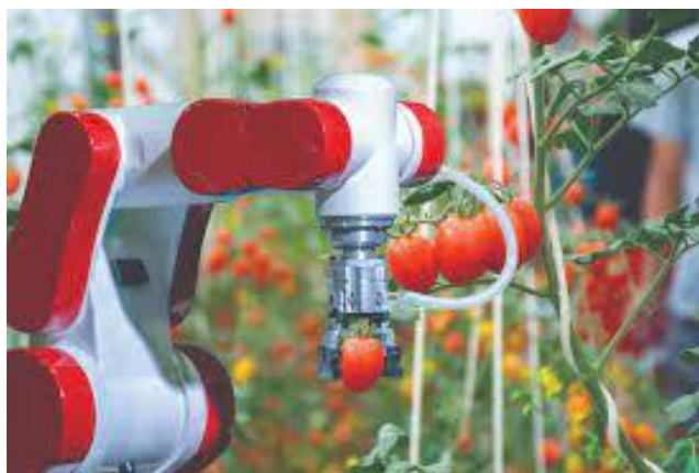
Slika.1 Stroj za berbu rajčica