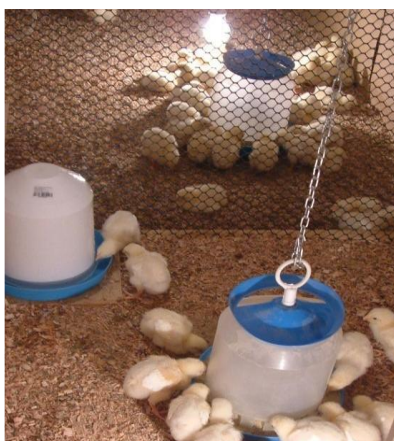
Slika 1. Zvonasta pojilica za perad