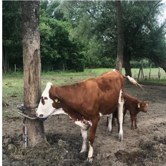
Slika 5. Pojilica na ispustu