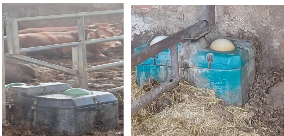
Slika 8. Pojilice s plovkom na farmi tovne junadi