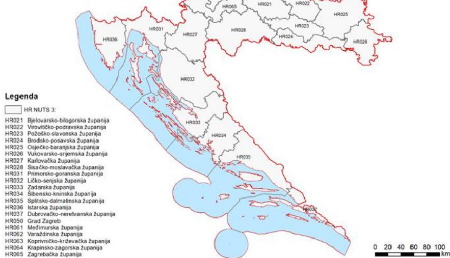
Slika 2. Statističke regije 3. razine