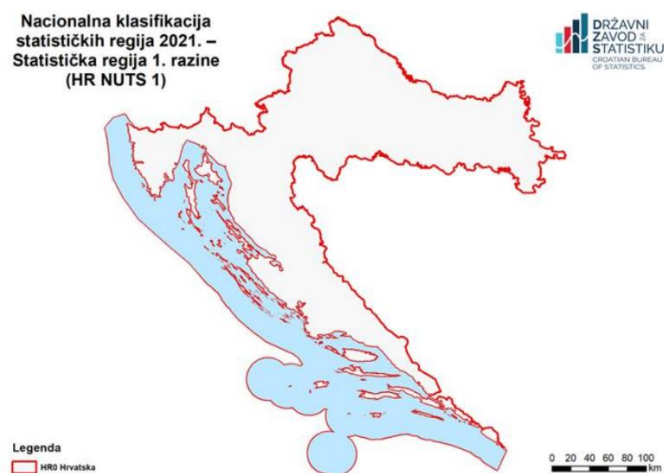
Slika 1. Statistička regija 1. razine