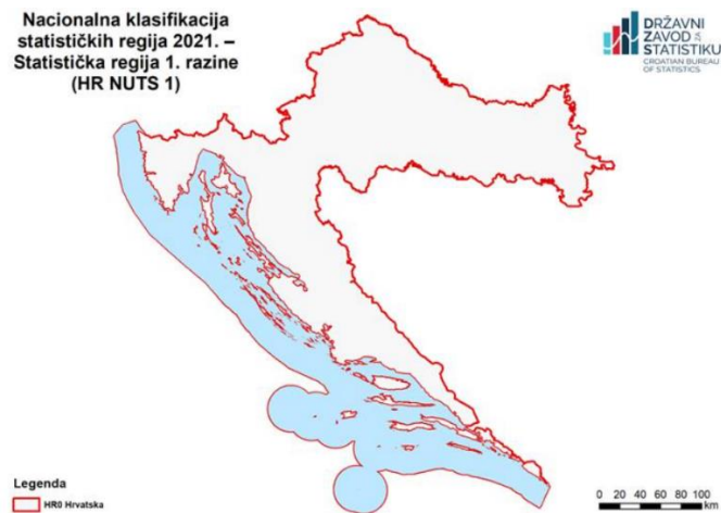
Slika 1. Statistička regija 1. razine