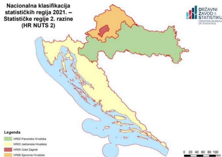
Slika 2. Statističke regije 2. razine