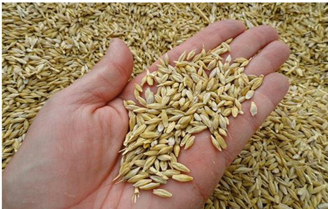
Slika 5. Plod

Ječam može biti ozimi, jari ili prijelazni, s najkraćim vegetacijskim razdobljem među svim žitaricama. Vegetacijski period jarog ječma traje između 55 i 130 dana, dok ozimi ječam traje od 240 do 260 dana, ovisno o kultivaru, vremenu sjetve, klimatskim uvjetima i primijenjenim agrotehničkim mjerama.