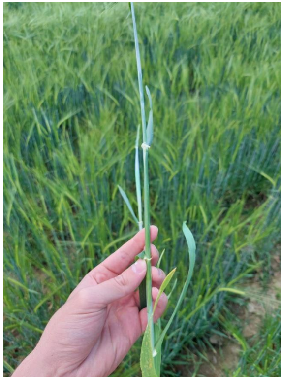
Slika 2. Stabljika

Stabljika ječma manje je otporna na polijeganje u usporedbi s pšenicom zbog manjeg udjela sklerenhimskih stanica. Otpornost različitih sorti na polijeganje ovisi o promjeru vlata, kvaliteti slame, karakteristikama korijenovog sustava, visini biljke, broju listova, sposobnosti listova da zadržavaju vodu te masi i položaju klasa. Bolesti također mogu uzrokovati polijeganje.