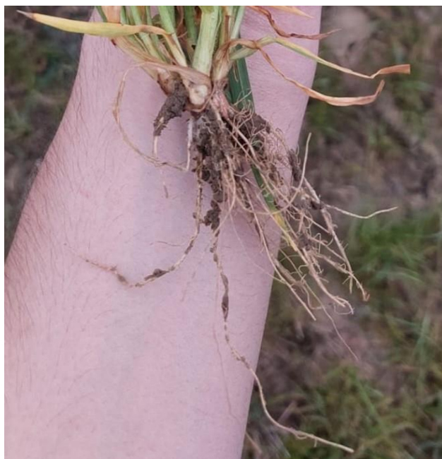
Slika 1. Korijen

Razvoj korijena ovisi o tipu i dubini tla, dostupnosti hranjivih tvari, vodi i vrsti ječma. U dubokim tlima, korijenje može doseći dubinu od 1,8 do 2,1 metra. Primarno korijenje prodire najdublje, dok se sekundarno korijenje razvija u gornjim slojevima tla. Najintenzivniji razvoj korijenovog sustava događa se tijekom cvatnje, nakon čega se njegova masa smanjuje.