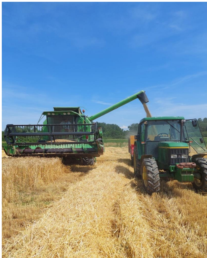
Slika 9. Žetva

Žetva ječma obavljena je 8. lipnja što je nešto ranije nego inače. Žetva se obavila kombajnom marke Deutz Fahr, a transport do silosa obavljen je traktorom marke John Deere i prikolicom Tinaz (Slika 9.).