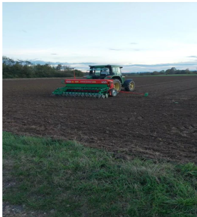
Slika 7. Sjetva

Ova sijačica ima mogućnost i kompjuterskog zatvaranja redova tako da su ostavljeni stalni tragovi na razmaku od 15 m kako mi bila olakšana gnojidba i zaštita usjeva. Pri odabiru sjemena odlučili smo se za sortu Sandra proizvođača RWA koja pripada skupini dvorednih ječmova. Sjetvena norma bila je 220 kg/ha.