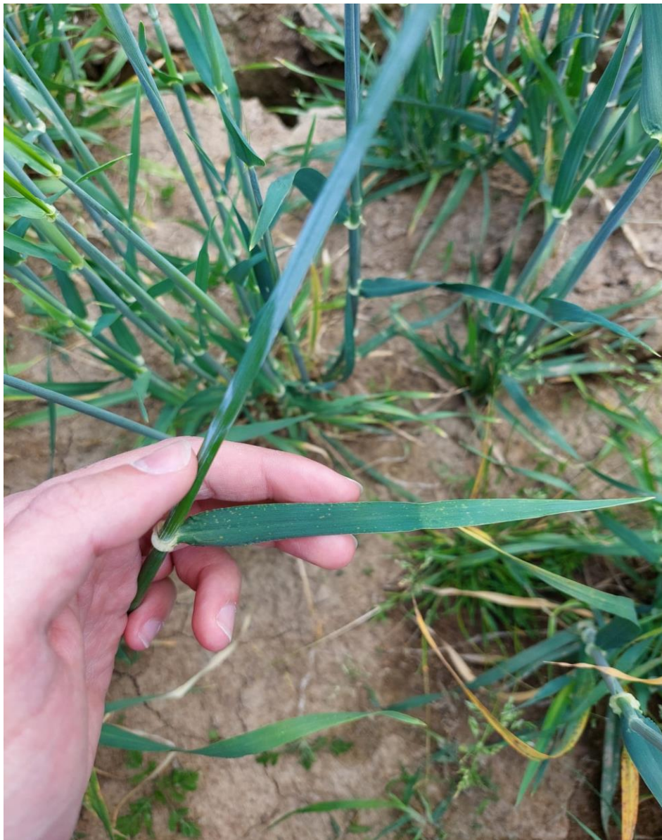
Slika 3. List

Prvi listovi nakon nicanja su široki, sivkasto – zelene boje i imaju voštanu prevlaku. Broj listova po stabljici može varirati od 5 do 10 (Slika 3.). List ječma sastoji se od plojke (lamine), lisnog rukavca (usmine), uški (auriculae) i jezičca (ligule). Na prijelazu lisnog rukavca i plojke ječam ima jako razvijene uške koje obuhvaćaju stabljiku i prelaze jedna preko druge, što je jedna od karakteristika koja ga razlikuje od ostalih žitarica (Kovačević i Rastija, 2014.).