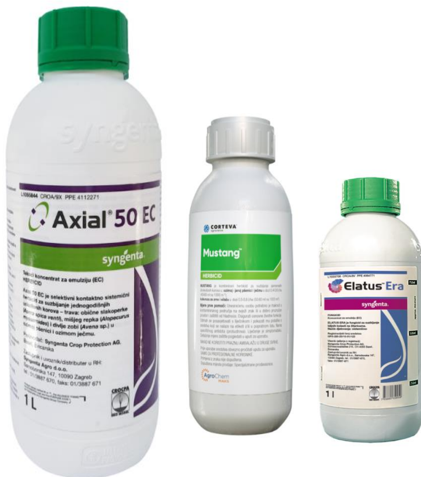
Slika 8. Korištena sredstva

U cjelokupnoj zaštiti korišten je traktor John Deere 6300 i prskalica Tolmet.