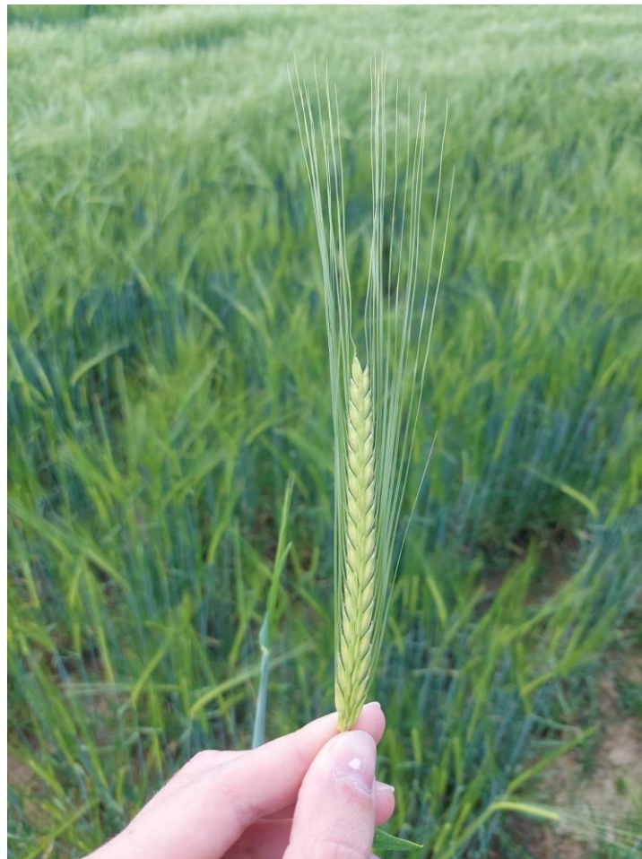
Slika 4. Klas

U zriobi, klas može biti uspravan ili savijen. Cvjetići ječma sastoje se od donje pljevice (obuvenac), gornje pljevice (košuljica), pljevičica (lodicalae), tri prašnika i tučka.