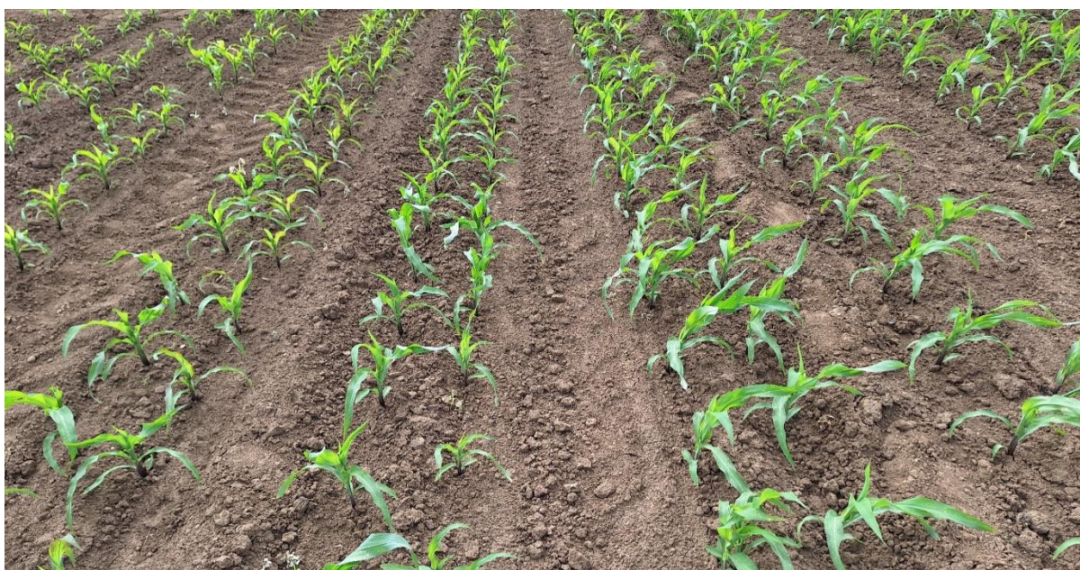
Slika 2. Sjetveni pokus silažnog kukuruza Mikado kod sjetve u udvojene redove

Na Slici 2 prikazan je sklop kukuruza kod sjetve u udvojene redove, a na Slici 3 sklop kukuruza kod standardne sjetve.