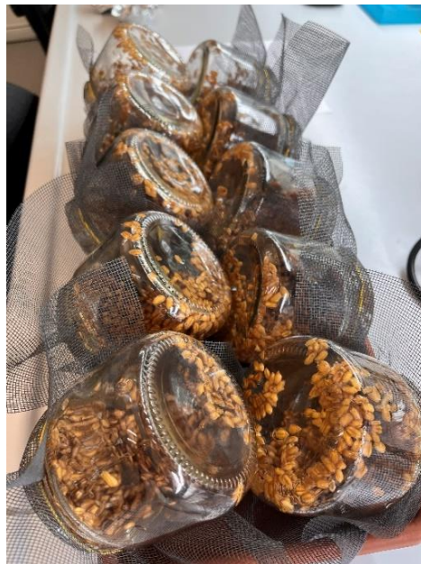
Slika 3. Sjeme pripremljeno za naklijavanje

Nakon koraka naklijavanja slijedila je sjetva. Sjetva je također obavljena u Laboratoriju za biljnu genetiku i biotehnologiju na Fakultetu agrobiotehničkih znanosti u Osijeku. Sjeme je posijano 16. travnja 2024. godine u dva ponavljanja. Veličina posuda korištena za sjetvu bila je 50 cm u dužinu i 20 cm u širinu (Slika 4).