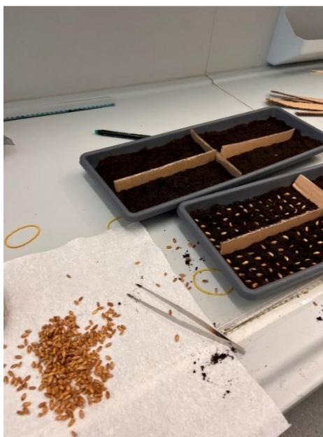
Slika 4. Sjetva sjemena pšenice

Svaka posuda uz pomoć metra podijeljena je na četiri jednaka dijela te je u svaki dio veličine 25 cm x 10 cm posijan je po jedan genotip pšenice, nakon postavljanja sjemena ono je bilo prekriveno tankim slojem supstrata (Slika 5.). Ukupno je posijano 50 zrna po ponavljanju, odnosno 100 sjemenki od svakog genotipa po danu mjerenja. Ukupno je posijano 300 sjemenki svakog genotipa pšenice što bi značilo da je za sva tri dana mjerenja, 6., 8. i 10., ukupno posijano 3000 zrna