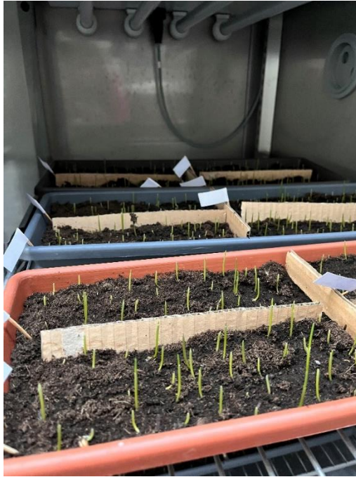
Slika 6. Klijanje sjemena u komori

Posijana pšenica, stavljena je u komoru za uzgoj biljaka. Temperatura u komori je namještena je na 20 °C, dok je svjetlosni režim podrazumijevao kontroliranu izmjenu svjetla koje je trajalo 10 sati i tame koja je trajala 14 sati (Slika 6). Pšenica je zalijevana destiliranom vodom svaki dan s 40 mL po ponavljanju kako bi se održala dostatna količina vlage potrebna za rast izdanaka (Slika 7).