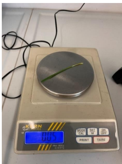
Slika 10. Mjerenje mase izdanaka

Nakon izmjerene duljine izdanaka, svakom izdanku pojedinačno određena je i masa lista. Mjerenje mase lista obavljano je uz pomoć laboratorijske digitalne vage kako bi se dobila prosječna masa svakog izdanaka. Laboratorijska vaga je prije svakog vaganja tarirana na 0,00g, a svaki očišćeni izdanak pojedinačno stavljen na vagu (Slika 10).