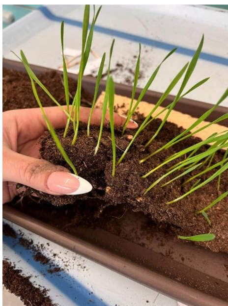
Slika 8. Priprema izdanaka za mjerenja

Prije svakog mjerenja, izdanci su pripremljeni te očišćeni od viška zemlje i svih nečistoća. Svaki odjeljak posude u kojoj je smješteno po jedno ponavljanje i čije mjerenje je predviđeno za taj dan mjerenja izvađen je zajedno sa zemljom (Slika 8). Laganim pokretima razdvajano je korijenje i sjeme izdanaka kako se ne bi uništili i pokidali izdanci. Zatim je svaki izdanak ručno očišćen od ostataka zemlje.