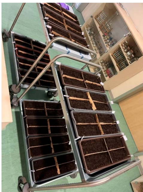
Slika 5. Sjeme pripremljeno za komoru