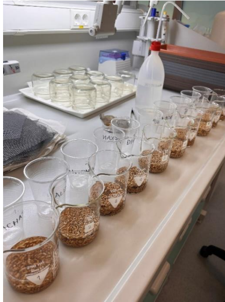
Slika 1. Priprema sjemena za dezinfekciju

Površinska dezinfekcija sjemena provedena je na sljedeći način. U svaku je čašu odvagano 15 g sjemena koje je onda preliveno destiliranom vodom. Sjeme je miješano na magnetnoj miješalici u trajanju od 5 minuta (Slika 2). Opisani postupak ponavljan je dva puta, a prilikom trećeg ponavljanja umjesto destilirane vode korištena je autoklavirana (sterilizirana) voda.