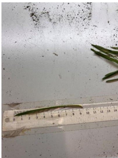
Slika 9. Mjerenje duljine izdanaka

Nakon izmjerene duljine izdanaka, svakom izdanku pojedinačno određena je i masa lista. Mjerenje mase lista obavljano je uz pomoć laboratorijske digitalne vage kako bi se dobila prosječna masa svakog izdanaka. Laboratorijska vaga je prije svakog vaganja tarirana na 0,00g, a svaki očišćeni izdanak pojedinačno stavljen na vagu (Slika 10).