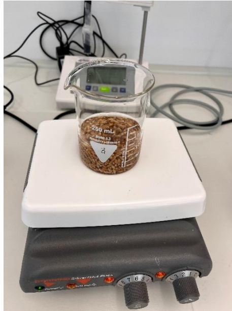
Slika 2. Miješanje sjemena na magnetnoj miješalici