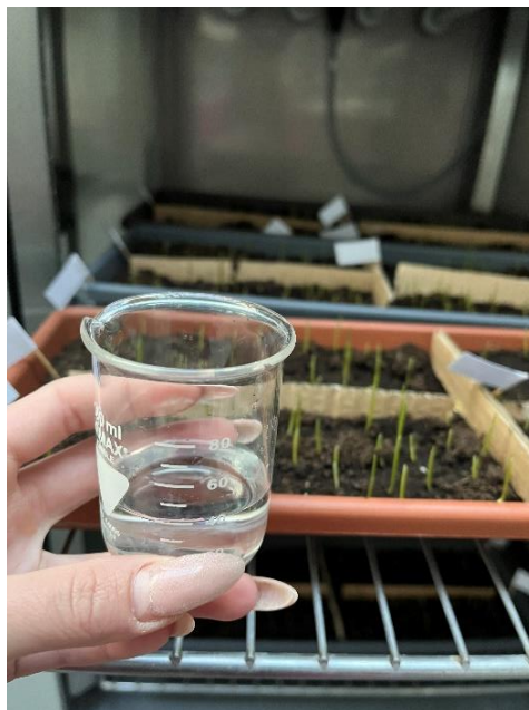
Slika 7. Zalijevanje izdanaka

Posijana pšenica, stavljena je u komoru za uzgoj biljaka. Temperatura u komori je namještena je na 20 °C, dok je svjetlosni režim podrazumijevao kontroliranu izmjenu svjetla koje je trajalo 10 sati i tame koja je trajala 14 sati (Slika 6). Pšenica je zalijevana destiliranom vodom svaki dan s 40 mL po ponavljanju kako bi se održala dostatna količina vlage potrebna za rast izdanaka (Slika 7).