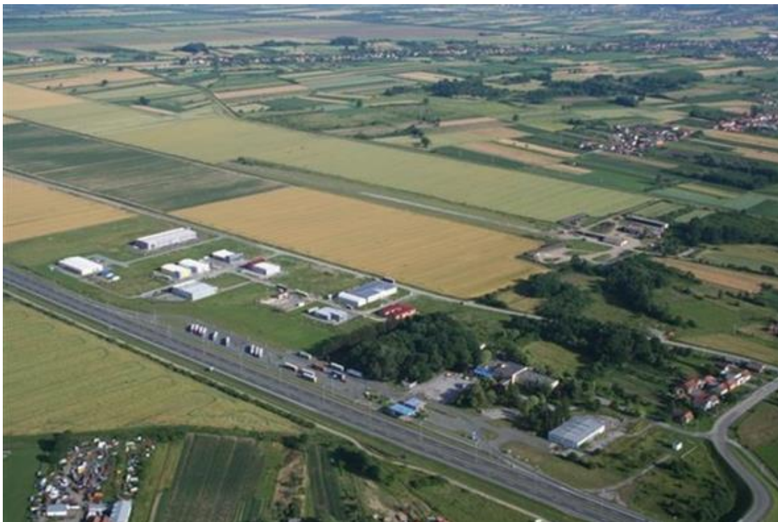
Slika 3. Industrijski park Nova Gradiška