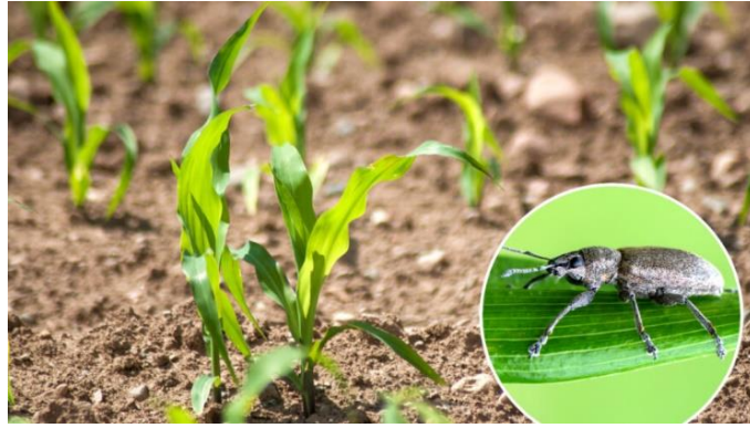
Slika 2. Kukuruzna pipa