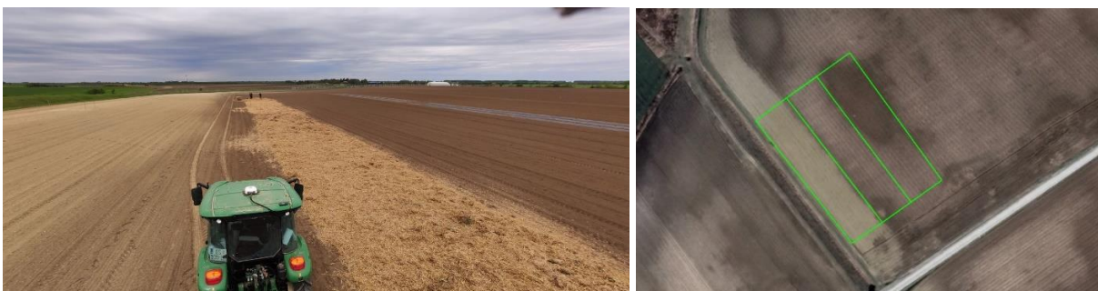
Slika 2. prikaz degradiranog tla na kojemu je podignut prvi pojas drveća i prvi međured usjeva

Na zapadnoj strani pokusnog polja nalazi se kanal, koji je iskopan sredinom prošlog stoljeća. Tijekom iskapanja, sva iskopana zemlja gomilana je uz rub kanala, što je dovelo do degradacije tla od kanala nadalje, a posebno na površini prvog pojasa i prvog međureda. Ova degradacija tla jasno je vidljiva golim okom prema boji tla (slika 2.) te je potvrđena rezultatima istraživanja provedenim za ovo istraživanje. Uzorci tla za analize prikupljeni su sondiranjem na dubinama do 30 cm i od 30 do 60 cm.