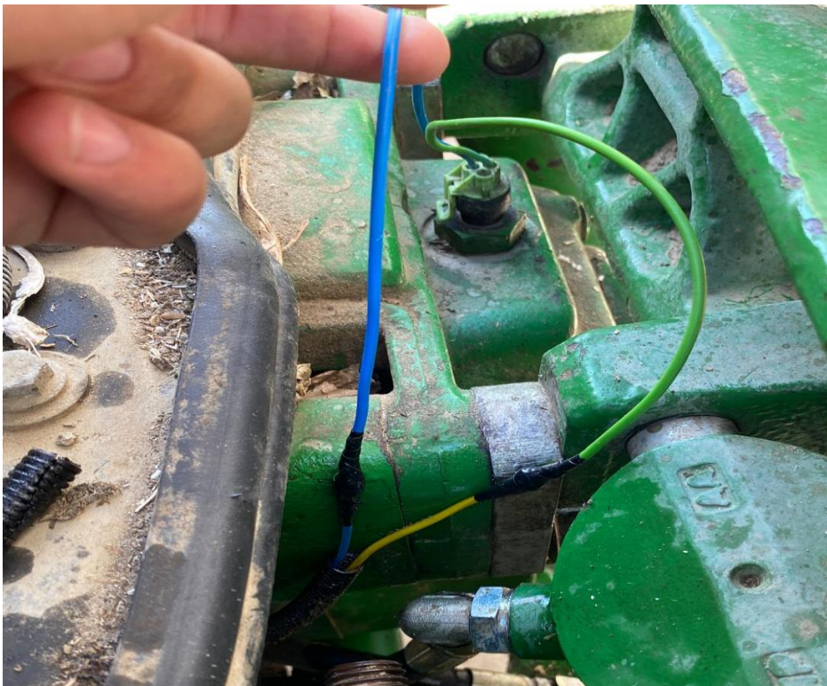
Slika 9. Oštećenost električne instalacije priključnog vratila