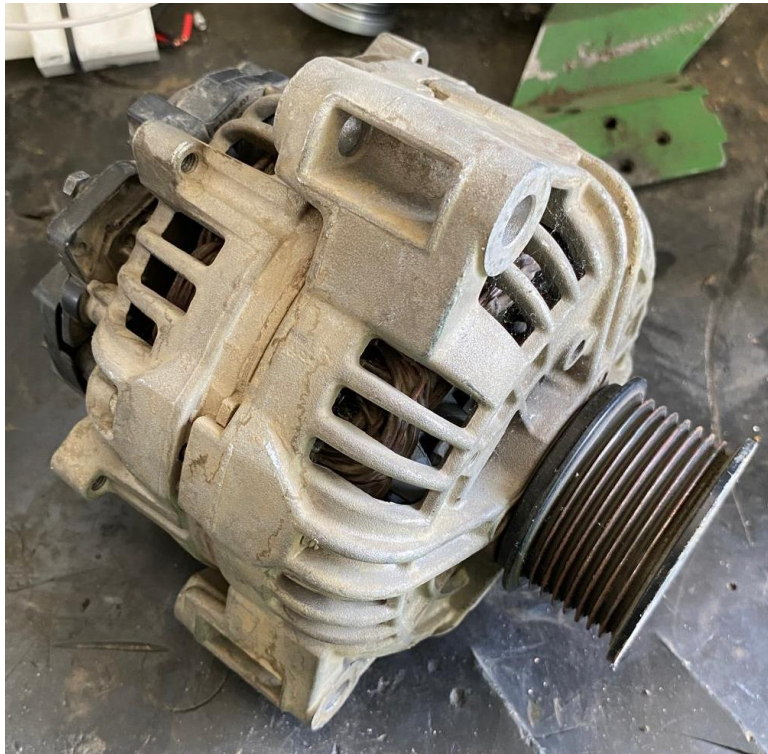
Slika 14. Neispravan alternator