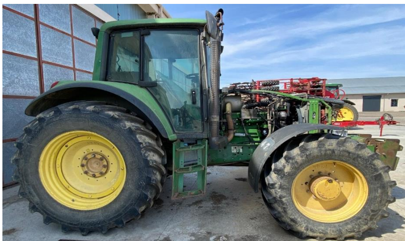
Slika 6. Traktor John Deere 6820