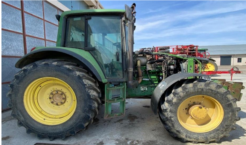
Slika 6. Traktor John Deere 6820