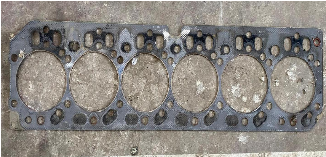
Slika 13. Neispravna brtva glave motora