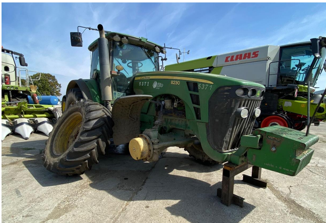
Slika 3. Traktor John Deere 8230

omogućuje automatsko mijenjanje stupnjeva prijenosa radi održavanja opterećenja motora. Traktor prikazan na slici 3, proizveden je 2008. godine, naknadno opremljen sa Trimble navigacijom. Koriste se pri oranju, podrivanju, transportu, gaženju silaže i gnojidbi organskim stajnjakom. Broj radnih sati traktora je 24442 h, a matični broj je 5371.