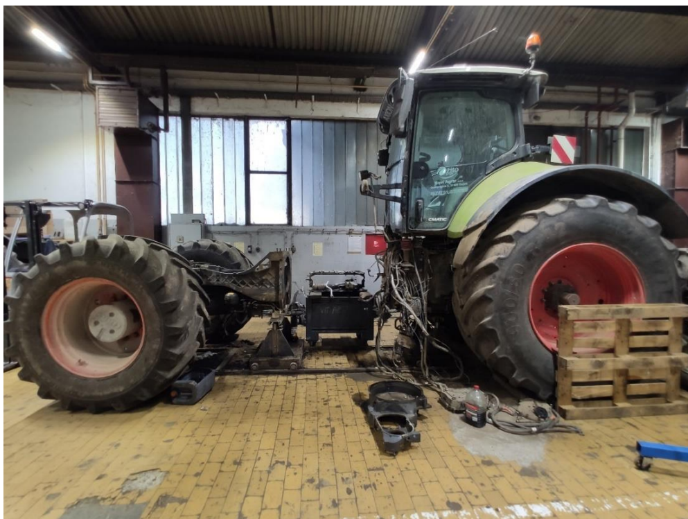
Slika 2. Traktor CLAAS Axion 960