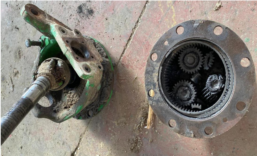
Slika 15. Oštećenje pogonskih pokretača prednjeg mosta