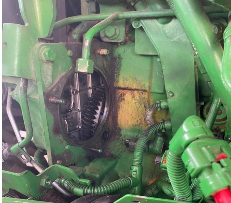
Slika 16. Zamjena visokotlačne crpke