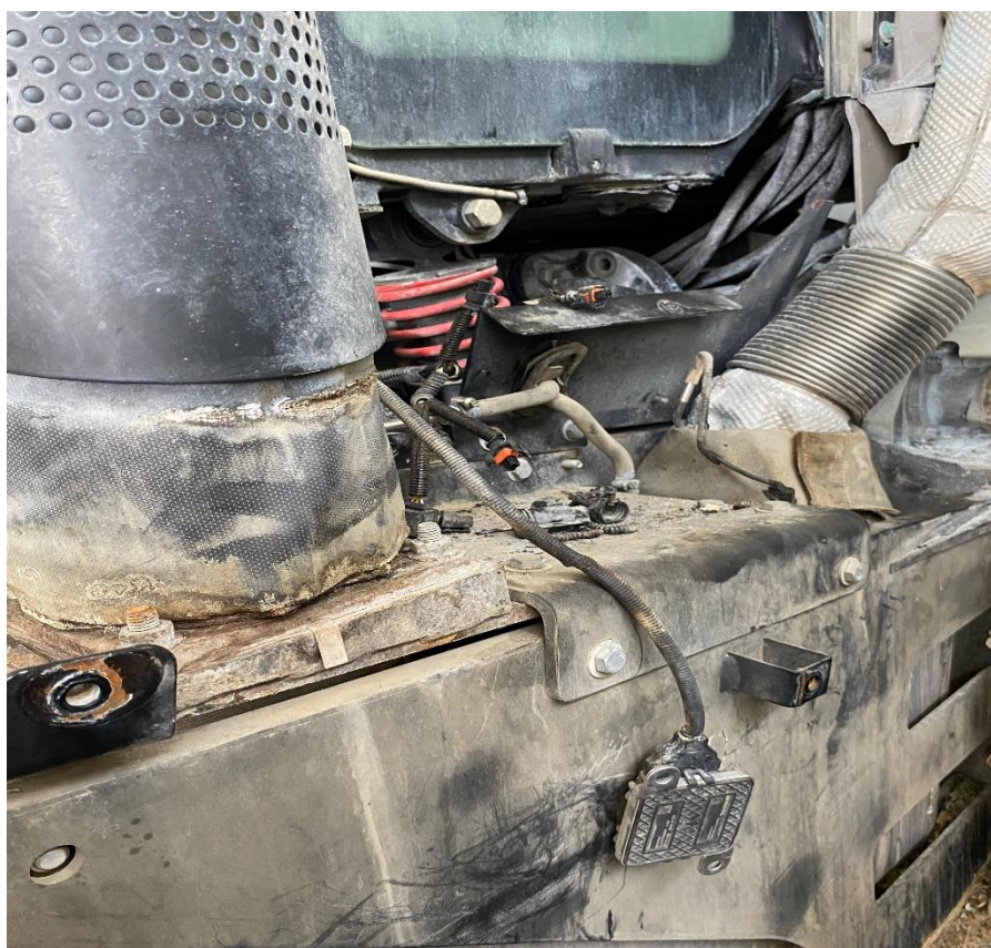
Slika 8. Zapaljenje električne instalacije