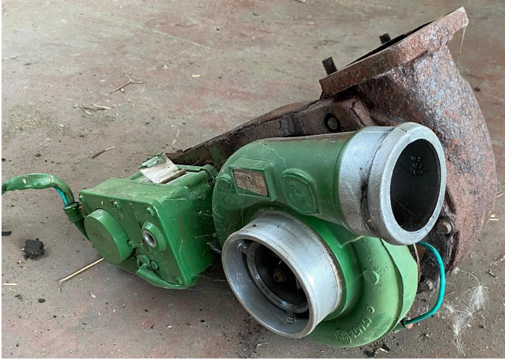
Slika 12. Neispravan turbopunjač