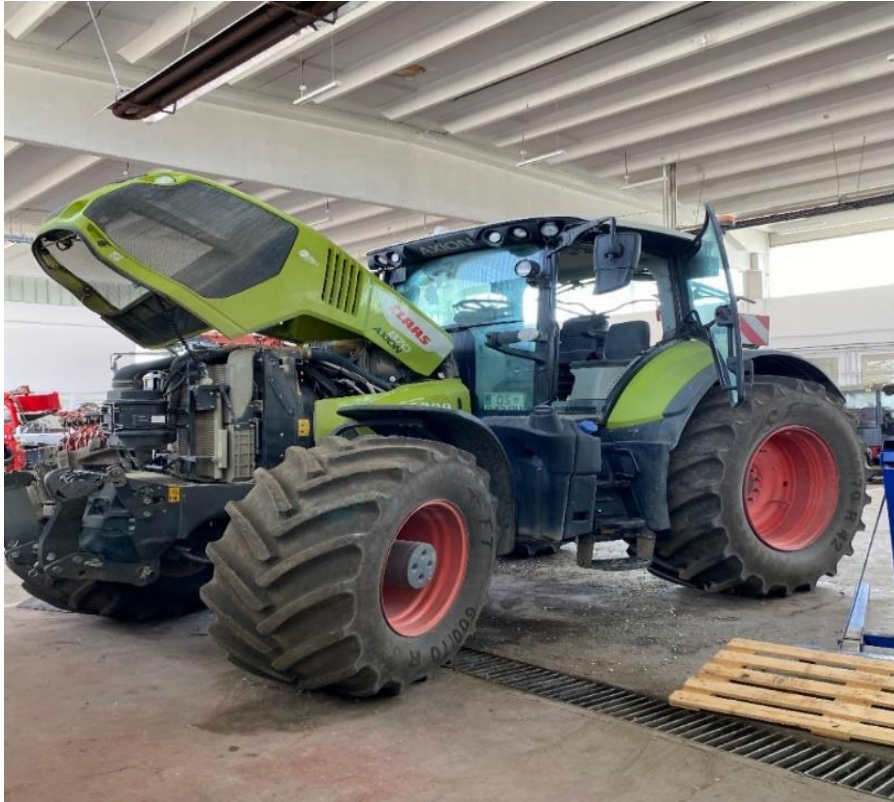
Slika 1. Prikazuje traktor CLAAS Axion 870