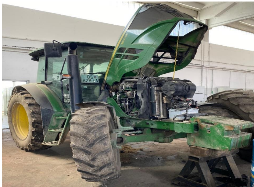
Slika 7. Traktor John Deere 6100 MC

John Deere 6100 MC, prikazan na slici 7, je traktor s pogonom na 4 kotača, proizveden 2016. godine. Masa mu je 4,7 tona, a pokreće ga motor snage 78 kW. Traktor ima transportnu duljinu od 4,727 metara i može se kretati brzinom od 40 km/h. Ima transportnu širinu od 2,49 metara i transportnu visinu od 2,77 metara. Traktor se koristi na farmama, pri transportu, pokretanju mikserica i drugim poslovima. Broj radnih sati traktora iznosi 9221 h, a matični broj mu je 5568.