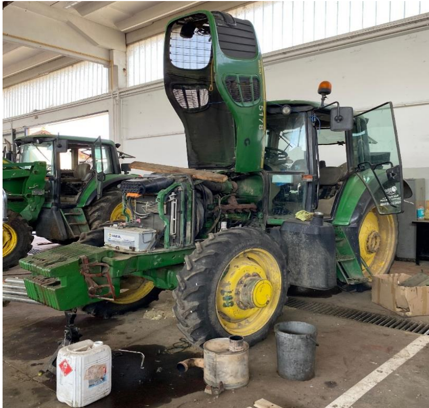
Slika 5. Traktor John Deere 6830

na farmama. Traktor je proizveden 2006. godine. Broj radnih sati traktora je 20096 h, a matični broj traktora 5178.