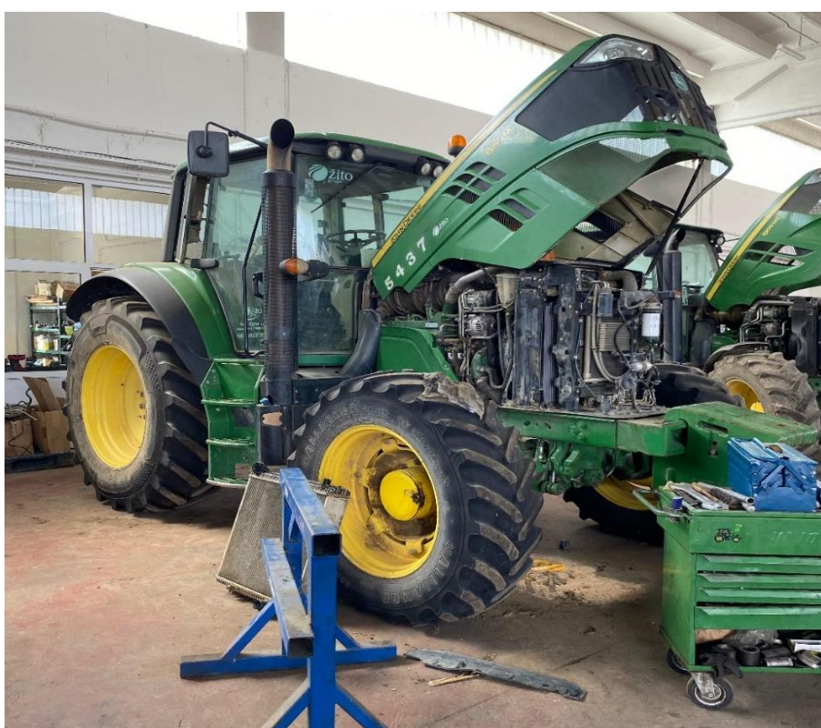
Slika 4. Traktor John Deere 6150 M

Traktor John Deere PowerTech PVX s turbopunjačem varijabilne geometrije s međuhladnjakom, pokreće 6-cilindrični dizel motor hlađen tekućinom zapremine 6,8 l. Snage motora je 116,3 kW, i zakretnog momenta 676,6 Nm. Opremljen je 20-brzinski djelomičnim power shift mjenjačem, pogonom na sva 4 kotača, prednjom ugibljivom osovinom (TLS) i Trimble navigacijom. Traktor prikazan na slici 4, koristi pri sjetvi, međurednoj obradi tla i transportu. Traktor je proizveden 2015 godine, i broj radnih sati mu je 14690 h. Matični broj traktora je 5437.